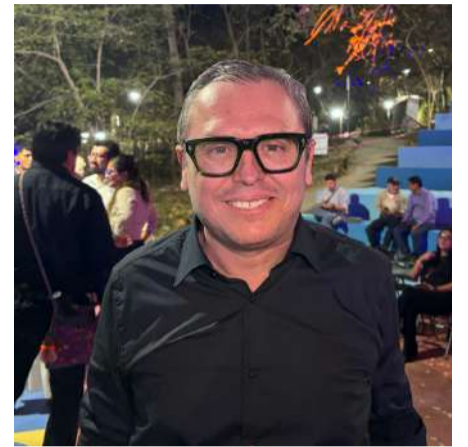
Se apuesta a la creación de carreras innovadoras en el área de Inteligencia Artificial

de calidad y eso es un H-Flex”, sostuvo.