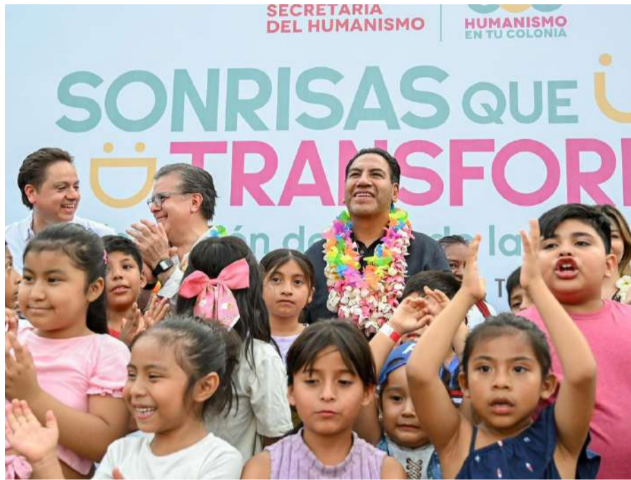
El evento reunió a cientos de menores en un espacio público de la periferia capitalina