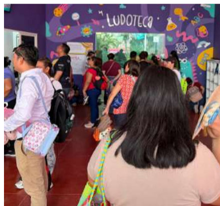
Más de ocho mil estudiantes participaron en actividades educativas y recreativas

En el marco de este evento, los pequeños también disfrutaron de actividades recreativas como paseos a caballo, rifa de regalos y proyec-