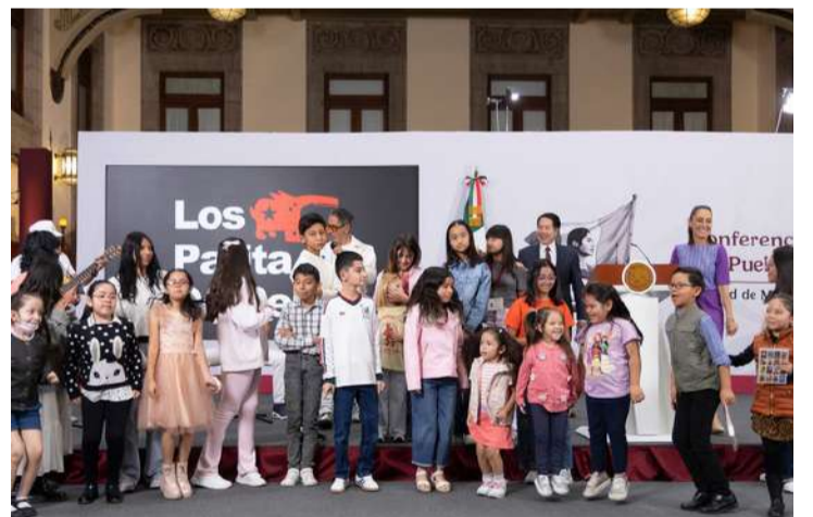
Tarjeta “Rita Cetina” depositará dos mil 500 pesos a familias de primarias públicas

2025-2026 hay 20.2 millones de niñas y niños inscritos en las 203.6 mil escuelas de Educación Básica de todo el país. Además, se distribuyeron 155.6 millones de Libros de Texto Gratuitos (LTG).