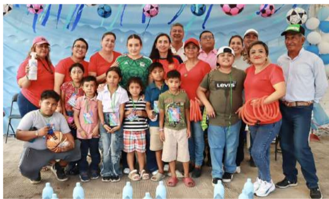
La alcaldesa Valeria Rosales organizó actividades deportivas, culturales y recreativas.

En la Plaza de la Constitución de Villaflores se llevó a cabo el festival “Mundialito del Día del Niño y de la Niña”, organizado por el Ayuntamiento de Villaflores a iniciativa de la alcaldesa Valeria Rosales Sarmiento, para festejar a la niñez villaflorense este 30 de abril.