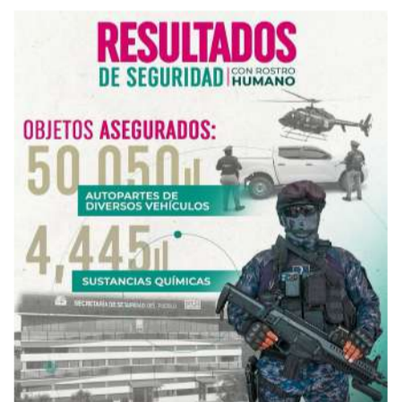
Implementa acciones estratégicas para frenar la delincuencia

La coordinación interinstitucional y el uso de tecnología avanzada han sido esenciales para el éxito de