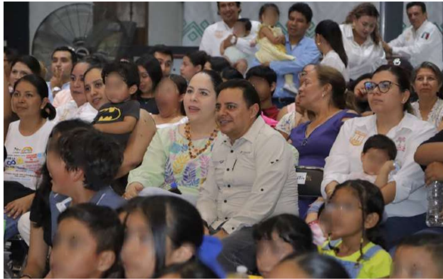
Un detalle especial fue la entrega de obsequios

Durante el evento, los niños y niñas vivieron una experiencia divertida e interactiva, con un espectáculo infantil que incluyó música, bailes y personajes mágicos que hicieron reír a los pequeños. El entusiasmo y las sonrisas de los festejados se convirtieron en el alma de la celebración, contagiando a todos los asistentes con su energía positiva.