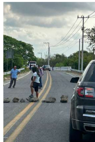
Habitantes de comunidades chiapanecas exigen mejoras al servicio de la CFE

El cierre de la vía generó afectaciones a la circulación vehicular, dejando varados a automovilistas y unidades del transporte público. Ante esta situación, varios ciudadanos