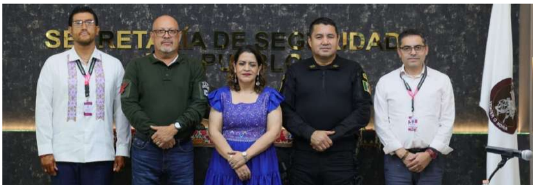
Fortalecer los vínculos para la seguridad en los próximos procesos

Con esta actividad, el Voluntariado del Poder Judicial del Estado reafirma su compromiso con la familia judicial, promoviendo la sana convivencia y el fortalecimiento de la unidad familiar en espacios que fomentan la alegría, el respeto y el compañerismo. La celebración del Día de la Niñez se convierte así en una tradición que contribuye a “Construir esperanza desde el corazón de la justicia”.