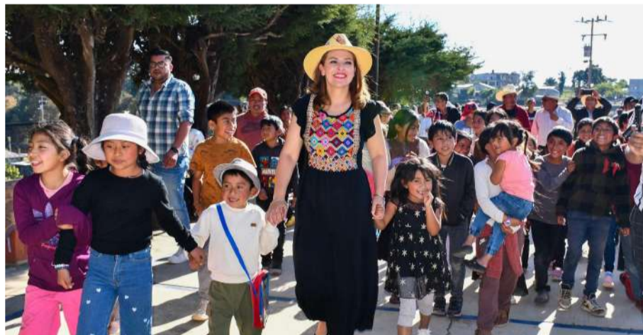
Niñas y niños disfrutaron de una jornada llena de diversión y sorpresas

Durante su visita a la primaria “José Vasconcelos Calderón” en El Pinar Cuxtitali, la alcaldesa convivió con niñas y niños, quienes disfrutaron de juegos, sorpresas y momentos de esparcimiento. Fabiola Ricci expresó su satisfacción por compartir estas actividades con los menores y destacó la importancia de mantener un gobierno cercano a la comunidad.