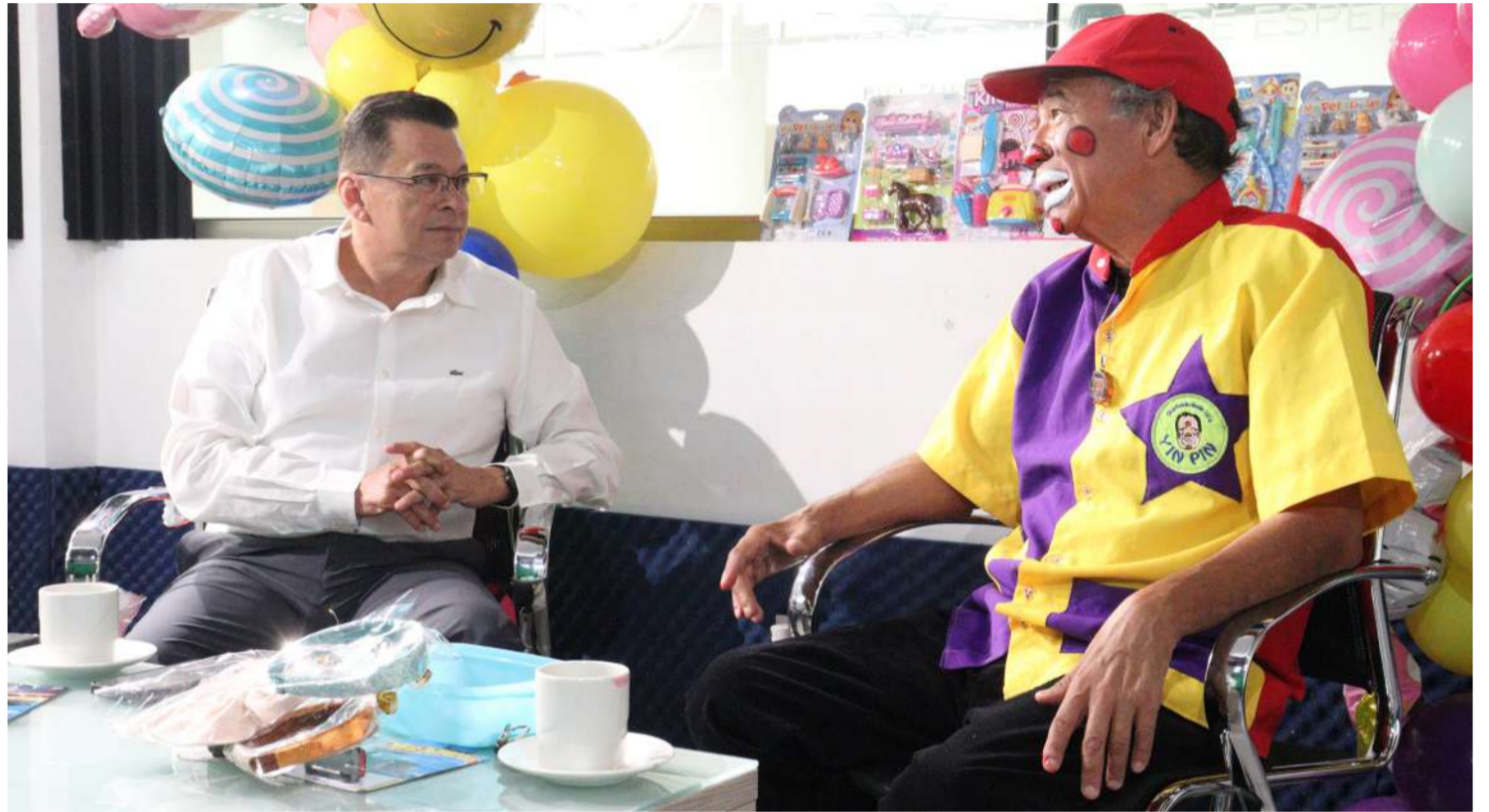
Con más de cinco décadas en escena, continúa llevando risas a nuevas generaciones mientras adapta su arte a los tiempos digitales

■ A sus 65 años y con más de medio siglo de carrera, el payaso chiapaneco defiende la infancia como un espacio de juego, valores y alegría genuina, en contraste con una era dominada por pantallas y prisas por crecer