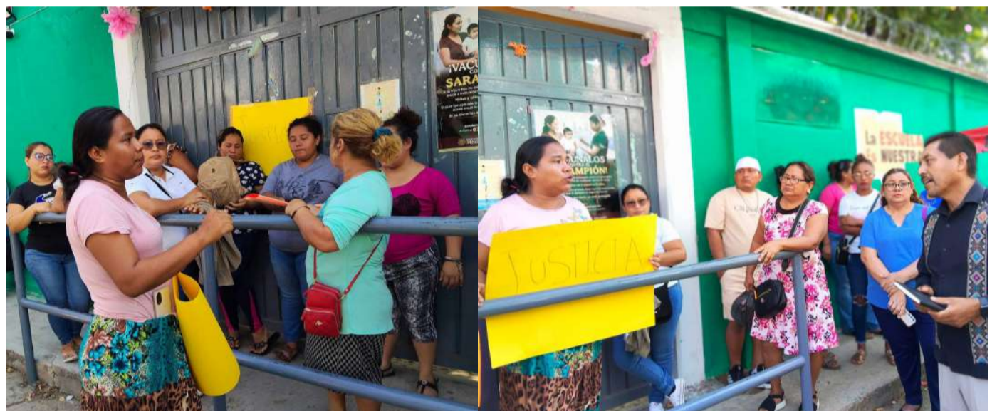
Autoridades educativas y ministeriales trabajan en paralelo para determinar el alcance de las responsabilidades

La madre del menor afectado responsabilizó a adultos del entorno escolar por una presunta omisión ante agresiones previas que, según afirmó, ya habían sido reportadas por su hijo. Aseguró que el menor sufría actos de acoso antes del presunto abuso sexual y que, pese a que docentes y directi-