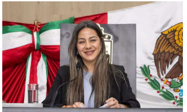
La sesión procesó además cambios en la integración del cuerpo legislativo y autorizó ajustes en la representación de un ayuntamiento municipal.