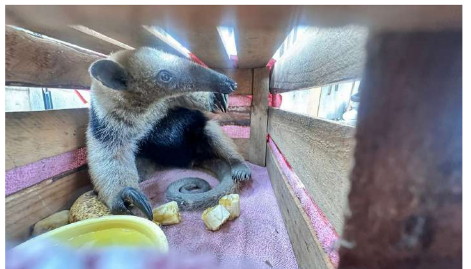
Elementos especializados aseguraron al ejemplar sin causarle daño

Autoridades destacaron la importancia de proteger la fauna silvestre y exhortaron a la población a no intentar capturar animales