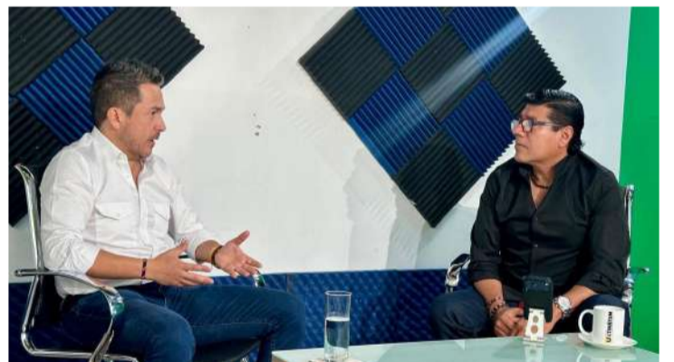
El dirigente destacó la fuerza del partido en Chiapas

En la entrevista también abordó temas nacionales como la reforma para reducir