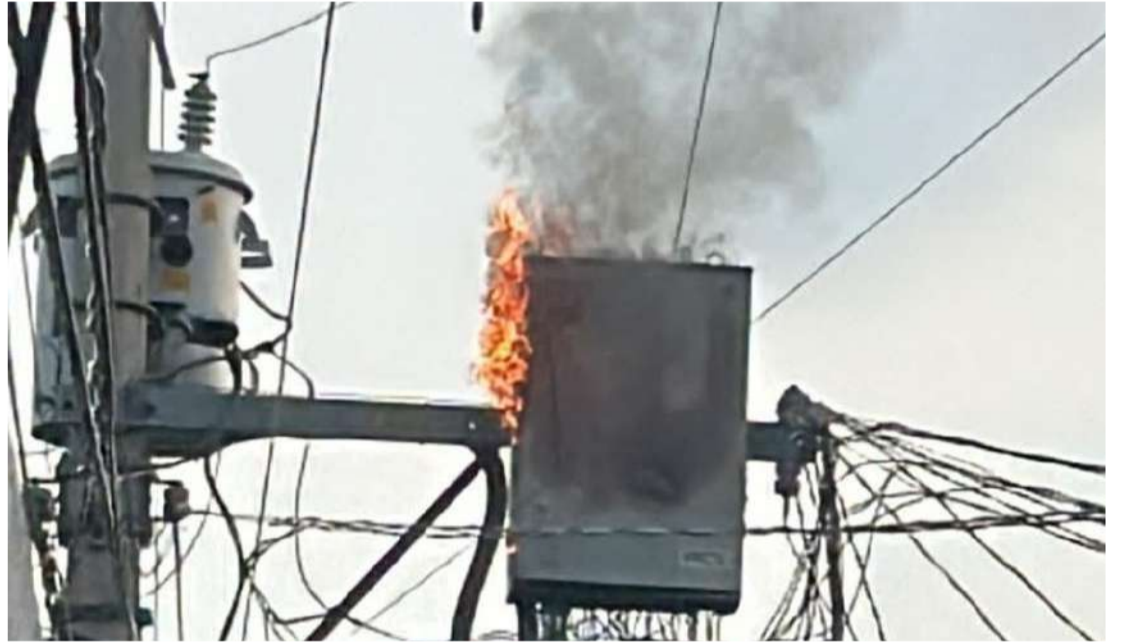
La tarde de este miércoles, un transformador se incendió entre Galeana y Puerto Arista

Afortunadamente no se reportaron personas lesionadas, únicamente afectaciones en el suministro eléctrico de la zona.