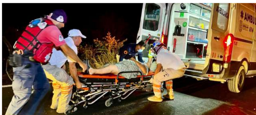
Varios sujetos bajaron de un taxi y atacaron a la víctima en la calle 5 de Febrero

Hasta el cierre de esta edición se desconocían las causas de la agresión, así como la identidad y paradero de los responsables. Elementos de las corporaciones de seguridad tomaron conocimiento de los hechos e iniciaron las investigaciones correspondientes.