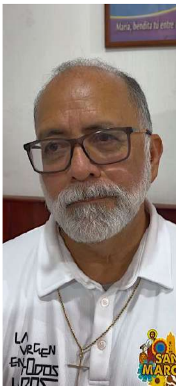
Rector advierte que bloqueos impactan también al personal y servidores de la iglesia

El sacerdote explicó que el cierre de calles derivado de las protestas magisteriales impacta directamente a quienes acuden diariamente al templo, ya que la mayoría de los visitantes provienen de distintos puntos de la ciudad e incluso del interior del estado. “Es un poquito complicado porque cierran las vialidades y entonces la gente que viene a la catedral no es gente del