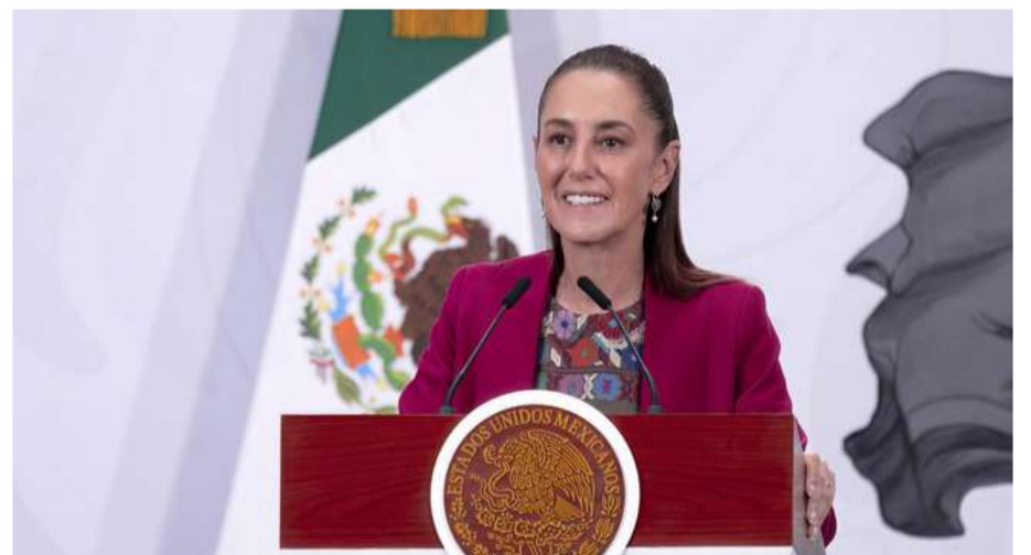
Es el primer minivehículo eléctrico diseñado en México

Además, la Jefa del Ejecutivo Federal informó que en julio se dará a conocer la versión de carga de Olinia. Asimismo, reconoció que se trata del trabajo de un equipo de más de 80 mexicanos y mexicanas entre académicos, académicas, técnicos y técnicas de distintos lugares del país del Tecnológico Nacional de México (TecNM), el Instituto Politécnico Nacional (IPN) y de los Centros Públicos de Investigación, el cual se mantendrá una vez que