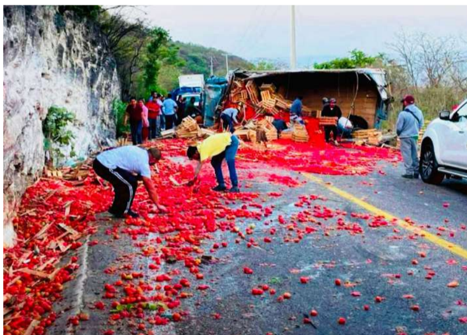
La dispersión de la mercancía sobre el pavimento generó una situación de riesgo adicional

El conductor recibió atención en el lugar por elementos de Protección Civil, quienes valoraron si requería traslado a un centro hospitalario. Autoridades de seguridad y tránsito acudieron para realizar las diligencias correspondientes y deslindar responsabilidades.