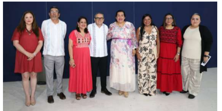
Se destacó la alfabetización digital como herramienta para decisiones informadas y responsables