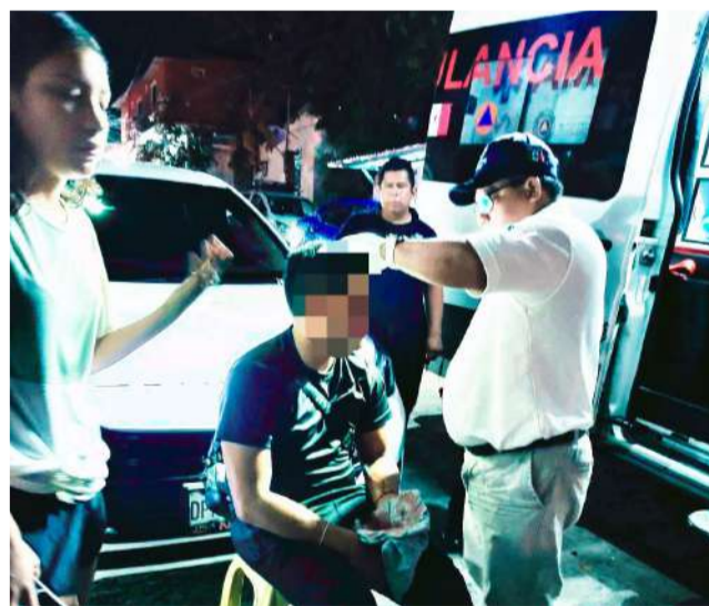
Adulta mayor resultó lesionada tras impacto entre dos vehículos en tramo nocturno

La conductora de la camioneta, una mujer de edad avanzada, sufrió diversas lesiones a consecuencia del choque. Elementos de la