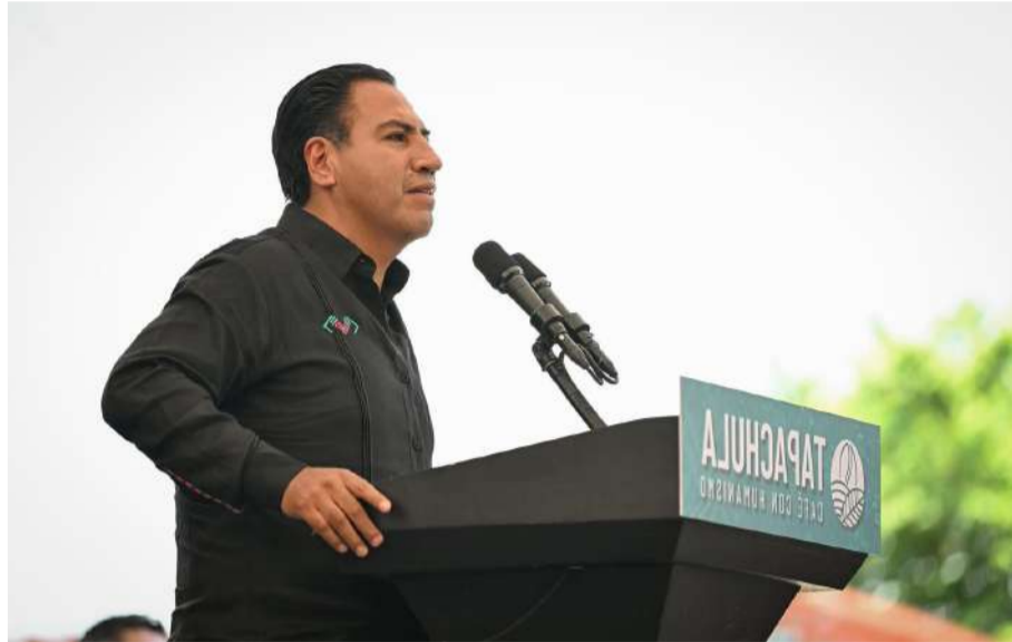
La entrega en Tapachula marca el inicio de una gira de distribución que llevará apoyos similares a decenas de municipios

Ramírez Aguilar subrayó que el programa impulsa apoyos en plantas, insumos y equipamiento, además de asesoría técnica y profesional en los 82 municipios dedicados a la producción cafetalera. Señaló que la estrategia busca eliminar intermediarios y mejorar las condiciones laborales, los ingresos y las relaciones comerciales de los