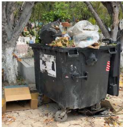
Fugas de aguas negras y saqueos en el cementerio capitalino

Habitantes critican la falta de seguridad, pues se han registrado robos y daños a tumbas, lo que genera temor entre quienes acuden al panteón. “Se cobra una cuota para el mantenimiento. Es nuestra última casa y debería estar en