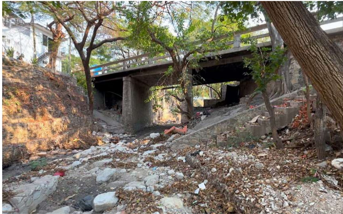
El cauce urbano atraviesa una zona habitacional densamente poblada donde cientos de familias conviven a diario

Los vecinos señalaron que, pese a los reportes y solicitudes realizadas al