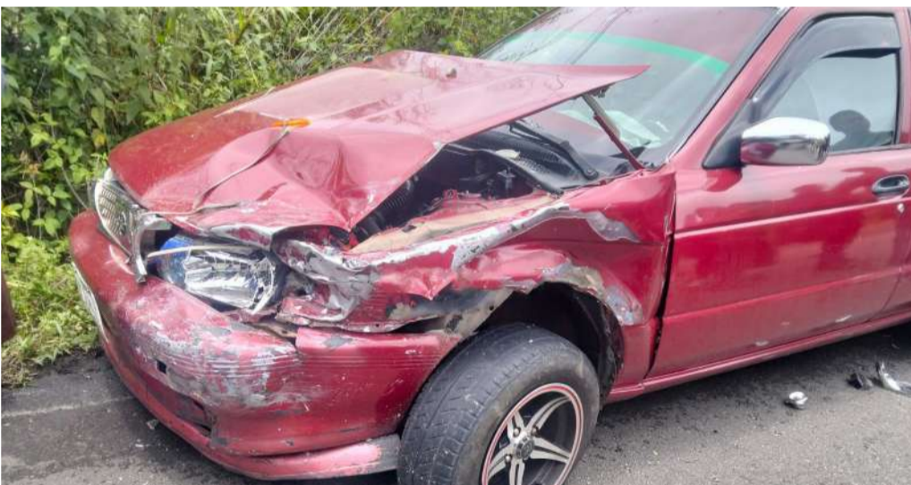
Uno de los vehículos aparentemente cruzó al carril contrario

Hasta el momento se desconocen los motivos que llevaron a esta situación. Serán las investigaciones oficiales las que esclarezcan los hechos y den respuesta a los vecinos, quienes permanecen consternados por lo ocurrido.