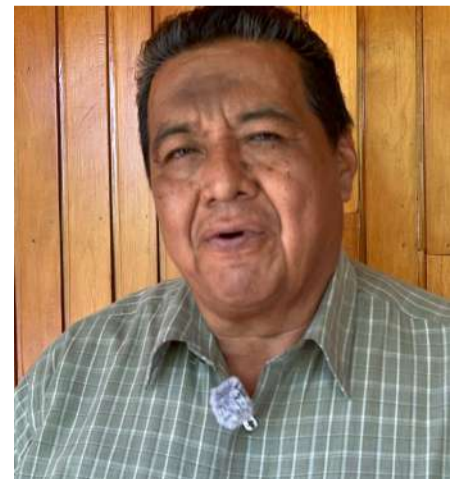
Empresarios advierten que restricciones alejan compradores centroamericanos hacia El Salvador

En otro tema, Canacindra anunció un foro este sábado en el parque temático de Fruticultores, abierto a empresarios y productores con dudas sobre proyectos productivos. Ruiz Méndez alertó además sobre las dificultades de acceso a créditos de organismos como Nafin y Fofoe, cuyos requisitos excluyen a solicitantes con cualquier registro en el Buró de Crédito, incluso por adeudos mínimos. “No se puede ser tajante en un no cuando se está en buró por algo insignificante”, afirmó. Señaló que la cámara trabaja