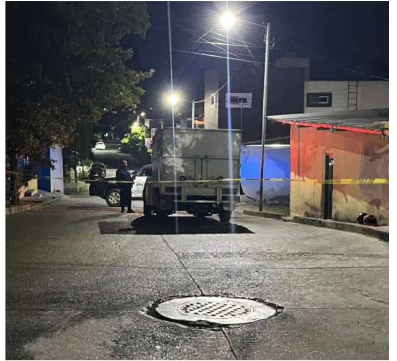
Vecinos descubren cadáver colgado en vivienda

El incidente mantiene en alerta a las autoridades locales, quienes hacen un llamado a la población a extremar precauciones en la zona y respetar los límites de velocidad para evitar tragedias similares. La investigación continúa para deslindar responsabilidades.