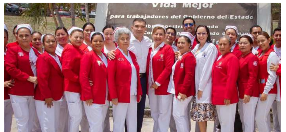
Personal participó en la ceremonia por el Día Internacional de la Enfermería

Desde el instituto se agradece profundamente a estos “ángeles blancos”, cuya labor silenciosa y constante refuerza la atención integral y fortalece la confianza de la población en el sistema de salud.