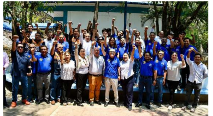
Permitirá una mejor operación de la Escuela de Tecnologías Digitales Aplicadas

Por su parte, autoridades académicas coincidieron en que este nuevo espa-