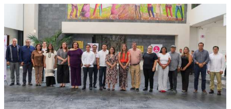
Se busca fortalecer el diálogo, el debate y la participación cívica entre la juventud