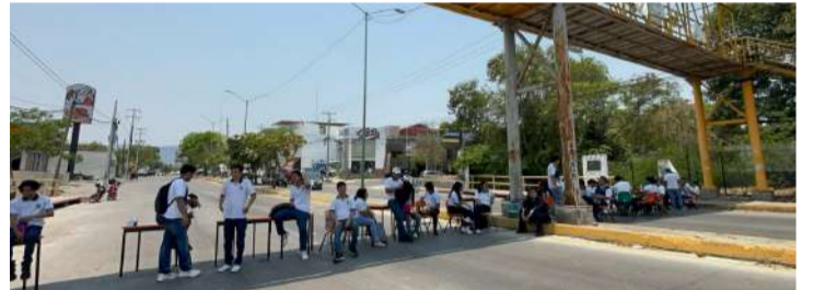
Estudiantes cerraron la Calzada al Sumidero para solicitar investigaciones

ciaron que durante varios años existió temor entre los alumnos para denunciar las presuntas irregularidades, debido a posibles represalias o expulsiones.