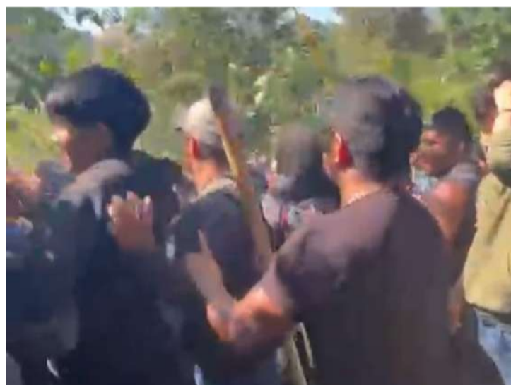
La tensión continúa entre pobladores de Vololch'ojon y Cruzton

Hasta la mañana de este lunes, autoridades tradicionales y representantes