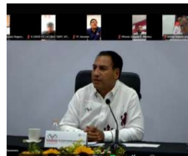
Alcalde participa en estrategia estatal de Protección Civil

Las autoridades estatales y municipales analizaron mecanismos de coordinación, medidas preventivas y estrategias de respuesta inmedia-