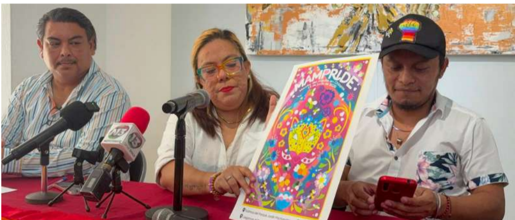
Es una movilización que busca exigir avances en políticas públicas incluyentes

geles Polanco Enciso, afirmó que el inmueble será un lugar donde converjan los sueños y aspiraciones de futuras generaciones universitarias.