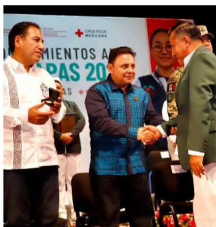
Destacan vocación al servicio de la salud

En este encuentro participaron representantes del sector salud, integrantes de las Fuerzas Armadas y autoridades estatales y federales, quienes coincidieron en la importancia de fortalecer y dignificar la