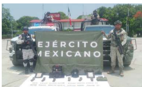
Fuerzas federales reforzaron patrullajes en la Costa de Chiapas

Durante los reconocimientos terrestres, las fuerzas federales localizaron