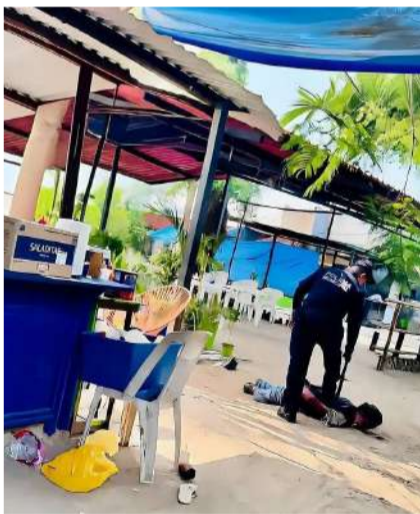
El empresario fue hospitalizado en estado delicado

Paramédicos de Protección Civil y de la Cruz Roja Mexicana acu-