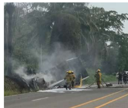
El camión comenzó a incendiarse tras el impacto

Elementos de la Secretaría de Seguridad Pública Municipal, integrantes de la Fuerza de Reacción Inmediata Pakal y personal de la Guardia Nacional División Caminos implementaron un operativo para resguar-