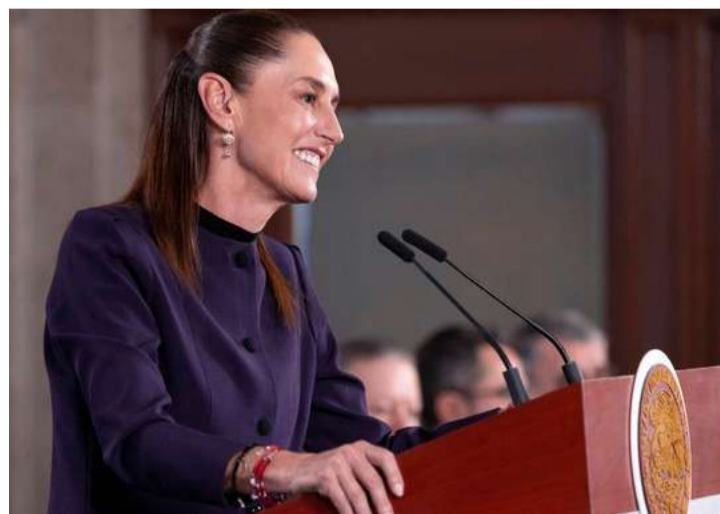
Iniciativa también simplificará boletas y creará Comisión Coordinadora de evaluación

Sheinbaum Pardo detalló que, de mantenerse la elección en 2027, la ciudadanía tendría que trasladarse entre diferentes centros de votación para elegir cargos municipales, estatales y judiciales, lo que complica-