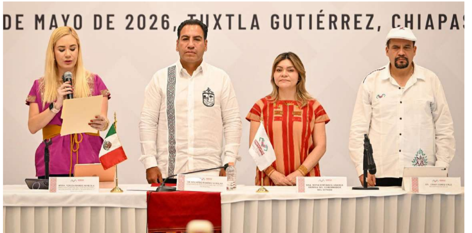
El galardón entregado al enfermero chiapaneco reconoció décadas de atención directa en parajes sin camino pavimentado

En este marco, fue entregada la Medalla al Mérito de Enfermería Chiapas