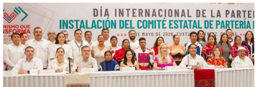
Busca reforzar una atención médica más cercana, humana y con respeto a las tradiciones

Asimismo, reiteró el compromiso de trabajar en una atención médica más cercana y sensible a las necesidades de la población, fortaleciendo acciones que permitan garantizar servicios de salud con respeto a las costumbres y a la diversidad cultural de las comunidades chiapanecas.