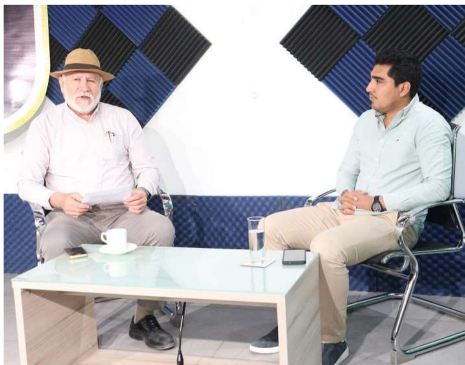
Buscarán competir sin alianzas en alcaldías de Chiapas

Asimismo, expresó su respaldo a la propuesta de paridad de género impulsada por el gobernador, al considerar que representa un precedente importante para garantizar mayor