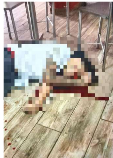
El ataque quedó captado en videos de vigilancia

Las autoridades también señalaron que se encuentran analizando las cámaras de videovigilancia instaladas en el negocio y calles cercanas con el objetivo de identificar y localizar al responsable. Mientras tanto, habitantes de la región Frailesca exigieron mayor seguridad y resultados inmediatos para esclarecer este crimen que generó indignación entre la población.