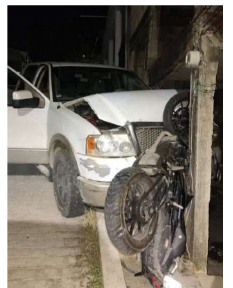
No hubo lesionados

Durante la trayectoria, la camioneta impactó una motocicleta que estaba estacionada sobre la vía pública y posteriormente terminó incrustada contra la pared de una vivienda, dejando la moto completamente aplastada entre ambas estructuras.