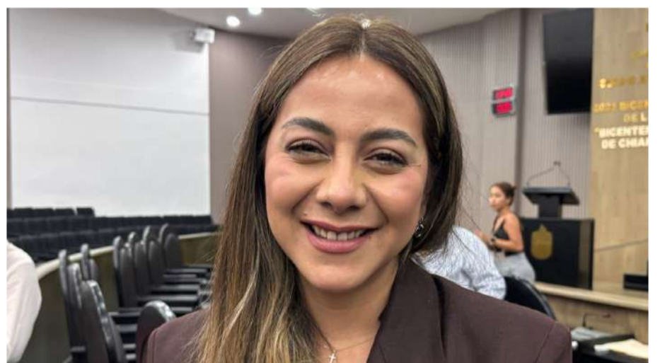
La diputada afirmó que la Cuenta Pública 2025 refleja inversión estatal en sectores prioritarios

“Hoy vemos grandes avances en infraestructura, en alfabetización