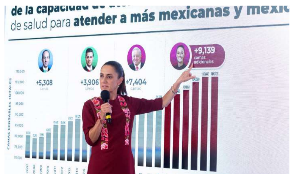
Se presentaron obras y proyectos para fortalecer la atención médica en IMSS, ISSSTE e IMSS Bienestar

Por su parte, el director general del IMSS, Zoé Robledo, señaló que en los últimos meses ya fueron inaugurados hospitales en entidades como Chihuahua, Baja California, Chiapas, Puebla, Ciudad de México, Campeche y Sonora. Añadió que ac-