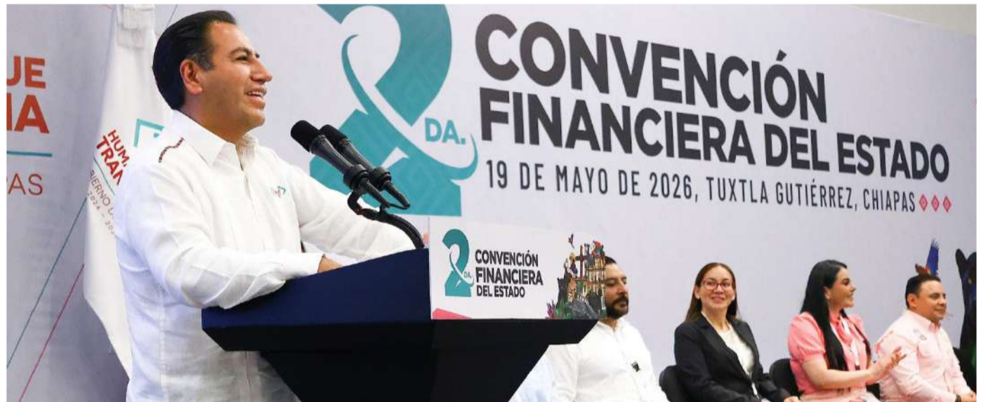
El encuentro reunió a los responsables de las haciendas municipales con los titulares de las finanzas estatales

dan las necesidades prioritarias de cada municipio.