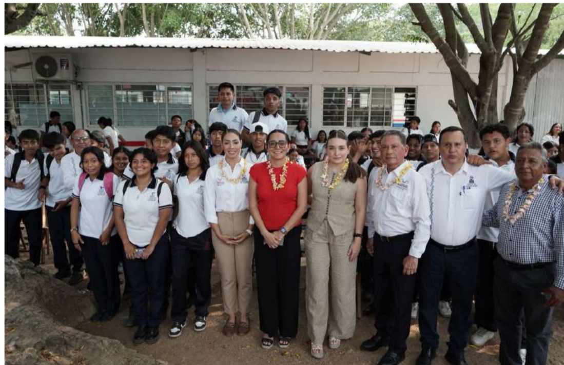
Nuevas instalaciones beneficiarán directamente a 215 estudiantes de nivel medio superior

La obra contempló la construcción y equipamiento de dos nuevas aulas, además de trabajos de obra exterior, red eléctrica, andadores y señalización,