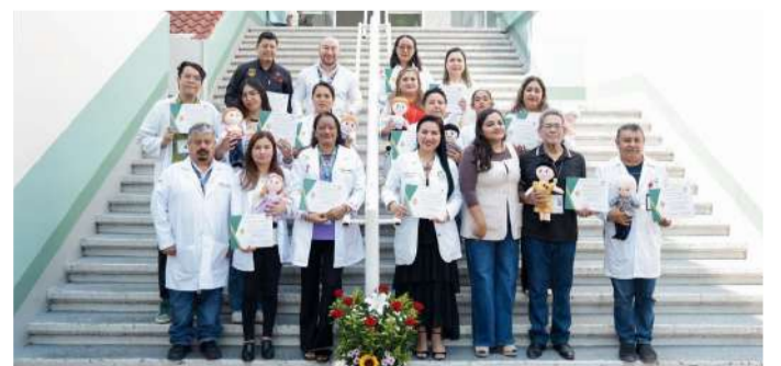
Especialistas recibieron reconocimientos y capacitación durante actividades conmemorativas

De igual forma, la Subdirección de Salud de la Mujer y la Coordinación de Violencia de Género de la Secretaría de Salud realizaron la donación de muñecos anatómicos sexuales, herramientas que permitirán reforzar la atención a menores de edad probables víctimas de violencia sexual y mejorar los procesos de intervención especializada.