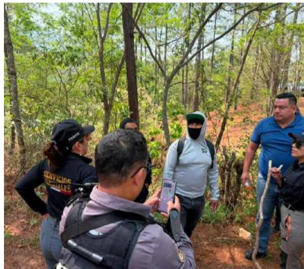
Elementos de seguridad y pobladores realizaron recorridos en zonas boscosas

En estas acciones participan elementos de dis-