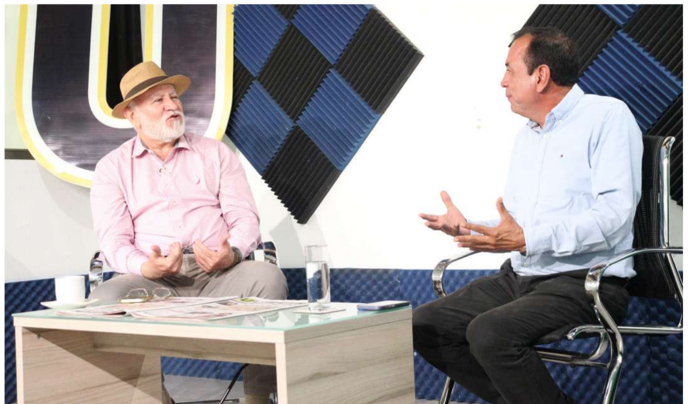
El libro propone replantear la formación docente desde una visión crítica, comunitaria y vinculada a las realidades culturales de Chiapas

de alfabetización “Chiapas Puede”, orientado a reducir el rezago educativo en la entidad.