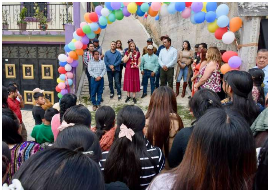
Durante el recorrido, también supervisó el tanque de agua

La presidenta municipal también resaltó los avances del proyecto del Periférico Norte, una obra que calificó como histórica para San Cristóbal de Las Casas, al señalar que ya se encuentra en ejecución