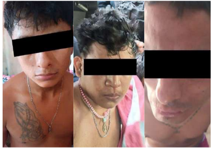
Se solicitará penas de hasta 85 años de prisión contra los detenidos

Asimismo, Jorge Luis Llaven Abarca indicó que el Ministerio Público solicitará penas de hasta 85 años de prisión contra los tres dete-