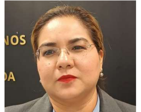
La diputada afirmó que la administración municipal debe responder con acciones inmediatas

En otro tema, ante los llamados ciudadanos para reforzar las campañas de reforestación durante la próxima temporada de lluvias, Ibarra Gallardo advirtió que los programas ambientales nunca serán suficientes si no existe