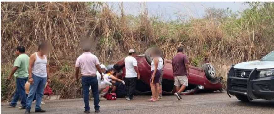
Los heridos fueron trasladados a un nosocomio rural

al reiterar que la Fiscalía mantendrá las acciones para combatir los delitos de alto impacto en Chiapas.