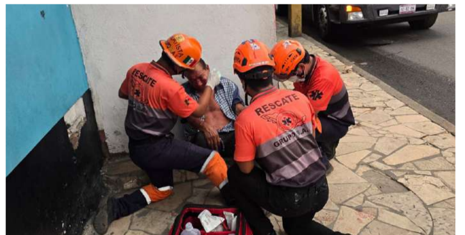
Dos mujeres habrían atacado al hombre con un palo de escoba

Los paramédicos realizaron curaciones y vendajes para controlar las heridas, sin que fuera necesario su traslado a un hospital. El pacien-