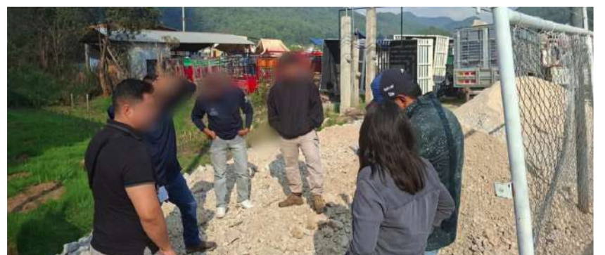
Autoridades municipales y la CONANP realizaron inspecciones

Finalmente, personal de ecología municipal señaló que, derivado de estas acciones, se iniciará el procedimiento administrativo y judicial correspondiente por posibles daños ambientales, reiterando el compromiso de las autoridades para proteger y conservar los humedales, considerados ecosistemas fundamentales para San Cristóbal de Las Casas.