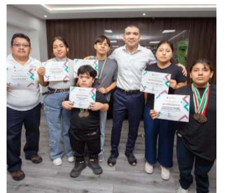
El director general del ISSTECH, Luis Ignacio Avendaño Bermúdez, destacó el desempeño de las y los integrantes del equipo

Avendaño Bermúdez señaló que el desempeño de las y los atletas es ejemplo de perseverancia y compromiso, además de inspirar a nuevas generaciones a practicar deporte y mantener hábitos saludables. Asimismo, reiteró el