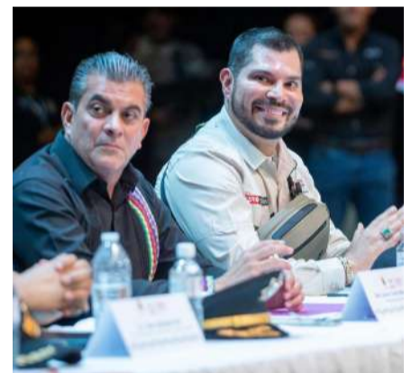
Firmó convenio para ampliar oportunidades académicas a Personas Privadas de la Libertad