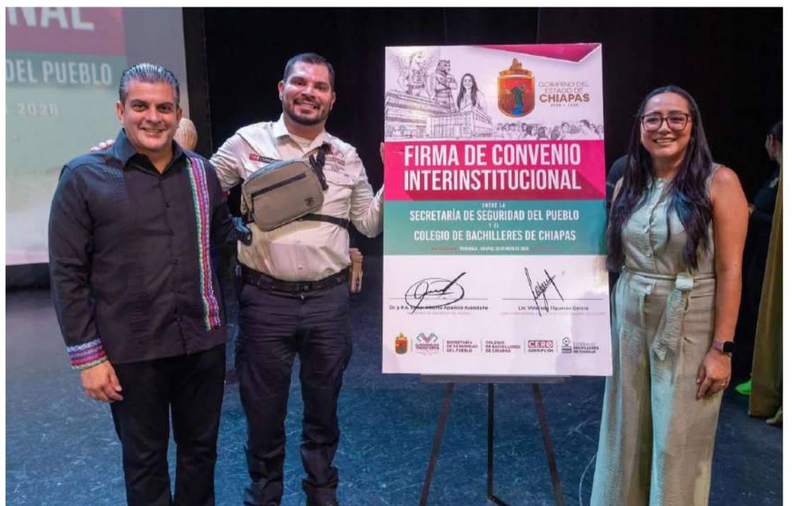
186 internos de tres centros penitenciarios estudian nivel medio superior en 2026