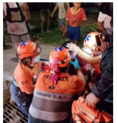
El accidente dejó a un hombre de 25 años con traumatismos

Los socorristas detectaron que el conductor presen-