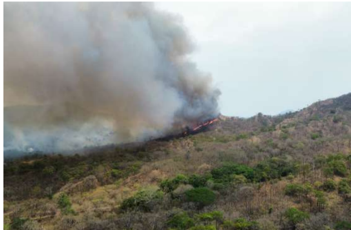
El siniestro ya ha afectado 470 hectáreas

Como parte de las estrategias implementadas para