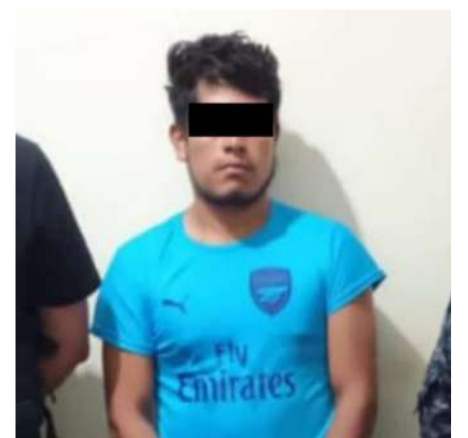
Isaías "N" fue encontrado responsable del delito de homicidio

Aunquela víctima fue trasladada a un hospital para recibir atención médica, perdió la vida debido a la gravedad de las heridas. La FGE recordó que el imputado fue detenido el 18 de marzo mediante un operativo conjunto con la Secretaría de Seguridad del Pueblo, reiterando su compromiso de continuar combatiendo la impunidad en Chiapas.