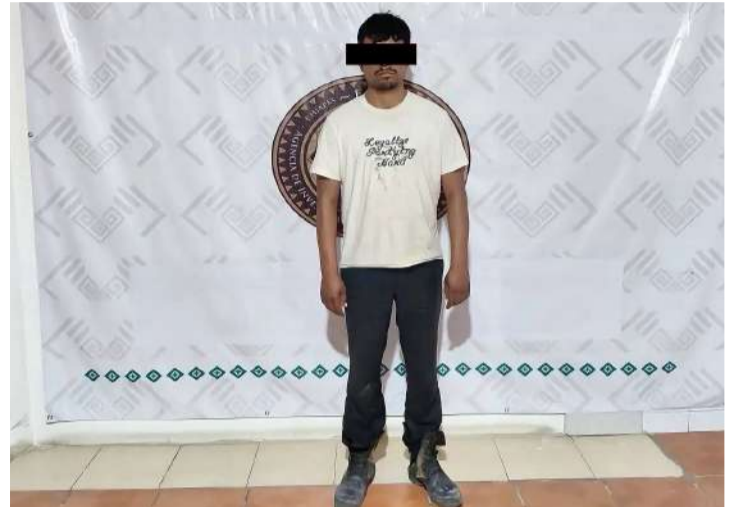
Autoridades estatales continúan las investigaciones para esclarecer el doble homicidio

Tras presentar los datos de prueba ante el órgano jurisdiccional, la autoridad judicial determinó vincular a proceso a Omar “N”, alias “El Flaco”, por su probable responsabilidad en este do-