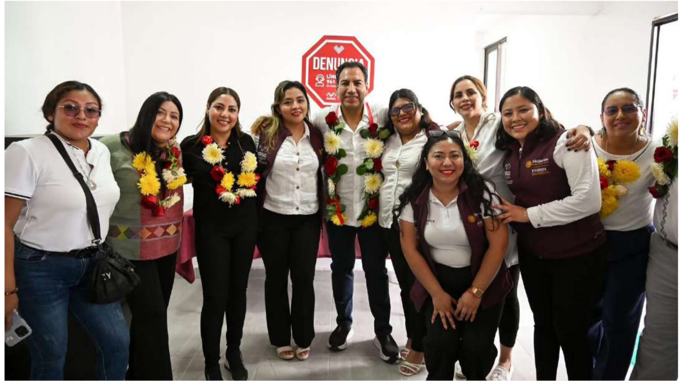
El mandatario sostuvo que recorre las comunidades para atender las necesidades de la población