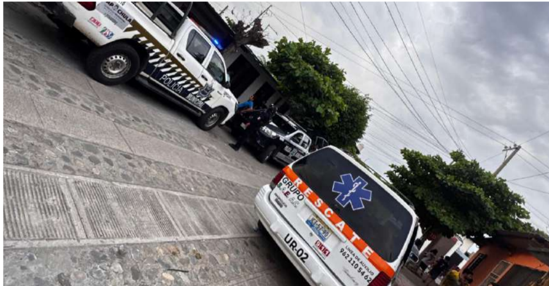
Personal pericial efectuó el levantamiento para continuar las indagatorias

■ Socorristas acudieron tras un reporte ciudadano y confirmaron que un masculino de aproximadamente 60 años ya no contaba con signos vitales