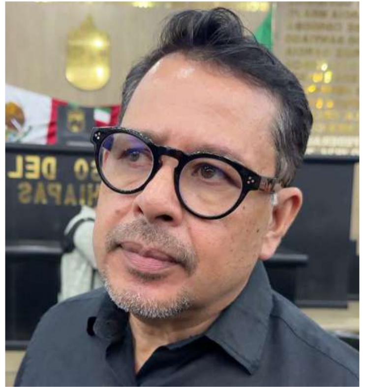
El legislador reconoció que no puede garantizar ausencia de casos aislados en municipios

Al ser cuestionado sobre señalamientos a nivel nacional que vinculan a Morena con presuntos nexos con el crimen organizado, el legislador rechazó ese escenario en el gobierno estatal y afirmó que las autoridades han actuado con responsabilidad y transparencia. Sin embargo, reconoció que corresponde a las fiscalías investigar cualquier posible relación entre actores políticos y grupos delictivos, y evitó garantizar la ausencia de casos aislados entre