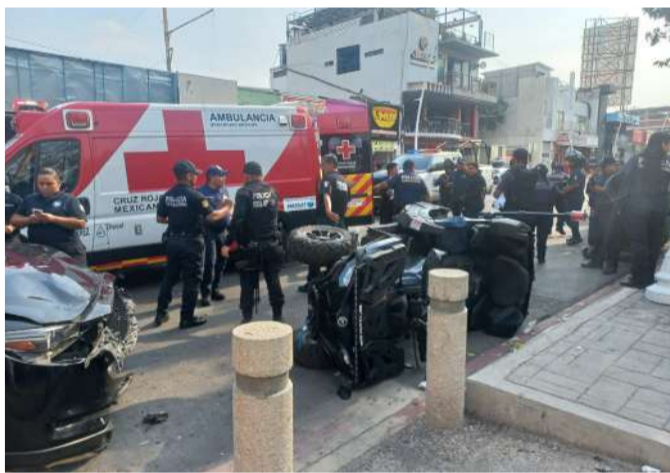
Tres personas resultaron afectadas

Sin embargo, la conductora no habría advertido la circulación de un vehículo particular marca Mazda que avanzaba en sentido contrario, de oriente a poniente. Al cambiar la luz del semáforo, el automóvil continuó su trayecto y terminó impactándose contra la uni-