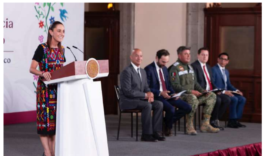
Índice del IEP reveló avance de 5.1% en 2025, el sexto año consecutivo de progreso en seguridad

“Eso es lo que tenemos que decirle todos los días a la gente, que confiemos en nosotros, en las y los mexicanos, que es nuestro pueblo, que miren que ha vivido desgracias, dificultades, pero siempre se levanta, eso se llama dignidad y eso es lo que hoy tenemos que poner por encima de todo frente a las visiones injerencistas. Tan podemos que estamos construyendo más trenes, más hospitales, tan podemos que está reconocido internacionalmente que estamos construyendo la paz