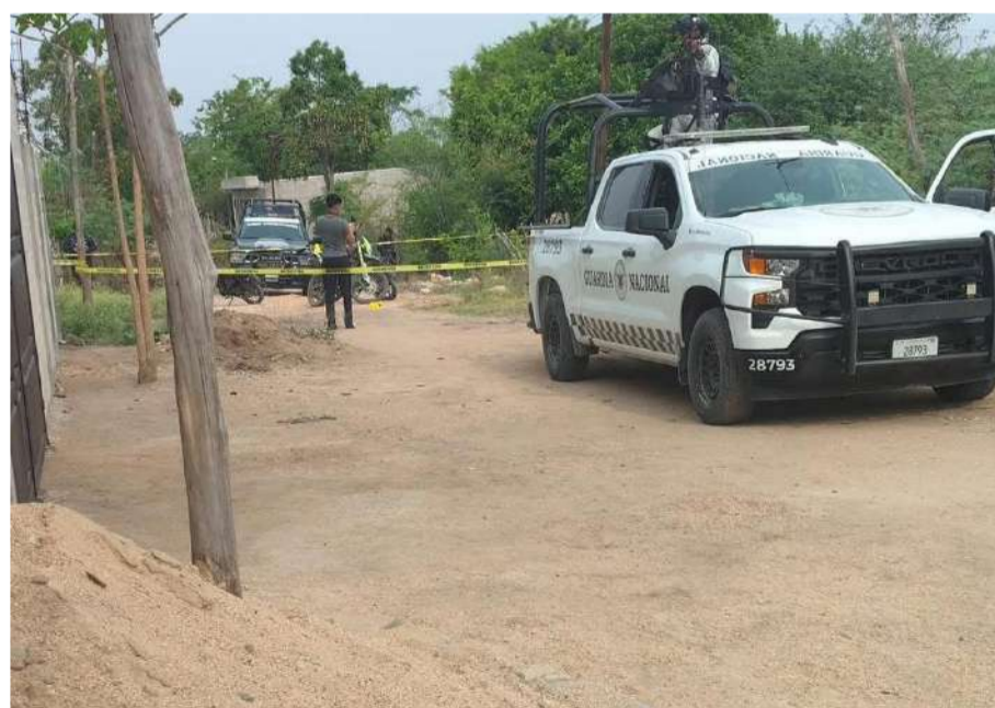
Ante el temor, familias evitaron salir de casa

Hasta el momento, las autoridades de seguridad no han emitido un