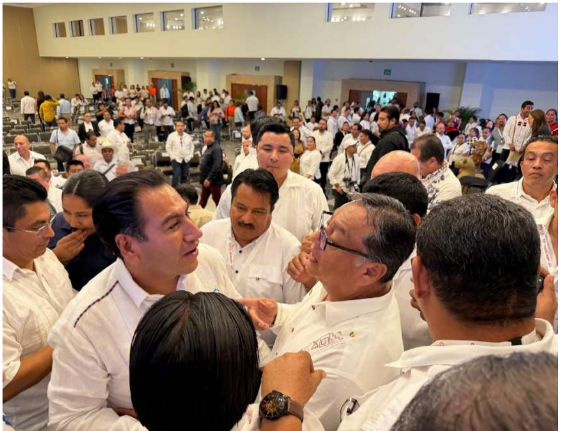
Se busca fortalecer la administración pública y el manejo responsable de recursos

Asimismo, señaló que este tipo de encuentros fortalecen la coordina-