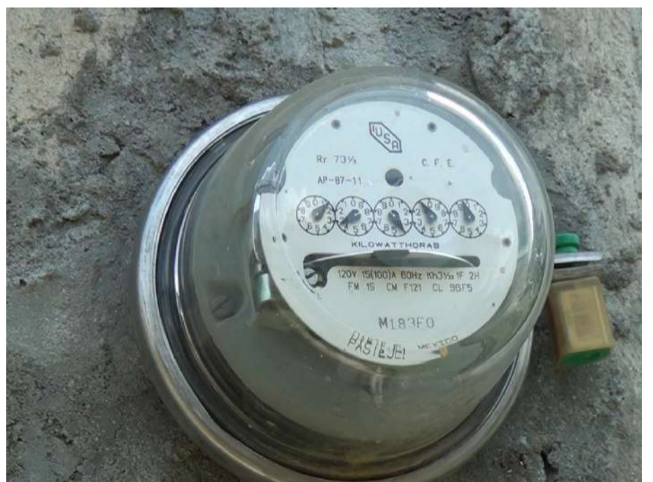
Familias tapachultecas señalaron pérdidas en alimentos, medicamentos y electrodomésticos

Resaltó que no ha habido ningún pronunciamiento de ellos en tribuna o en ruedas de prensa, respecto al pésimo servicio de la