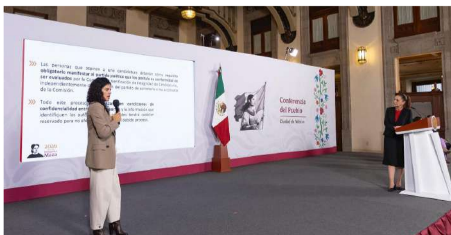
El INE contará con una comisión especial para revisar perfiles de aspirantes

La propuesta contempla la creación de la Comisión de Verificación de Integridad de Candidaturas, un órgano dependiente del Instituto