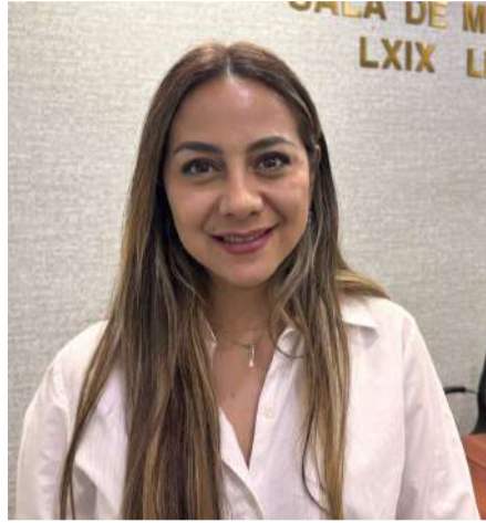
Las acciones responden a la política de cero corrupción del gobernador Eduardo Ramírez Aguilar

En el municipio de Jiquipilas, la Fiscalía solicitó el desafuero de