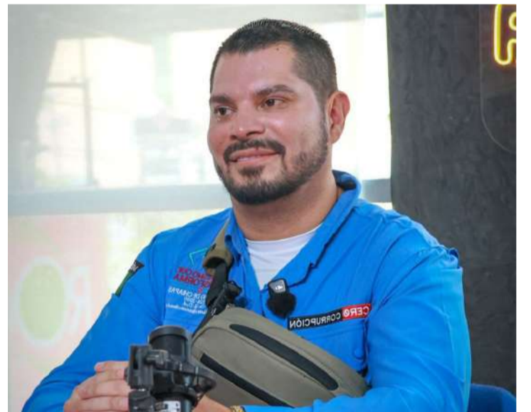
El encuentro se realizará el 26 de mayo en el Planetario de Tuxtla Gutiérrez

Con estas acciones, la Secretaría de Seguridad del