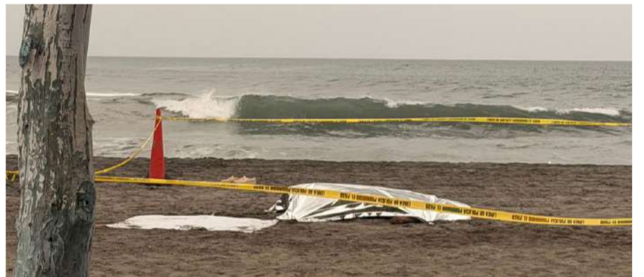
El cuerpo quedó tendido cerca de las palapas

Peritos de la Fiscalía y autoridades ministeriales efectuaron el levantamiento del cuerpo para trasladarlo al Servicio Médico Forense,