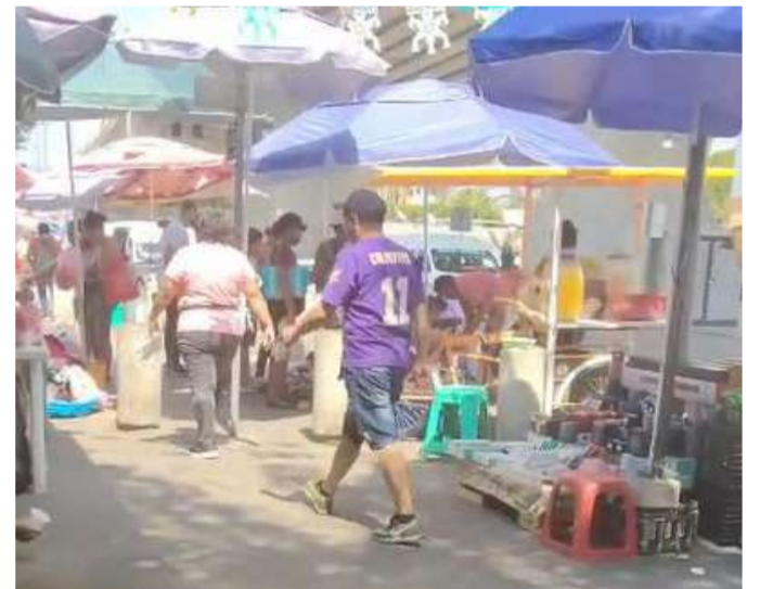
Locatarios pidieron liberar los accesos y reforzar la vigilancia

Dicen que esta obstrucción impide el libre paso de las personas que esperan el semáforo para cruzar esta vialidad, por lo que los comerciantes le dijeron a esta vendedora que quitara sus productos de ese lugar y se fuera a otro