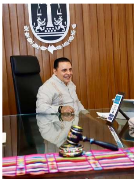
Impulsan formación jurídica juvenil en Chiapas

Asimismo, se abordó la relevancia de mantener una relación estrecha con la comunidad estudiantil de Derecho, promoviendo espacios de formación académica y diálogo para las nuevas generaciones de profesionistas.