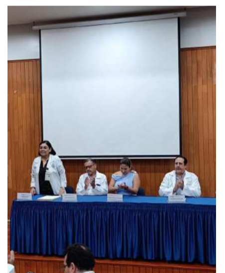
Especialistas abordaron suicidio y autolesiones en encuentro académico