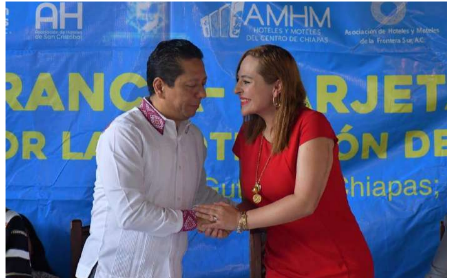
Impulsan estrategia de cero tolerancia contra la explotación sexual infantil

Asimismo, agradeció públicamente la intervención de la presidenta municipal en un conflicto registrado en la zona de Los Llanos, donde colaboró