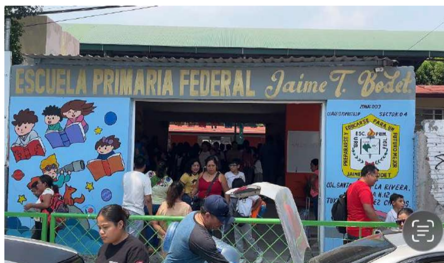
Sin ventiladores ni agua fría, alumnos soportan altas temperaturas en las aulas

denunciaron que la escuela también ha sido víctima de robos en diversas ocasiones, lo que incrementa la preocupación por la seguridad de los estudiantes y las condiciones generales del plantel.