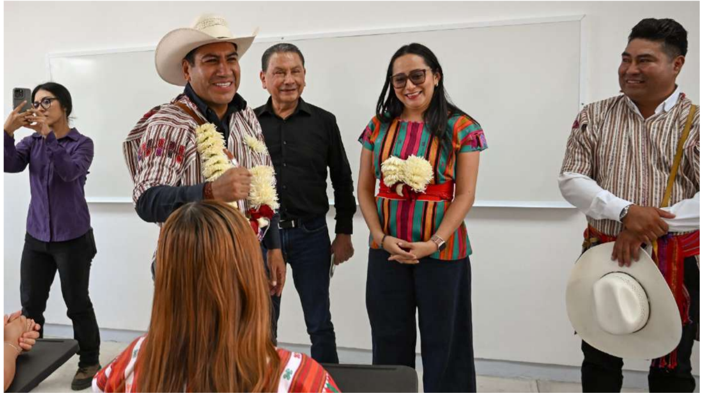
El gobernador encabezó la entrega de apoyos sociales y productivos

“Somos un gobierno que está trabajando donde nadie volteó a ver nunca, y esa es la diferencia de un