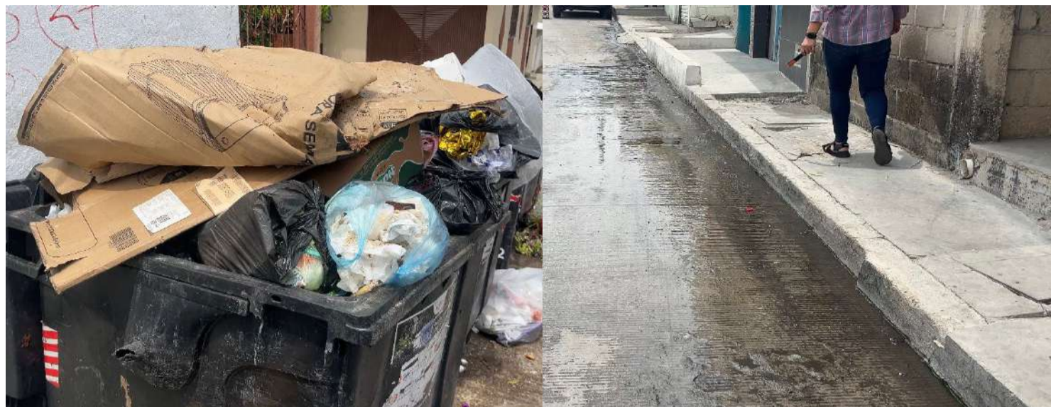
Basura regada y fugas permanentes agravan las condiciones

■ Los habitantes acusaron que desde hace más de dos semanas los contenedores de basura permanecen saturados y sin limpieza, mientras fugas de agua potable y residual continúan afectando calles