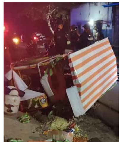
El conductor responsable huyó del lugar

La mercancía que la familia comercializaba para obtener ingresos quedó regada sobre