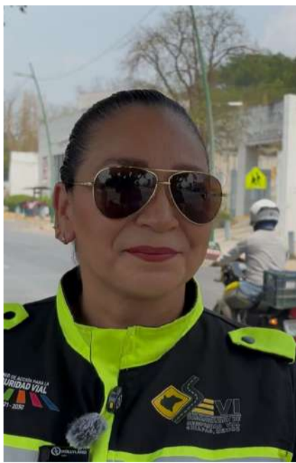
Llaman a conducir con empatía y responsabilidad