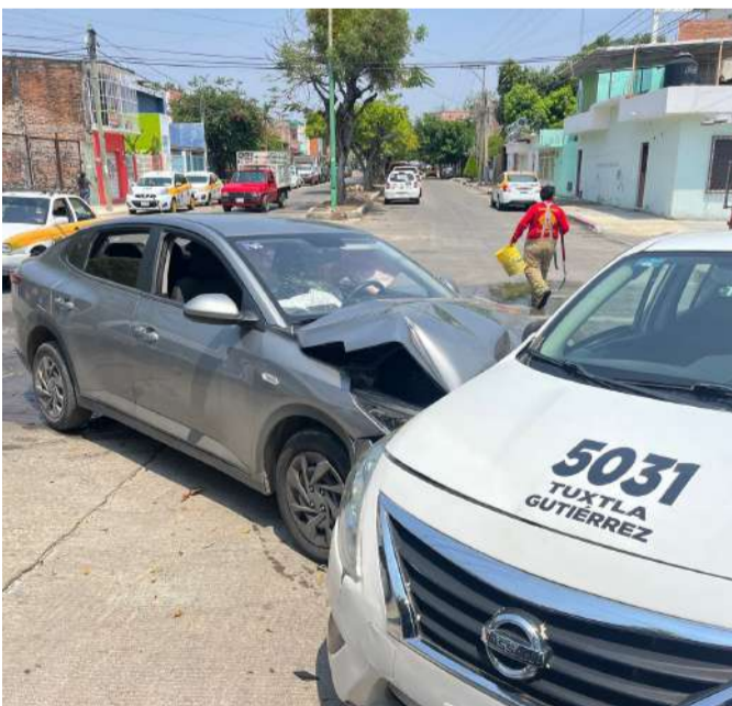
No respetó la preferencia y chocó contra un taxi

Derivado del fuerte impacto, el conductor del KIA resultó lesionado, presentando traumatismo craneoencefálico, por lo que fue necesaria la intervención de paramédicos, quienes brindaron atención y valoración médica en el lugar.