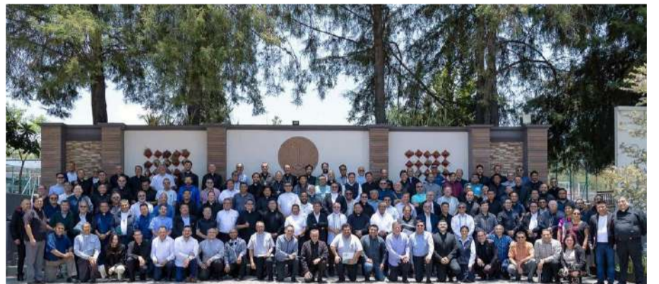
Participan representantes de la Diócesis de San Cristóbal de Las Casas en encuentro nacional

Los participantes coincidieron en que el Proyecto Global de Pastoral busca impulsar una transformación profunda en las relaciones humanas, eclesiales y comunitarias, priorizando el acompañamiento y la cercanía con las personas antes que el incremento de actividades o vocaciones.