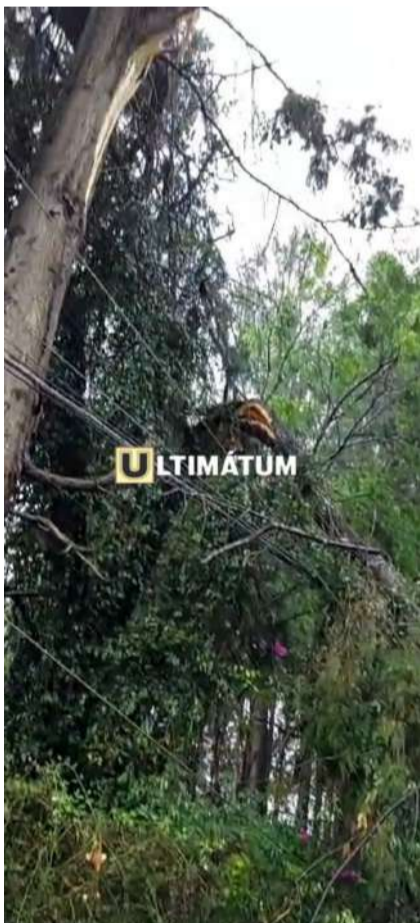
Elementos de auxilio realizaron labores para despejar la vía

Las autoridades también verificaron que no existieran mayores riesgos para la población, mientras exhortaron a los conductores