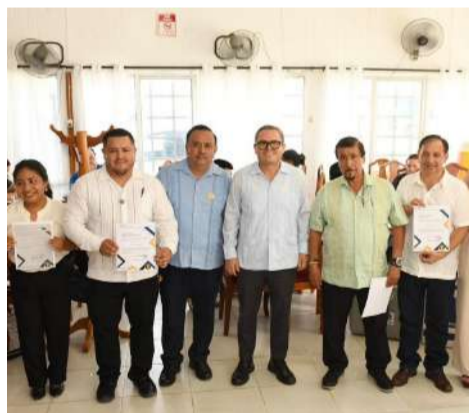
Docentes recibieron reconocimiento por su aporte al fortalecimiento educativo

Como parte del evento, el rector hizo entrega de documentos que acreditan horas temporales para docentes que cumplieron con los requisitos establecidos, fortaleciendo así las condiciones laborales dentro de la institución educativa.