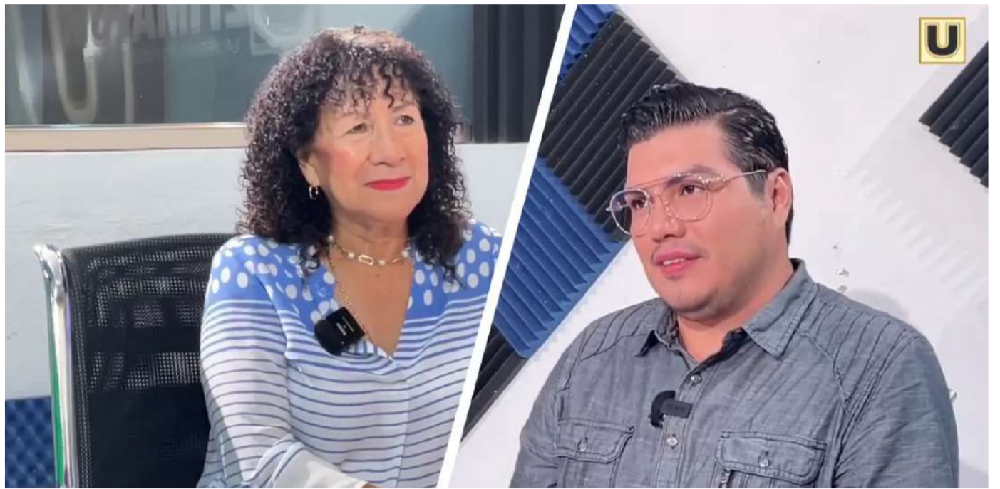
La investigadora compartió su mensaje a las mujeres jóvenes que sueñan con la ciencia y temen no poder compaginar vida profesional y familiar.

Su historia comienza en la UNAM, donde cursó licenciatura, maestría y doctorado, y donde permaneció como profesora investigadora en la Facultad de Ciencias durante aproximadamente doce años. Desde entonces, su pasión por las ciencias de la tierra estuvo orientada por una pregunta concreta: ¿qué pasaría si regresaba a Chiapas a construir lo que no existía? La respuesta tardó años en materializarse, pero el punto de partida fue la erupción del volcán Chichón en 1982, un desastre que dejó más de dos mil víctimas sepultadas en comunidades indígenas que no hablaban español y que evidenció la ausencia total de monitoreo científico en una entidad con dos volcanes activos y una actividad sísmica permanente.