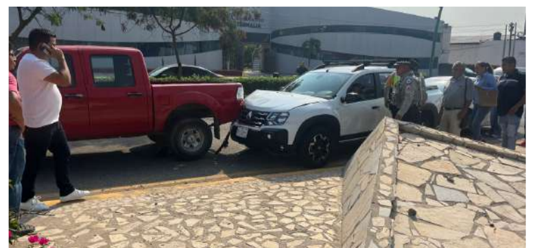
Presunto exceso de velocidad provocó el choque

Cabe señalar que no se registraron personas lesionadas de gravedad; únicamente se reportaron golpes leves y crisis nerviosas derivadas del fuerte impacto, además de daños materiales en los vehículos involucrados.