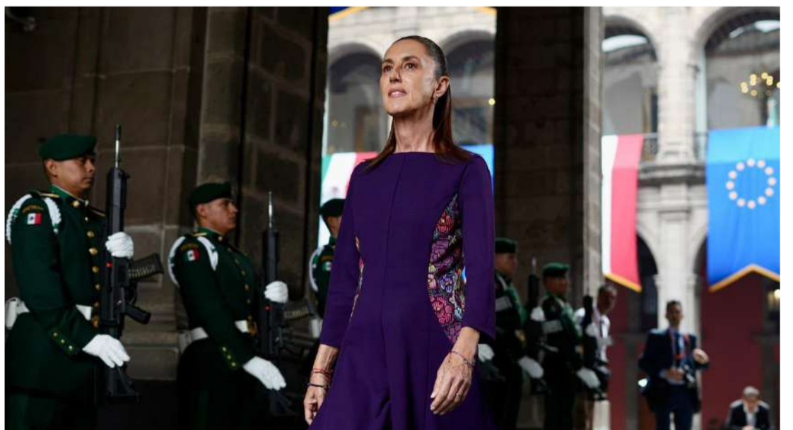
México y la Unión Europea fortalecen relación bilateral con acuerdo

Posteriormente, Sheinbaum, Costa y Von der Leyen realizaron la fotografía oficial acompañados por in-