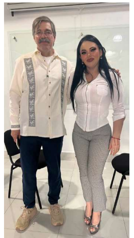
Autoridades estatales participaron en actividades de actualización administrativa

y Buen Gobierno reiteró su compromiso de continuar impulsando la profesionalización del servicio público, promoviendo principios de humanismo, empatía y mejora continua en la administración estatal.