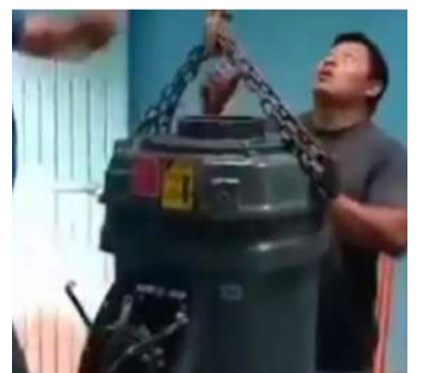
Miles de familias enfrentan desabasto mientras exigen reparación urgente

Los habitantes señalaron que ninguna administración municipal ha logrado solucionar de manera definitiva esta problemática que afecta también a comunidades cercanas. Incluso recorda-