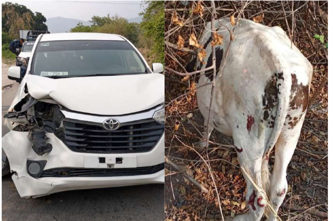
Una camioneta terminó con severos daños tras el impacto

Tras la colisión, el automóvil presentó daños en la parte delantera del lado derecho, mientras que el semoviente resultó con heridas en las patas traseras. Afortunadamente, no se reportaron personas lesionadas entre los tripulantes