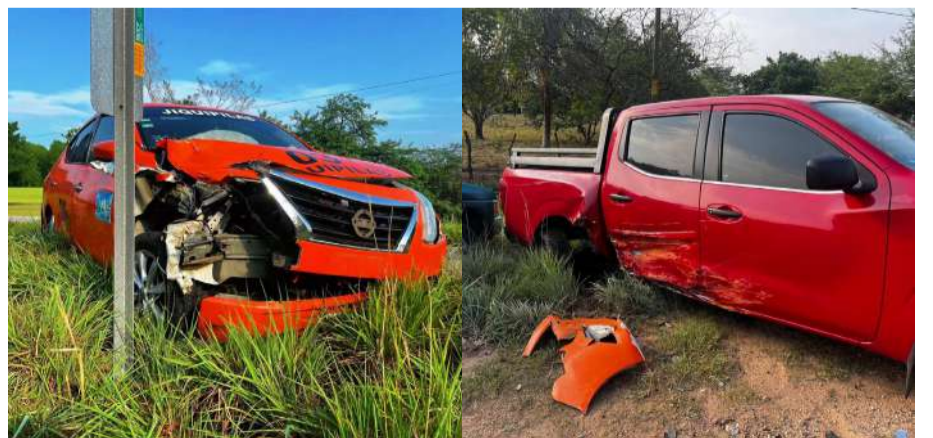
Los heridos fueron trasladados al hospital

Tras el percance, automovilistas que transitaban por la zona solicitaron apoyo a los números de emergencia, arribando minutos después elementos de Protección Civil, quienes atendieron a un hombre y una mujer que viajaban en el taxi. Ambos presentaban golpes y fueron canalizados a un hospital para una revisión médica más com-