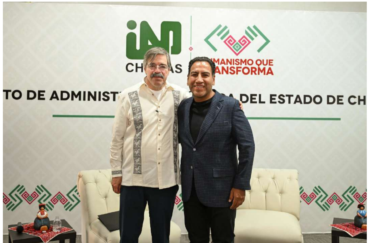
Capacitan a servidores públicos para fortalecer atención ciudadana

Durante su participación, el mandatario estatal resaltó la importancia de la capacitación constante dentro de la administración pública, al considerar que un gobierno preparado permite atender con mayor eficacia las necesidades de la ciudadanía y consolidar políticas públicas más cercanas a la gente.