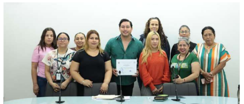
Impulsan espacios de reflexión y sensibilización institucional

Durante las jornadas se promovió el diálogo entre las y los asistentes, quienes compartieron experiencias y puntos de vista so-