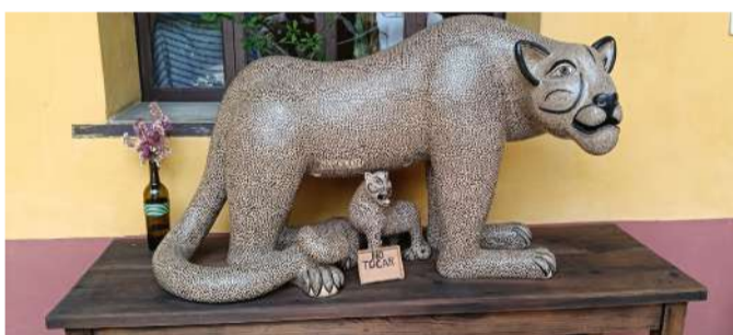
El emblemático museo abrirá actividades especiales por su aniversario

embargo, el proyecto no fue concluido y posteriormente se convirtió en la sede del museo. Actualmente, el lugar conserva más de 70 mil archivos históricos y fotográficos, de los cuales más de 50 mil pertenecen a Gertrudis Duby, destacada fotógrafa e investigadora.