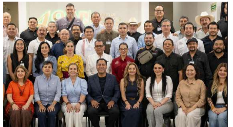
El funcionario reafirmó su compromiso con la seguridad y el bienestar de Chiapas

El funcionario reiteró que la preparación y actualización del personal forman parte de las acciones impulsadas para fortalecer las instituciones y brindar