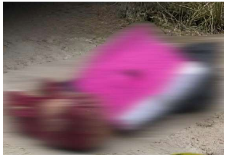
Los cuerpos fueron abandonados frente a una cancha deportiva

Peritos de la Fiscalía General del Estado realizaron el levantamiento de los cuerpos, los cuales fue-