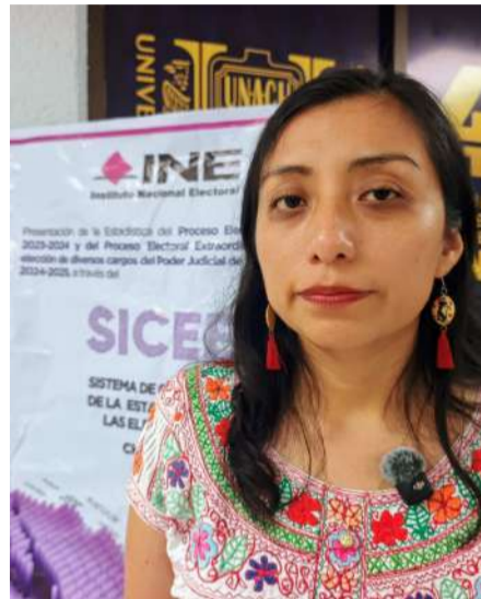
El sistema podrá consultarse desde cualquier dispositivo con internet