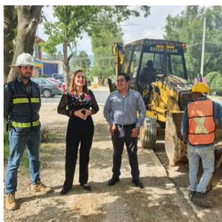
La obra abarcará cerca de dos kilómetros