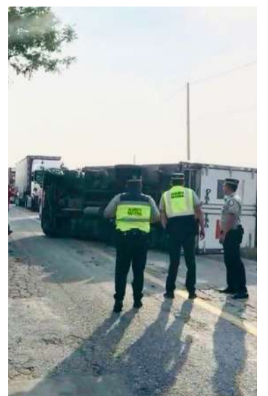
No hubo lesionados

Tras el reporte de emergencia, cuerpos policiacos municipales y estatales acudieron al sitio para abanderar la zona y evitar otro accidente, mientras decenas de vehículos permanecían avanzando lentamente en ambos sentidos de la ruta.