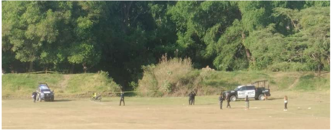
La zona fue resguardada por fuerzas estatales

tima permanece en calidad de desconocida y no se han dado a conocer mayores detalles sobre su identidad ni sobre las circunstancias en que ocurrieron los hechos.