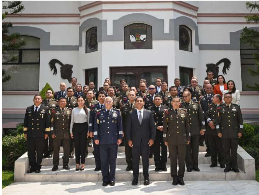
El Codenal reunió a representantes castrenses de Brasil, Argentina y Guatemala para escuchar el modelo chiapaneco de prosperidad y seguridad

En este recinto histórico, donde presidentes de México han di-