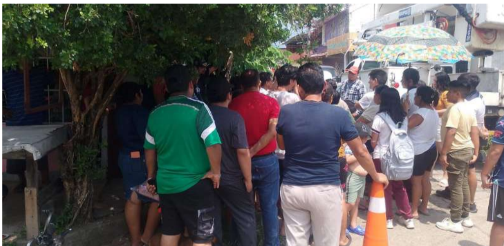
Vecinos de Nuevo Mundo 2 bloquearon temporalmente una unidad