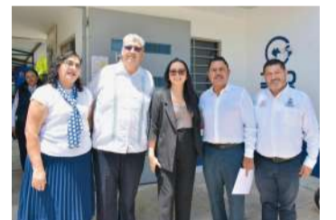
Arte, liderazgo y talleres marcaron la jornada cultural de tres días en el plantel 10 del Colegio de Bachilleres de Chiapas

Posteriormente, en el marco de esta gira de trabajo y como parte del compromiso con una infraestructura educativa de calidad, la directora general supervisó los avances de la construcción de la cancha de fútbol 7 con pasto sintético en el plantel, la cual registra un avance del 80 por ciento y que fortalecerá espacios dignos para la sana convivencia y el desarrollo integral de las y los estudiantes.