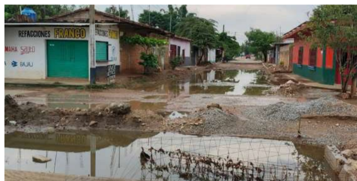
Acusan omisión de las autoridades locales

blicas pero lamentablemente lo dejaron abandonado, no se puede pasar caminando porque hay mucho lodo, es necesario que nuestras autoridades escuchen las denuncias del pueblo, ya sufrimos mucho por estar caminando en medio del lodo, exigimos que concluyen la obra, porque ya son varios meses que iniciaron el trabajo, pero no terminan, lo más lamentable es que no hay personas traba-