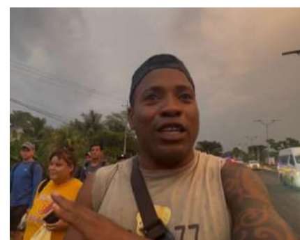
Buscan permanecer de manera regular en México

Incluso, denunciaron que cuando fueron deportados desde Estados Unidos, les dijeron que les darían documentos, pero eso no ocurrió, por ello, su salida de la ciudad