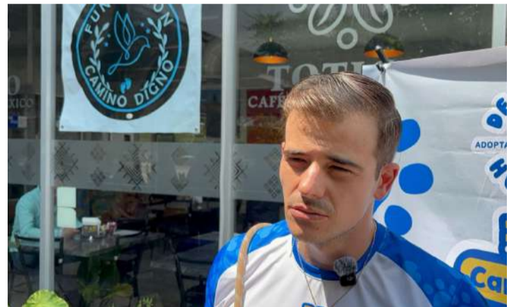
Proyecto Dejando Huella convocó a su segunda edición atlética para recaudar fondos destinados al cuidado de perros rescatados en Tuxtla Gutiérrez

En cuanto a la legislación vigente, comentó que autoridades y organizaciones civiles atraviesan un proceso de