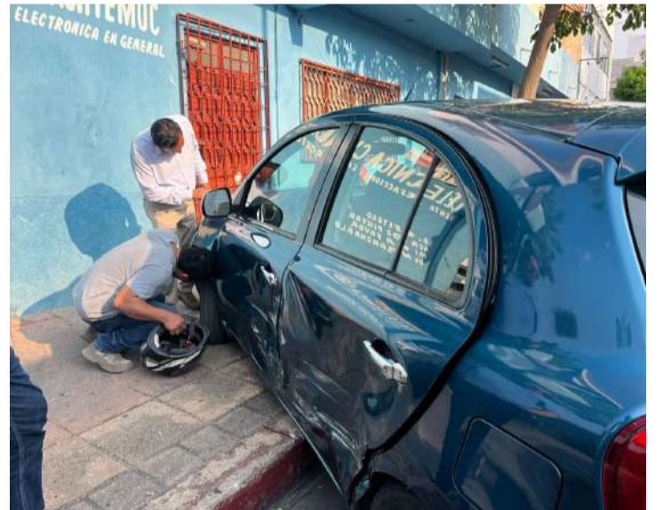
El percance dejó daños en una vivienda

Al lugar arribaron elementos de Tránsito Municipal, quienes realizaron las diligencias correspondientes para esclarecer responsabilidades.