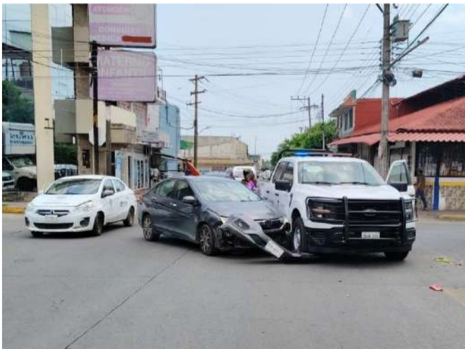
La unidad no respetó la preferencia

En el automóvil particular viajaba una menor de edad y una mujer, quienes resultaron ilesas tras el percance. Autoridades