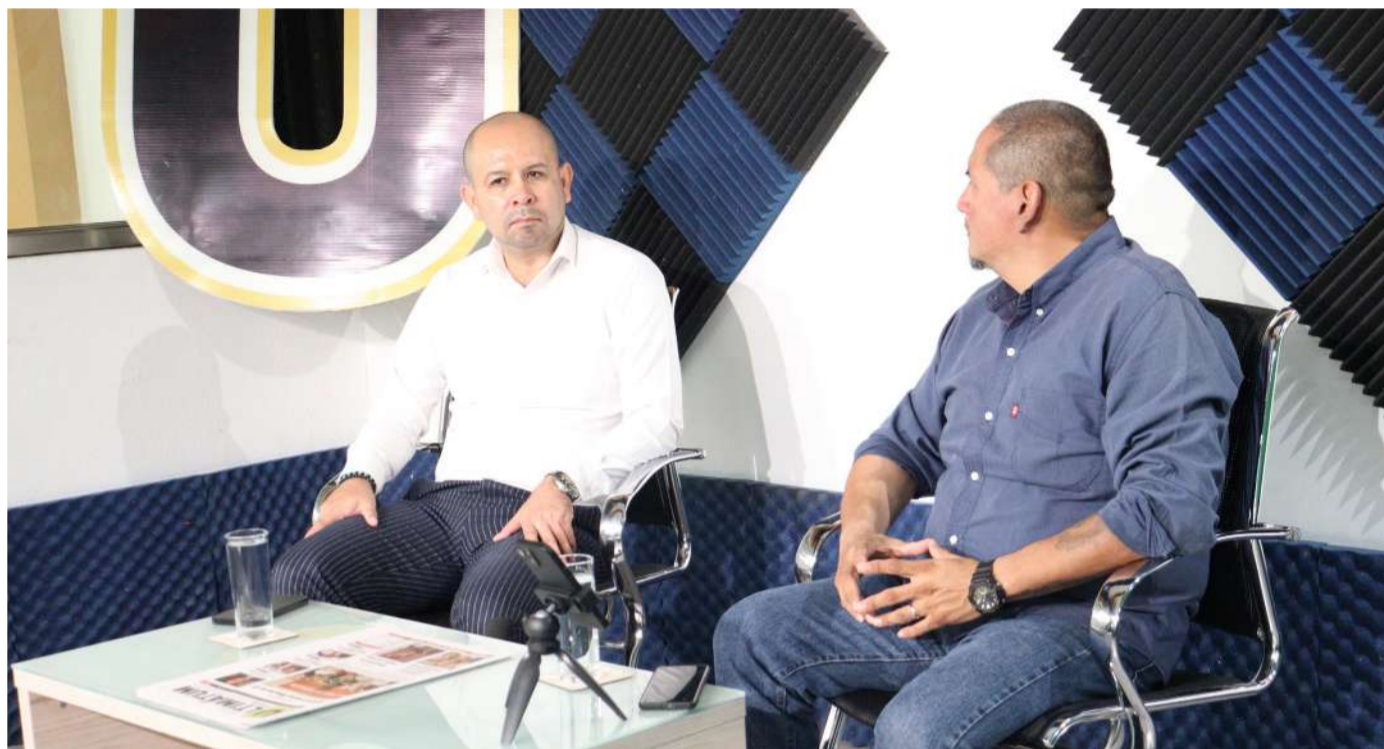
Se ha perdido la costumbre de salir a parques, practicar deportes o tener contacto con la naturaleza

E l psicólogo Galileo Becerril advirtió que el uso desmedido de teléfonos celulares y plataformas de inteligencia artificial está afectando de manera importante la salud mental de niñas, niños y jóvenes, al grado de convertir al teléfono móvil en un “sustituto del padre” dentro de muchos hogares.