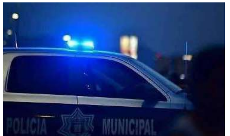
Sujetos armados con cuchillo agredieron a un habitante

Paramédicos le brindaron atención en el lugar y