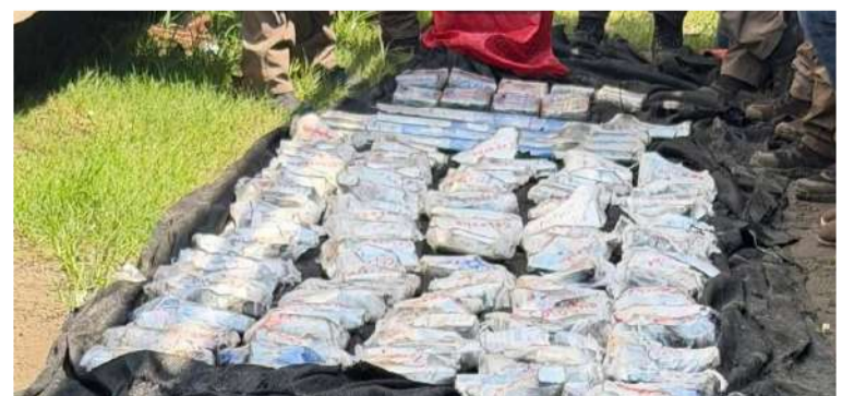
Las corporaciones mantienen las inspecciones dentro del predio

Las fuerzas federales señalaron que el operativo se realizó con apego al Estado de Derecho y respeto a los derechos humanos, reiterando su compromiso de mantener acciones coordinadas para inhibir a grupos delictivos y reforzar la seguridad en Chiapas.