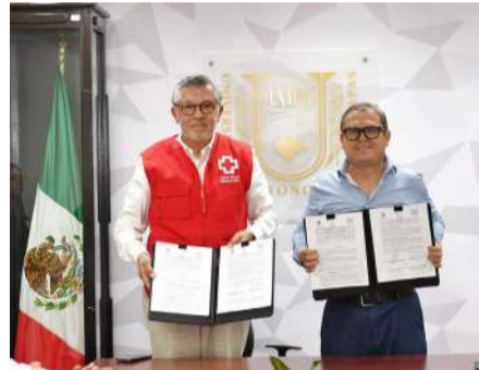
Suscribieron el acuerdo que abre nuevos espacios clínicos para el servicio social de estudiantes de medicina en Chiapas.

Asimismo, junto a la directora de la Facultad de Medicina Humana Campus II Tuxtla Gutiérrez “Dr. Ma-