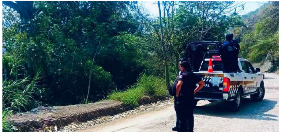
El cuerpo de la víctima fue localizado entre la maleza

determinar las circunstancias exactas en las que ocurrió el accidente.