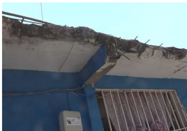
Paredes cuarteadas, techos dañados y estructuras separadas

Hizo mención que el programa “La escuela en nuestra” viene a disminuir el rezago físico de las instituciones, pero no es suficiente, porque son décadas de abandono de las autoridades a esta legendaria institución, y tomando en cuenta que el actual gobierno estatal ha priorizado el