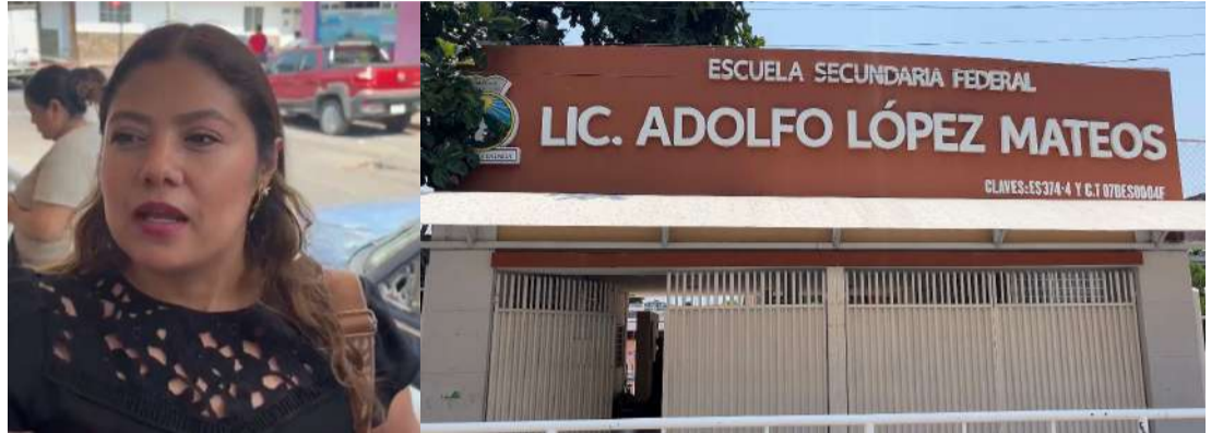
La comunidad pidió atender de manera urgente la falta de docentes

Los tutores señalaron además que desde hace más de nueve años un docente presuntamente no se pre-