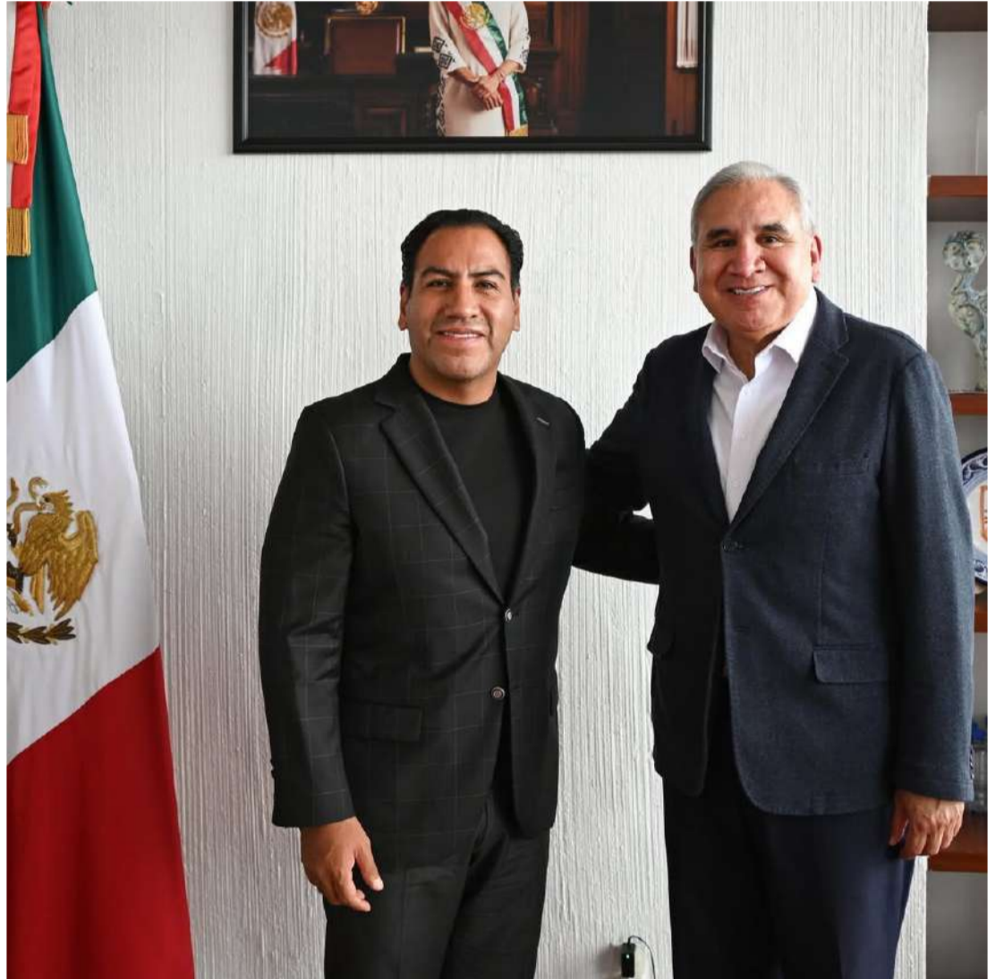
Se reunió en la Ciudad de México con el director de la Beneficencia Pública federal para gestionar miles de apoyos funcionales