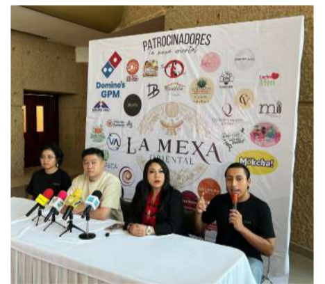
Estudiantes de Gastronomía realizarán la Feria Gastronómica "La Mexa Oriental"

Durante la jornada habrá juegos, concursos, rifas, actividades recreativas, además de venta de alimentos y bebidas inspiradas en ambas culturas.