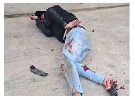
El tripulante del velocípedo acabó tendido en el asfalto

El joven fue trasladado de emergencia a un hospital para recibir atención médica especializada, donde su estado de salud fue reportado como delicado.