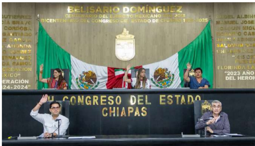
Diputados impulsan acciones para ampliar el acceso cultural en sitios históricos

Finalmente, los padres de familia exigieron una solución inmediata y transparente, así como la asignación de docentes permanentes que permitan garantizar clases continuas y mejores condiciones para los estudiantes de la secundaria.