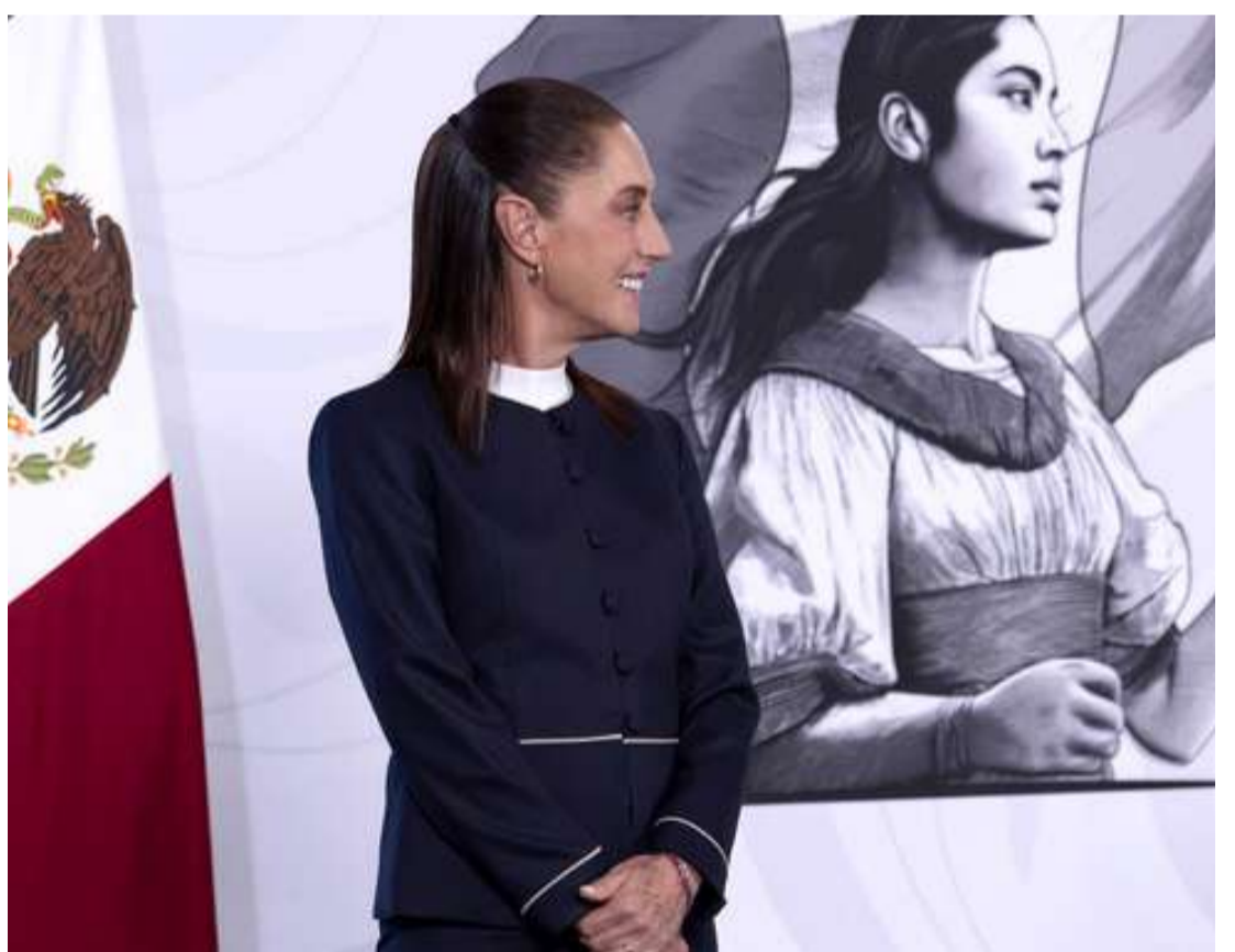
El país registró 23 mil 591 millones de dólares en Inversión Extranjera Directa en el primer trimestre y un superávit comercial de más de 3 mil millones de dólares

“La segunda buena noticia es que México exportó mucho; importó, pero exportamos más de lo que importamos. ¿Por qué es importante eso? Porque para los países es importante tener, se llama ‘una balanza comercial positiva’: producir más para el mercado interno y para exportar, que lo que importamos, que es la base del Plan México. Creció, de enero a abril, 21.8 por ciento las exportaciones en