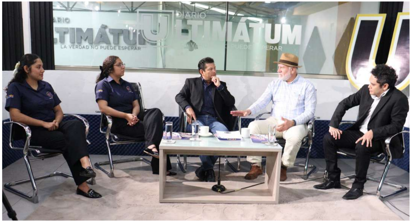
El documento tiene validez internacional

Recordaron que la Universidad de Oxford, ubicada en Inglaterra, ha