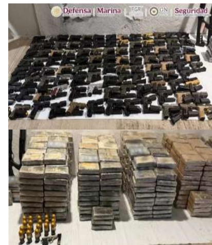
Aseguraron 687 kilogramos de cocaína

En una primera revisión, mandos militares habían reportado únicamente el aseguramiento de un tractocamión, armas cortas, rifles y paquetes