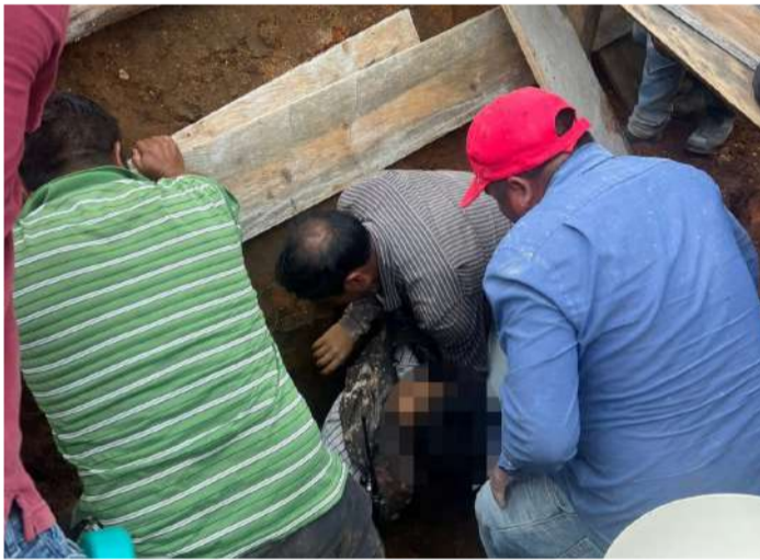
El accidente ocurrió mientras varios trabajadores realizaban labores de construcción

SAN JUAN CHAMULA