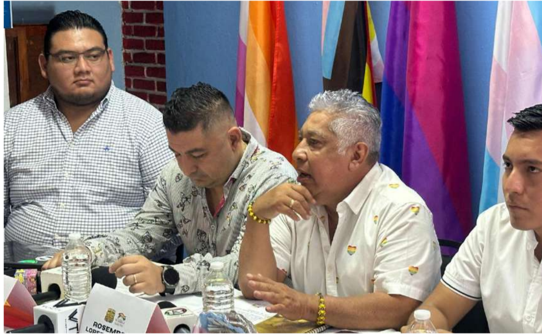
Colectivos convocan a recorrer las calles el próximo 20 de junio

Chiapas, se tienen avances históricos LGBTI que se reflejan en políticas públicas gubernamentales.