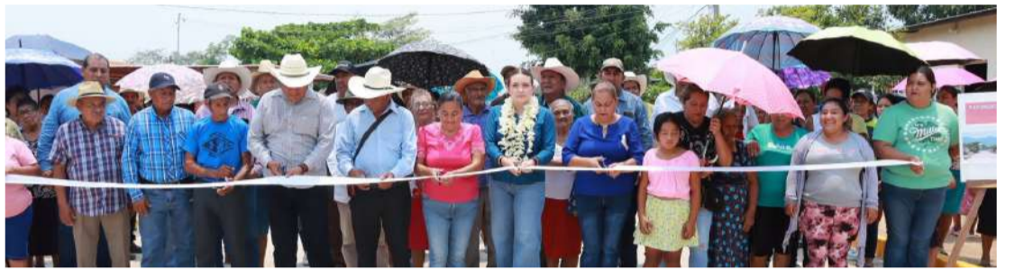
Entregan más de un kilómetro de concreto hidráulico

este tipo de acciones buscan elevar la calidad de vida de la población, al facilitar el tránsito diario y brindar caminos más seguros para peatones y automovilistas.