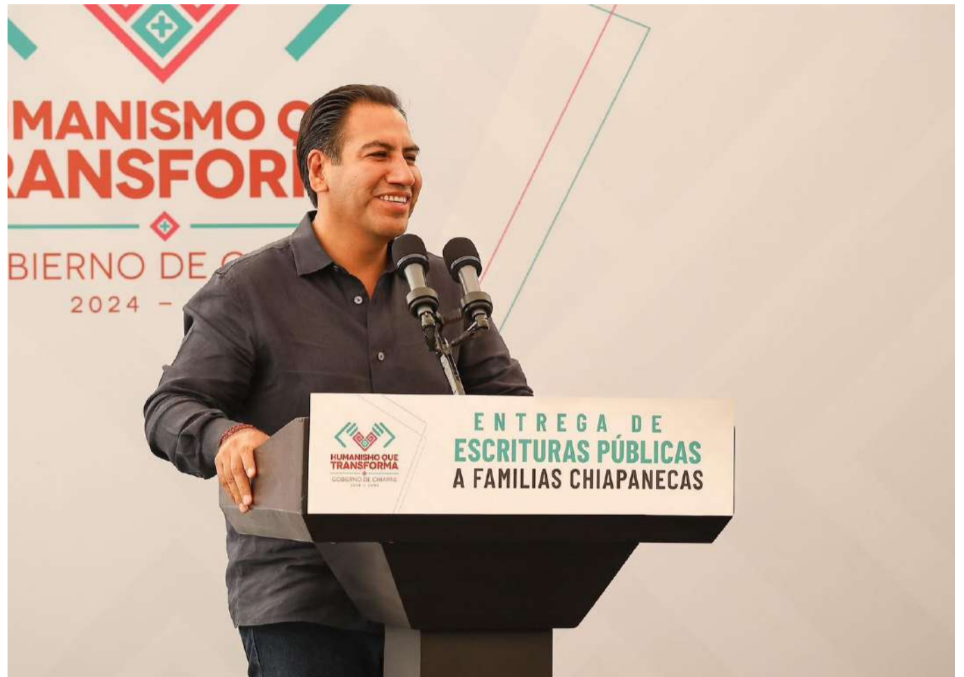
Familias recibieron documentos que acreditan legalmente sus viviendas

reconoció la visión humanista y la sensibilidad política del gobernador Eduardo Ramírez al impulsar acciones que, además de fortalecer la paz y la seguridad, contribuyen a transformar la vida de las y los chiapanecos. También refrendó su compromiso de continuar sumando esfuerzos para cumplir con la misión de servir a Chiapas.