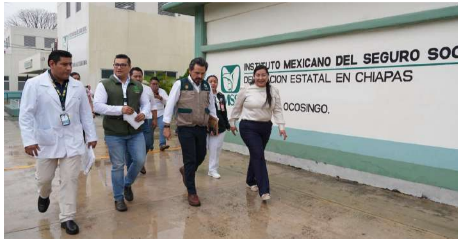
El titular recorrió las instalaciones del Hospital Rural No. 32 de Ocosingo para evaluar las condiciones de operación

■ Zoé Robledo constató la operación del Hospital Rural No. 32 y las necesidades de infraestructura de la unidad que sirve de referencia para 52 clínicas rurales en la región Selva de Chiapas