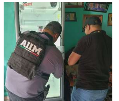
Operativo interinstitucional reforzó la vigilancia

El grupo interinstitucional conformado por personal del ejército mexicano, guardia nacional y estatal, policía municipal, así como de la fiscalía de justicia, en Jitotol, catean a 16 establecimientos por presuntos delitos sanitarios, contra la salud, lenocinio y corrupción de menores, por lo que los operativos continuarán en el municipio, ya que es una de las demandas del pueblo.