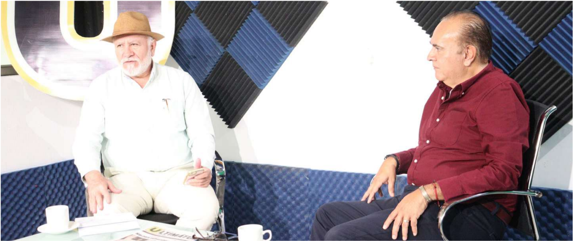
Será un riesgo limitar la participación de hombres en candidaturas