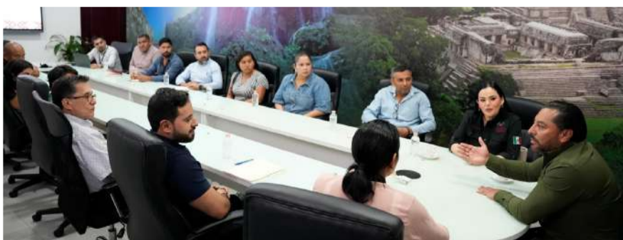
El organismo fiscalizador formalizó el inicio del proceso de auditoría al municipio que días antes protagonizó la detención de su ex alcaldesa

La Auditoría Superior del Estado continúa fortaleciendo las acciones institucionales encaminadas a garantizar la transparencia, la legalidad y el correcto ejercicio de los recursos públicos en beneficio de las y los chiapanecos.