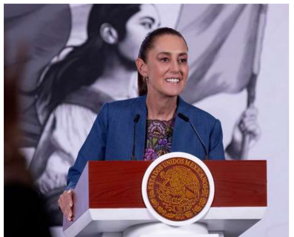
La presidenta confirmó el Monumento a la Revolución como sede central del informe del 31 de mayo

“Seguimos con el compromiso que hicimos con ellos: que no robamos, que no mentimos y que nunca los vamos a traicionar, a ellos y a los que no votaron por nosotros también. Nunca vamos a traicionar al pueblo, nunca”, enfatizó.