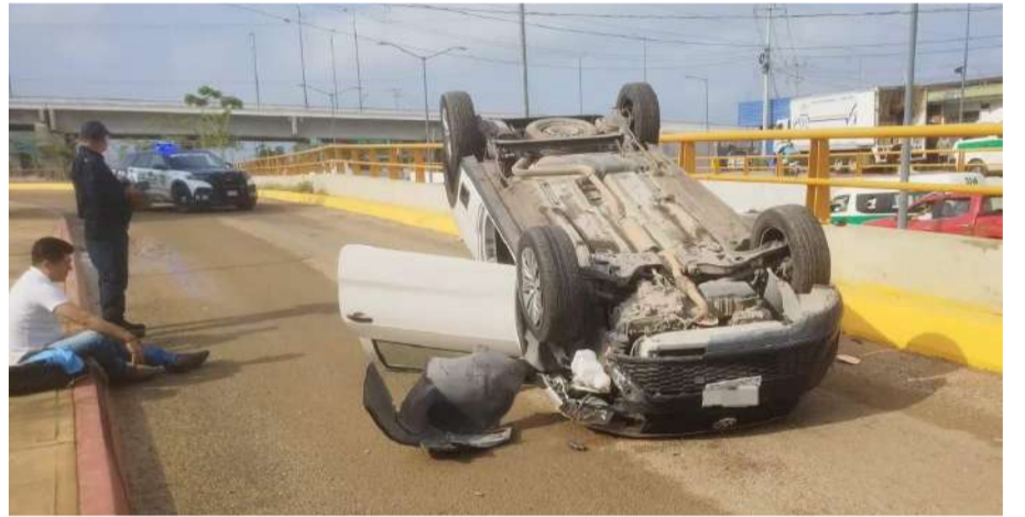
La unidad quedó recostada sobre el pavimento

Autoridades informaron que no se reportaron personas lesionadas,