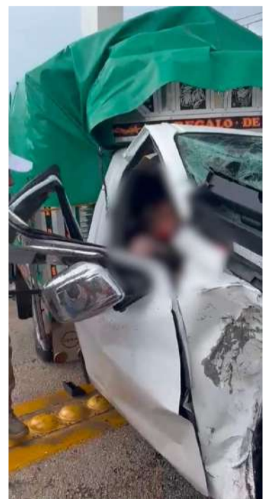
La camioneta terminó destruida tras el encontronazo

y personal de vialidad realizaron las diligencias correspondientes para esclarecer cómo ocurrió el accidente y deslindar responsabilidades. La circulación en el tramo se vio afectada durante varios minutos.