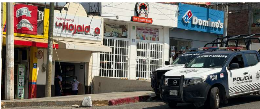
Delincuentes huyeron en motocicleta tras cometer el robo

Al lugar arribaron elementos policiacos, quienes acordonaron la zona y realizaron las diligencias correspondientes con el objetivo de esclarecer los hechos y deslindar responsabilidades.