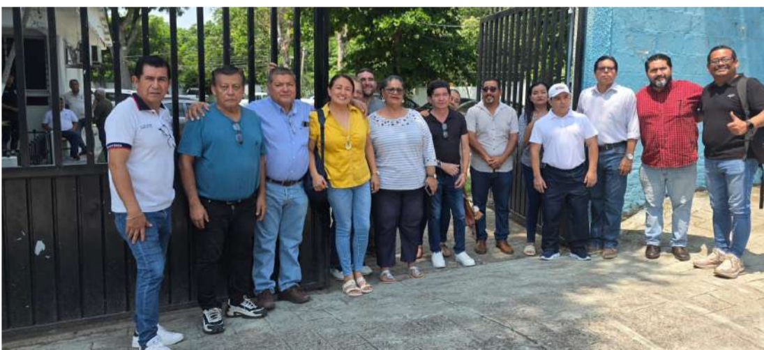
Entre los compromisos destaca una inspección en el centro escolar

reiteraron su disposición de colaborar con las autoridades para mantener la estabilidad académica y garantizar el bienestar de la comunidad estudiantil.