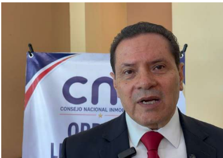
El Consejo Nacional Inmobiliario entregó al Ejecutivo estatal tres esquemas legislativos para regular un sector