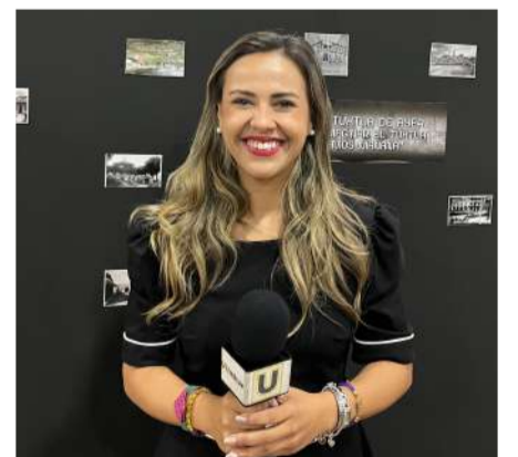
Conversatorio en el marco del 178 aniversario del decreto que le dio nombre a la ciudad

Durante el evento participaron el promotor cultural Roberto Ramos y Mario Vega, fotógrafo fundador del estudio Foto Claudia, quienes compartieron experiencias y relatos sobre la historia, la arquitectura y la transformación de la ciudad a través del lente fotográfico.