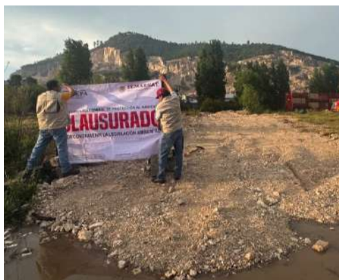
Llaman a revisar la legalidad de predios antes de adquirirlos

Indicó que la maquinaria rellenaba el suelo con material pétreo en una superficie de 473 metros cuadrados, estas acciones son consideradas un delito ambiental al