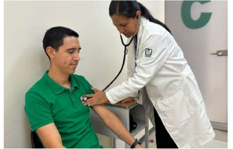
Los hombres mayores de 45 años con antecedentes constituyen la población con mayor vulnerabilidad

tionario analiza señales como dificultad para orinar, aumento en la frecuencia urinaria, sensación de vaciamiento incompleto de la vejiga y otros síntomas que pueden estar asociados con problemas prostáticos. Asimismo, indicó que el riesgo de desarrollar cáncer de próstata aumenta a partir de los 45 años, especialmente en personas con antecedentes familiares o enfermedades crónicas.