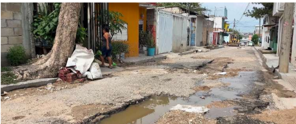
Por ello, hicieron un llamado urgente al edil capitalino y a las dependencias correspondientes para que atiendan de manera inmediata las afectaciones

detección oportuna permite brindar seguimiento especializado, realizar estudios complementarios y mejorar las posibilidades de control y tratamiento de la enfermedad.