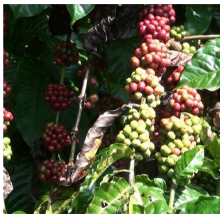
Productores alertan pérdidas y abandono de parcelas

En este sentido, el líder estatal de la Unión Campesina Democrática, dijo que, los periodos de sequía prolongados y las lluvias torrenciales afectan la disponibilidad de agua exacta que la planta necesita en cada