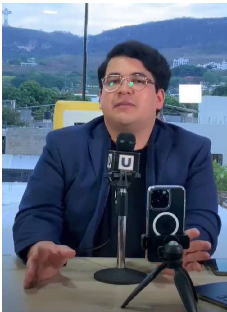
El programa iSalud Mental! explicó cómo el sistema nervioso condicionado puede destruir vínculos sanos y qué hacer para romper ese patrón desde la terapia

berada de dos adultos, no una confirmación de poderes de adivinación. Adjudicarse esa capacidad, dijo, tiene un costo alto: genera sufrimiento en tres momentos simultáneos, antes de que algo pase, mientras se espera que pase y después, cuando se cuestiona por qué no se actuó a tiempo.