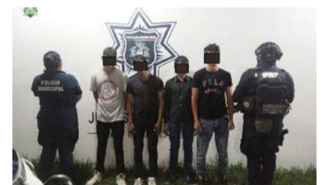
Conducían bajo los efectos del alcohol

Las autoridades señalaron que los involucrados fueron detectados mientras aparentemente realizaban arranques a bordo de motocicletas, una práctica que representa un riesgo tanto para quienes participan como para automovilistas y