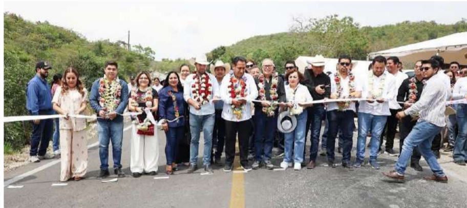
Con inversiones que superan los 41 millones de pesos en obras carreteras, el gobierno estatal busca mejorar la conectividad de más de 64 mil habitantes de los municipios de Tzimol

Más tarde, el gobernador inauguró la conservación del camino