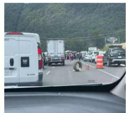
Docentes realizan bloqueo parcial y difunden sus exigencias

Maestros de la Coordinadora Nacional de Trabajadores de la Educación (CNTE) mantienen este viernes un bloqueo intermitente a la altura del kilómetro 46 de la carretera que conecta San Cristóbal de Las Casas con Chiapa de Corzo, generando afectaciones parciales a la circulación vehicular. Durante la movilización, los docentes solicitan cooperación voluntaria a los automovilistas y entregan volantes informativos para dar a conocer sus demandas.