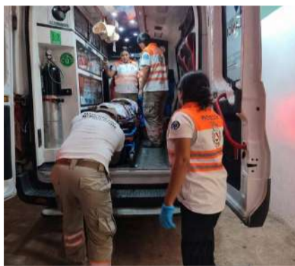
La paciente permanece bajo vigilancia médica mientras recibe tratamiento

Tras recibir el llamado de auxilio, paramédicos de Protección Civil acudieron al sitio para brindarle atención prehospitalaria. En el lugar