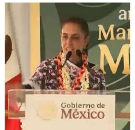
La presidenta anunció una iniciativa para blindar en la Constitución los fondos del FAISPIAM, días antes de su informe de rendición de cuentas del 31 de mayo

El director general del Instituto Nacional de Pueblos Indígenas (INPI), Adelfo Regino Montes, informó que en el Estado de México se van a beneficiar 601 comunidades de