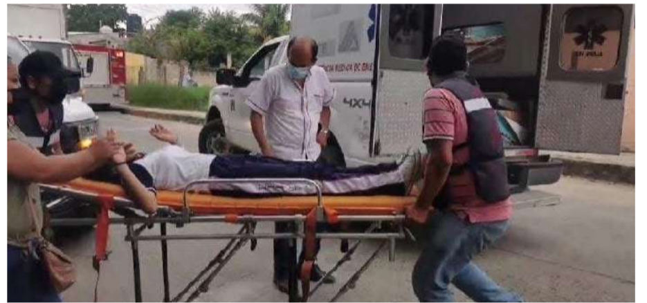
Menores fueron hospitalizados tras presentar malestares digestivos

Personal médico y epidemiológico desplegado en la zona implementó medidas de atención que incluyeron hidratación oral e intra-