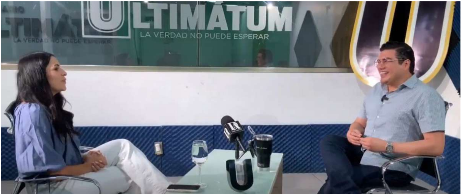
La emprendedora chiapaneca compartió su filosofía de viaje, su historia familiar y su mensaje a los jóvenes que temen emprender