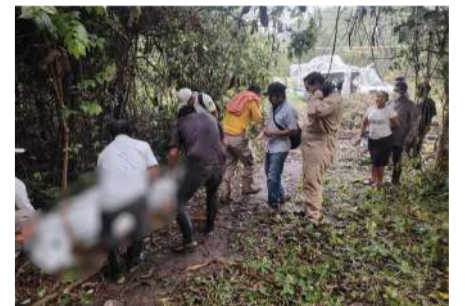
Falleció durante una expedición en una de las áreas más aisladas de la Selva Lacandona

Las labores de búsqueda, recuperación y extracción iniciaron el martes y concluyeron este jueves con el traslado aéreo del cuerpo hacia el panteón municipal de Ocosingo, donde quedó bajo resguardo de la Fiscalía Zona Selva para el cumplimiento de los