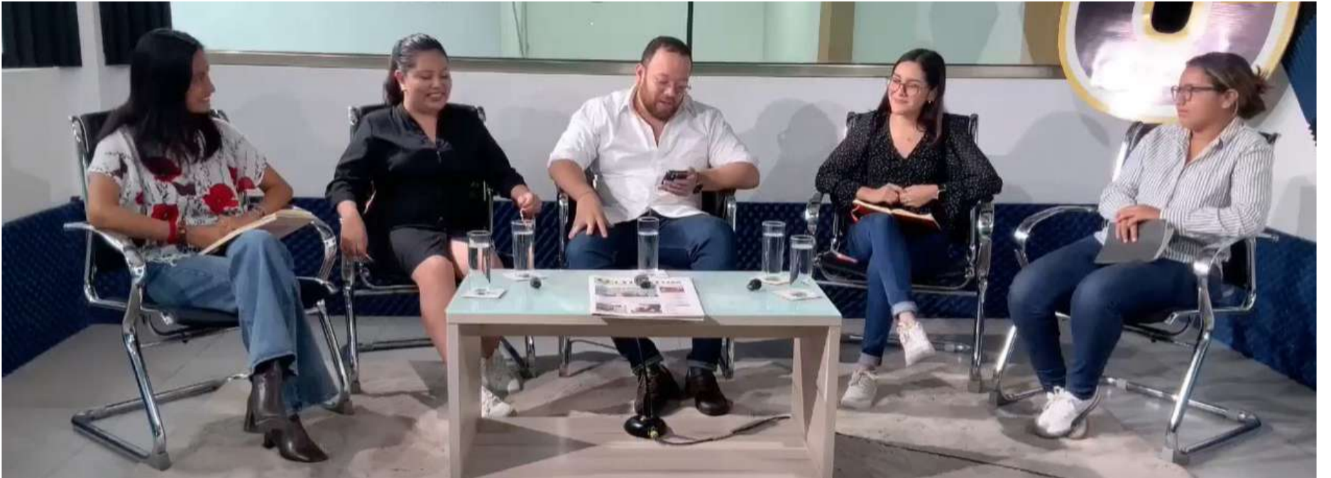
El debate derivó hacia la reflexión sobre por qué Tuxtla no fue diseñada como ciudad con planificación ambiental