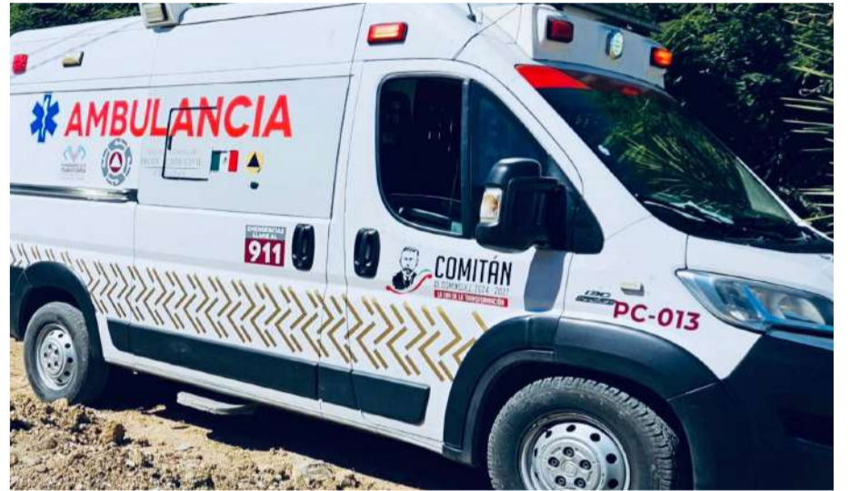
Aun permanece hospitalizada bajo cuidado especializado

población a extremar precauciones durante las lluvias y tormentas eléctricas para evitar este tipo de incidentes.