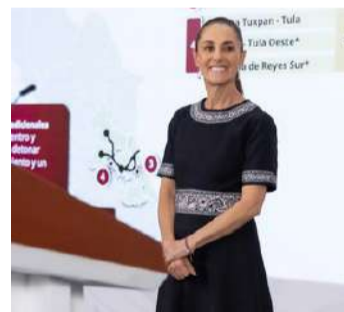
Red nacional de ductos abastecerá 13 nuevas centrales eléctricas hacia el año 2030

Mientras que, en los próximos años se desarrollarán gasoductos en el centro y sur del país que dará 2 mil 583 millones de pies cúbicos (MMpc) de gas natural: el Ramal Cosoleacaque, que entrará en ope-