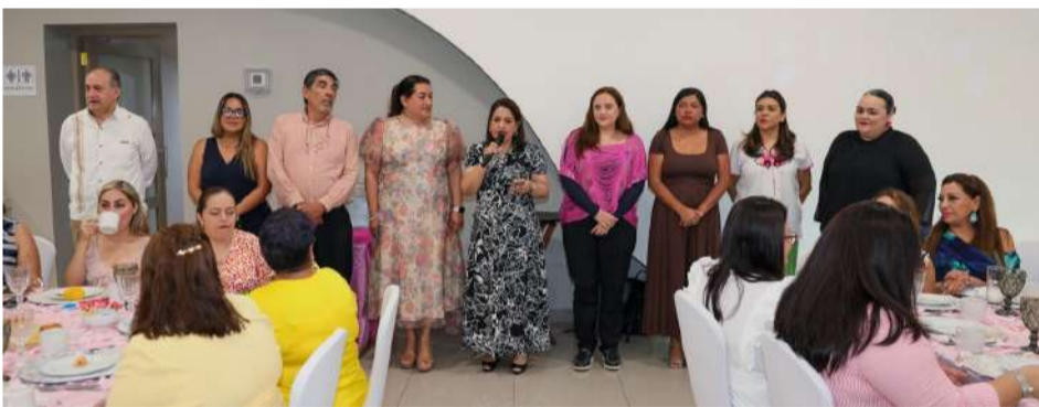
Compartieron un momento de convivencia y reconocimiento