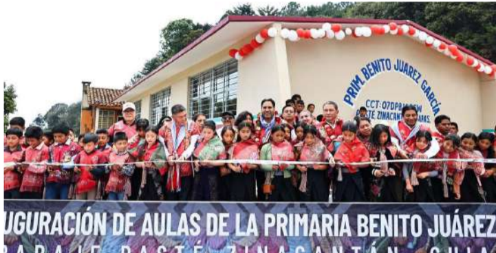
Por primera vez en la historia del municipio, el titular del ejecutivo chiapaneco recorrió parajes de difícil acceso

■ Inversión conjunta de 17.8 millones beneficiará a más de 23 mil habitantes tsotsiles