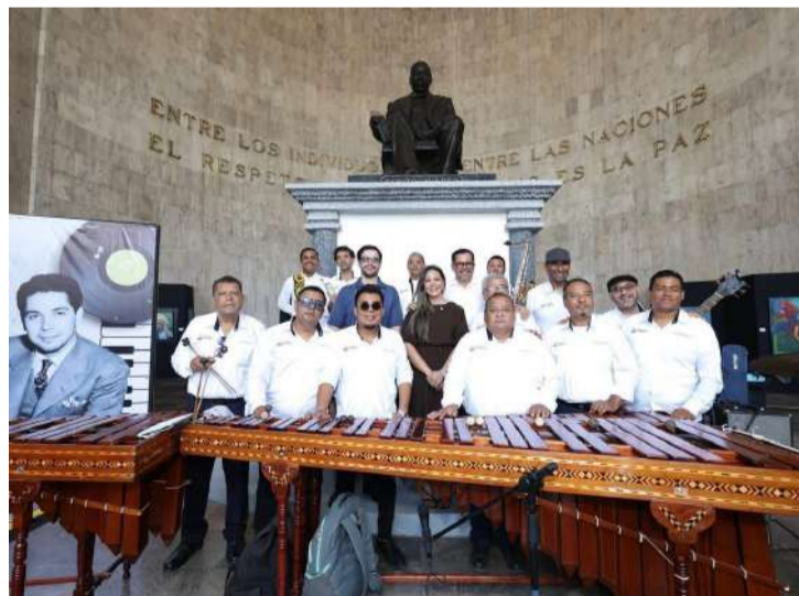
Artistas interpretaron piezas emblemáticas del compositor

La parte instrumental corrió a cargo de la Marimba Orquesta Seguridad Pública del Coneculta, agrupación con 72 años de trayectoria que ha llevado el son chiapaneco a escenarios de México, Estados Unidos,