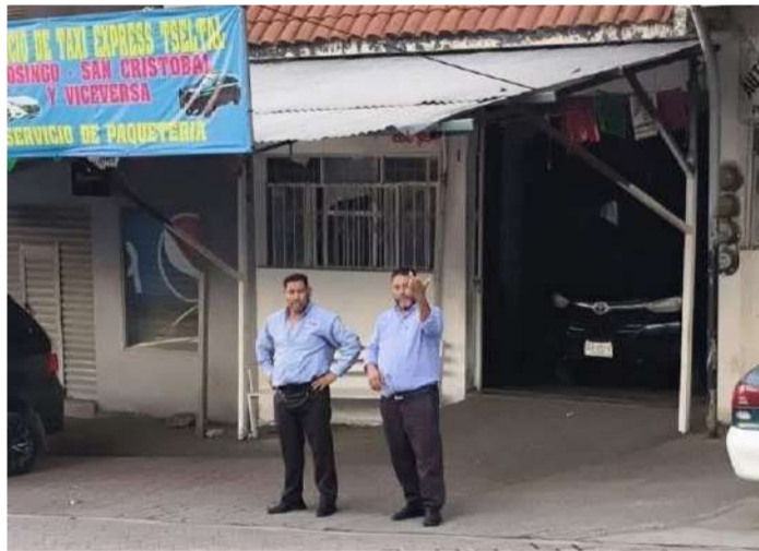
Evidencia conflictos internos que impactan a terceros

El denunciante señaló que, tras estacionarse momentáneamente sobre la banqueta —la cual afirmó es un espacio público—, fue objeto de insultos y señas obscenas por parte de los choferes. La situación escaló cuando uno de los conductores intentó retirar su equipaje, lo que de-