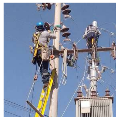
Técnicos realizarán maniobras para optimizar el suministro

La CFE explicó que estas labores forman parte del mantenimiento a la red eléctrica, por lo que es necesario dese-