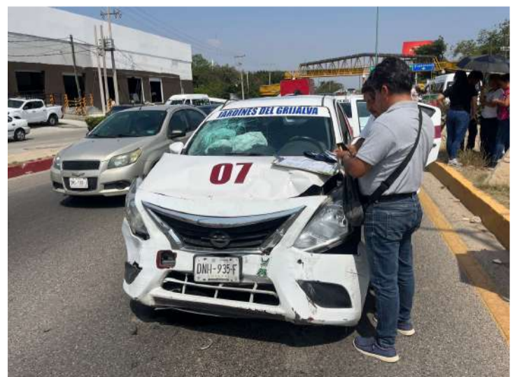
Tres vehículos resultan destruidos

El tráfico vehicular se vio momentáneamente afectado, por lo que elementos de Tránsito Municipal acudieron al lugar para realizar el peritaje correspondiente y deslindar responsabilidades.