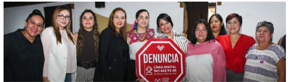
Personal municipal participa en el taller dirigido por la alcaldesa

“Reconocemos el liderazgo de la Presidenta Municipal por priorizar siempre el bienestar de las mujeres. Este taller es para que, desde sus trin-