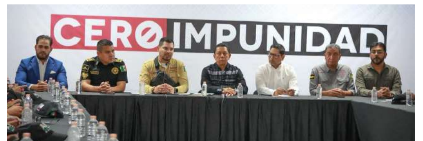
Seguridad con nuevos mandos

Autoridades estatales insistieron en que la protección de la población es un compromiso permanente. La designación de nuevos mandos representa un paso firme en la consolidación de estrategias integrales de seguridad, con vigilancia, prevención y acción inmediata como ejes centrales. Los ciudadanos, aseguran, deben percibir resultados concretos que garanticen tranquilidad y certeza en su vida diaria.