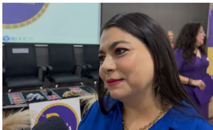
El Tribunal Electoral asegura condiciones estables y preparación para 2027

Añadió que desde el inicio de su gestión se impulsa la campaña “Mazo