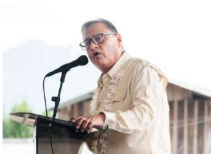
Arranca proyecto que llevará servicio básico a decenas de hogares

El presidente municipal de Pantepec, Osmar Wilian Velasco García, acompañado por la directora general de la Comisión Estatal de Agua y Saneamiento (CEAS), Karina Montesinos Cárdenas, integrantes del cabildo y habitantes de la región, dio el banderazo de inicio a la construcción del Sistema de Agua Potable en la comunidad La Soledad, una obra destinada a mejorar el acceso a servicios básicos para las familias de la localidad.