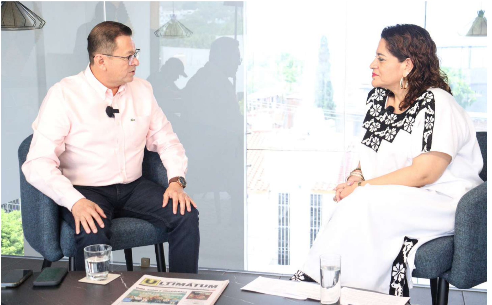
Las mujeres tienen diferentes instituciones para denunciar cualquier tipo de violencia en materia electoral