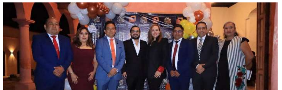
La alcaldesa participó en la conmemoración del organismo profesional

Por su parte, los representantes del Colegio de Arquitectos del Sureste agradecieron el acompañamiento de las autoridades municipales y reiteraron su disposición de seguir colaborando con propuestas y conocimientos especializados que permitan consolidar un desarrollo ordenado y sostenible para San Cristóbal de Las Casas.