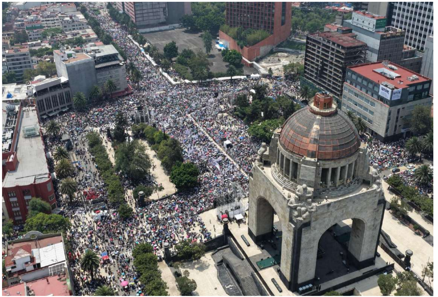
Convocó al pueblo a organizarse en defensa de la soberanía nacional

En infraestructura, la mandataria informó que se ha avanzado en la repavimentación del 30 por ciento de los 43 mil kilómetros de carreteras libres de peaje del país, y que el Tren Insurgente ya transportó más de 20 millones