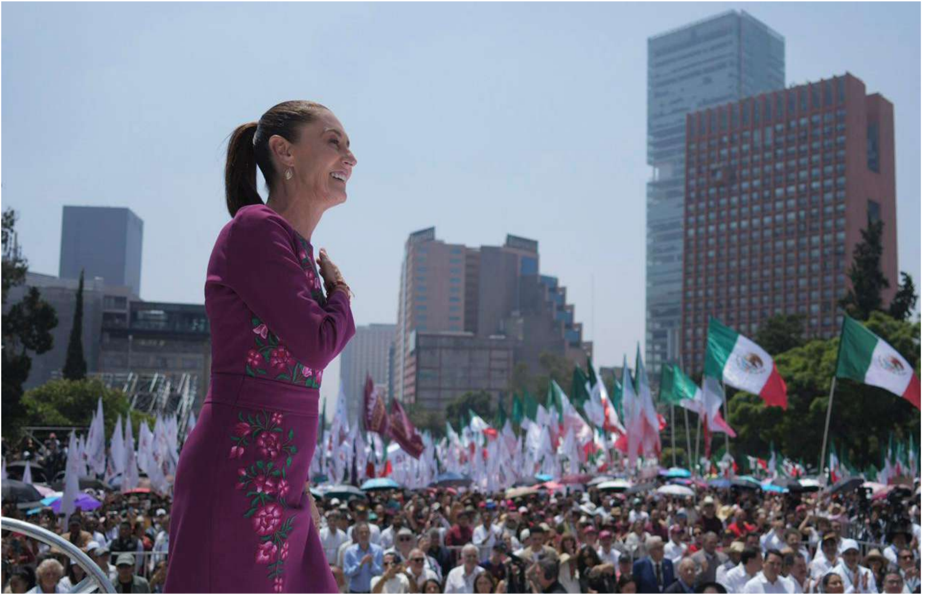
En su mensaje, la mandataria presentó indicadores de empleo, inversión, salud, educación e infraestructura