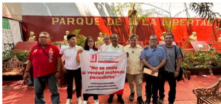
Se pronunciaron en Tuxtla Gutiérrez por la defensa de la libertad de expresión