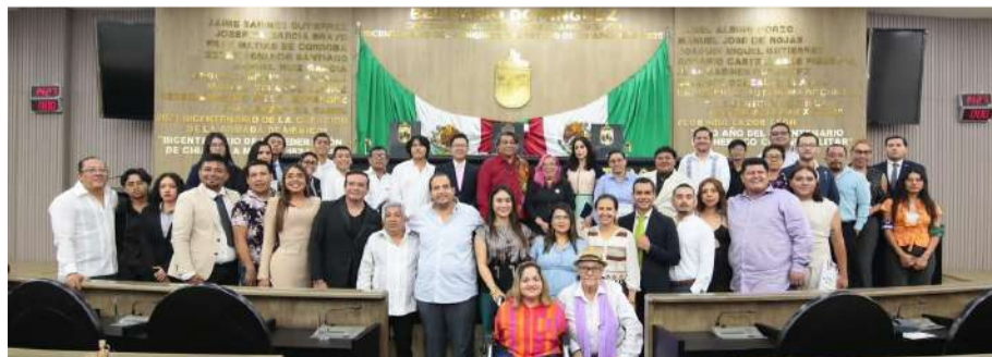
Representantes de la diversidad llevaron propuestas a la máxima tribuna

En sus intervenciones, las y los parlamentarios abordaron temas como el reconocimiento de identidades de género, el acceso a servicios de salud y educación, la participación política, la atención a grupos vulnerables y la eliminación de discursos de odio. Coincidieron en la importancia de continuar construyendo una sociedad más justa, plural y respetuosa de la diversidad.