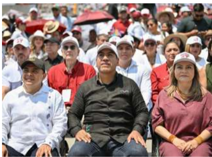
Liderazgos estatales se congregaron en el Parque Bicentenario para escuchar el informe