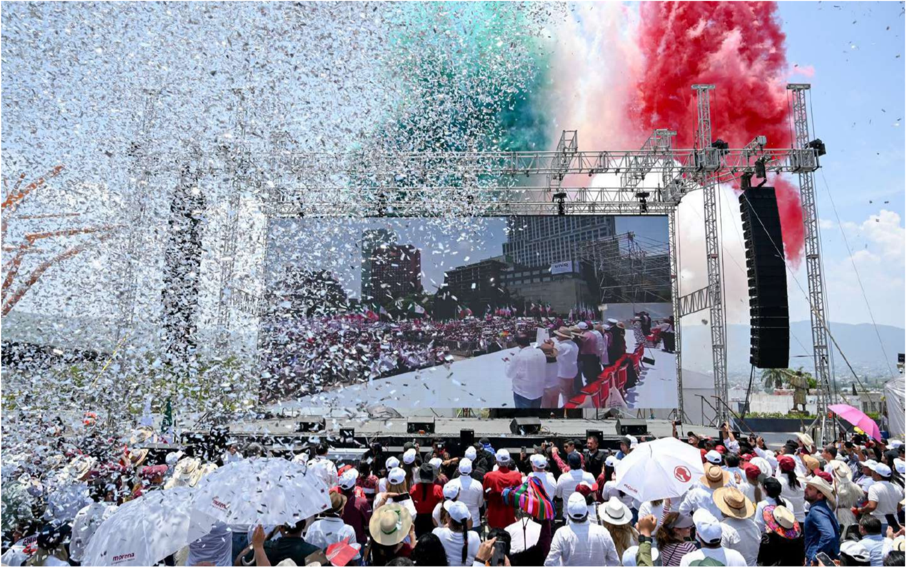
Simpatizantes y militantes de Morena se reunieron en el Parque Bicentenario de Tuxtla Gutiérrez