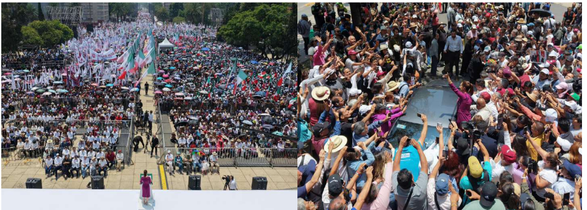
Dedicó una parte central del informe a denunciar la injerencia extranjera en asuntos internos de México

Al cierre de su mensaje, la presidenta convocó a la ciudadanía a realizar asambleas informativas en plazas públicas, repartir volantes y periódicos, e informar al pueblo sobre la defensa de la soberanía nacional. “A todas y todos los mexicanos: podemos tener diferencias, pero hay algo en lo que todas y todos deberíamos estar de acuerdo: en México decidimos las y los mexicanos”, concluyó.