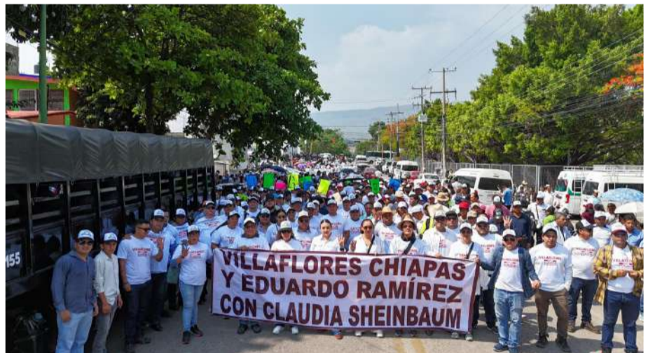
Se destacó el compromiso con la democracia, la soberanía y el bienestar familiar

En el acto también se hizo énfasis en la importancia de preservar la soberanía nacional, consolidar la democracia y mantener la co-