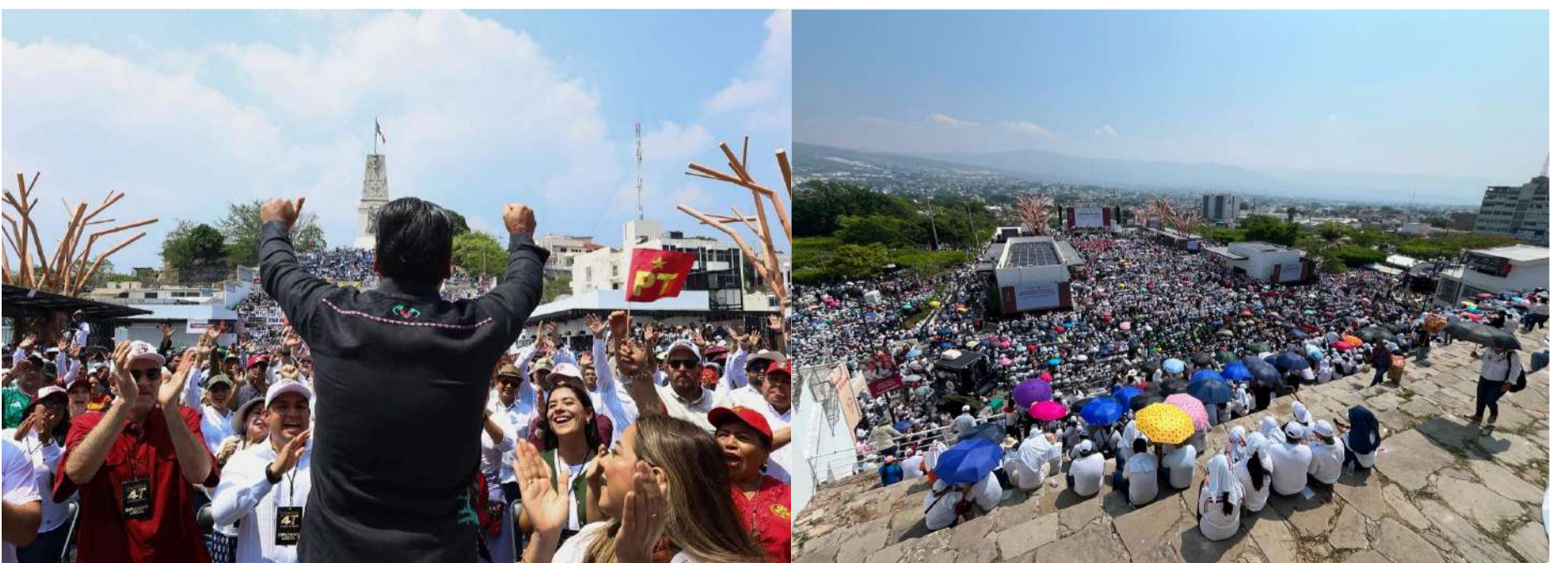
Chiapas fue uno de los estados donde el acto de transmisión del informe tuvo mayor presencia de militantes y simpatizantes

El acto en Chiapas formó parte de una estrategia nacional de Morena para acompañar el informe presidencial con movilizaciones simultáneas en todo el territorio, dotando al evento de una dimensión política que va más allá de la rendición de cuentas institucional y que busca renovar el vínculo emocional entre la militancia y el proyecto de gobierno.