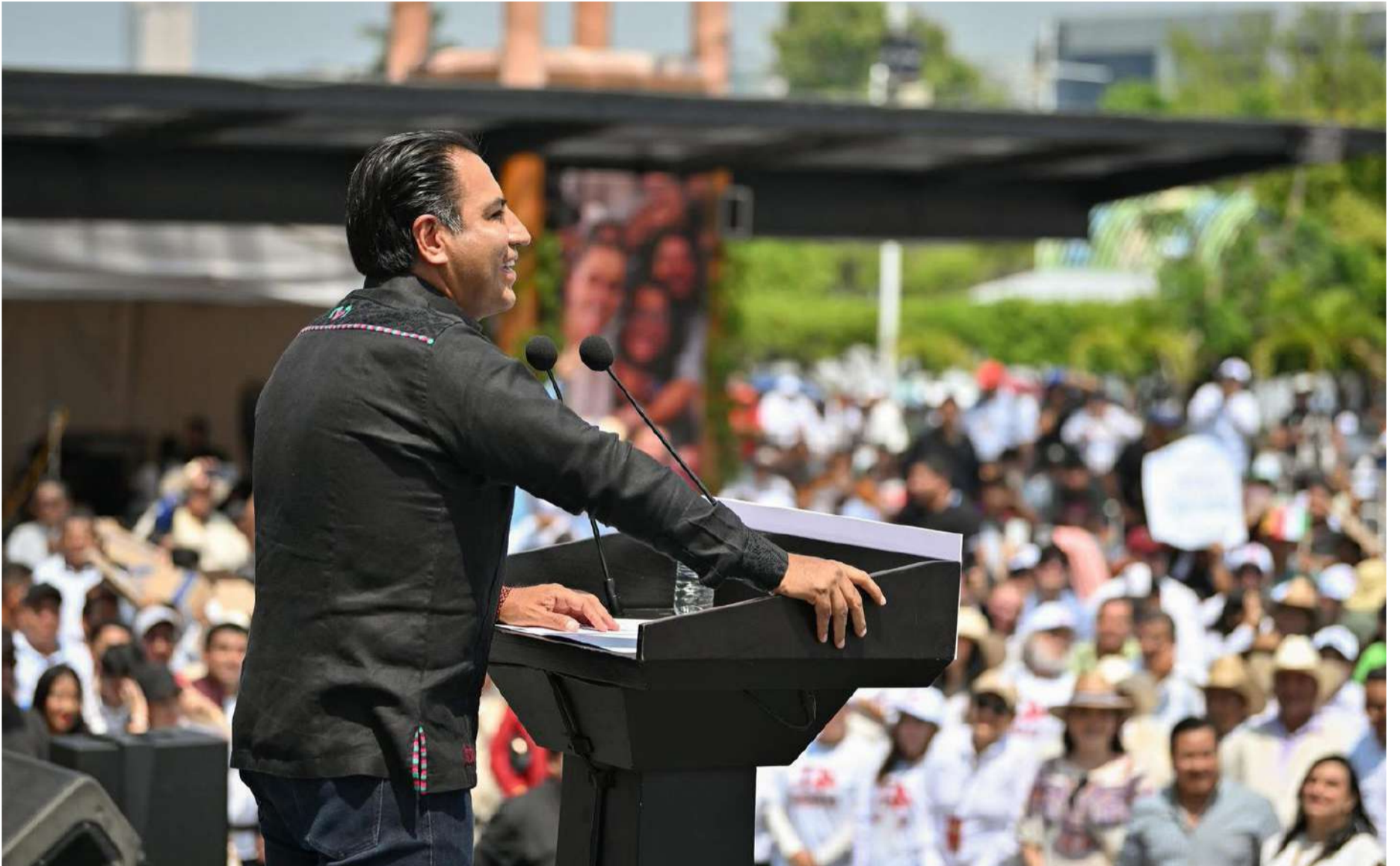
El mandatario chiapaneco dio un discurso que reivindicó la soberanía nacional y evocó la expropiación petrolera de Cárdenas