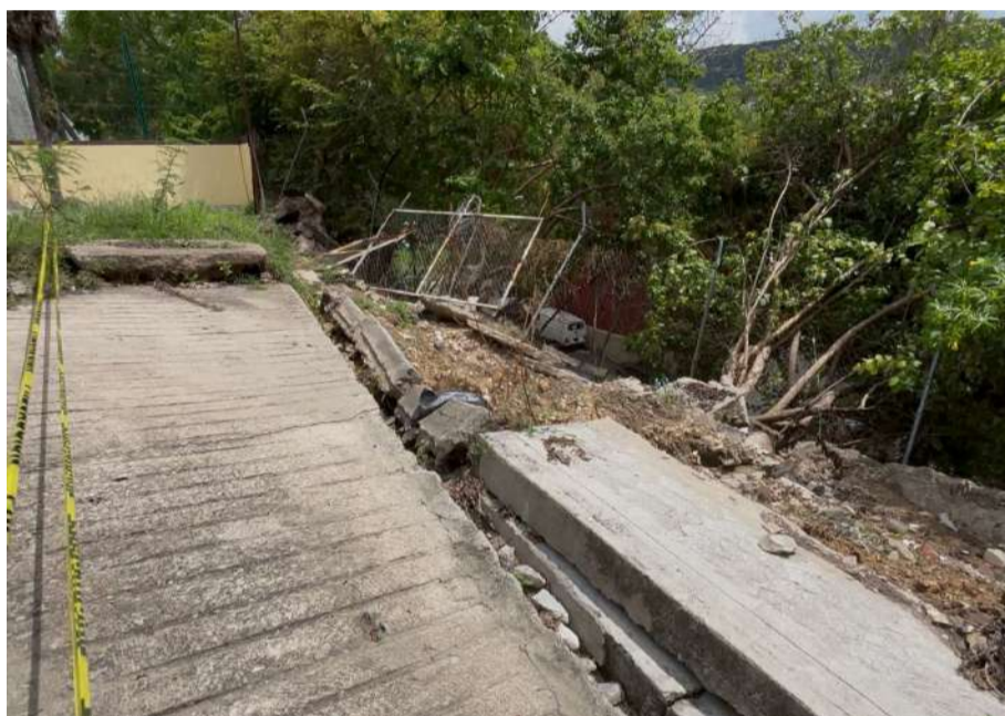
Habitantes exigen intervención inmediata ante peligro

efectuar una inspección preliminar y evaluar las condiciones del área afectada.