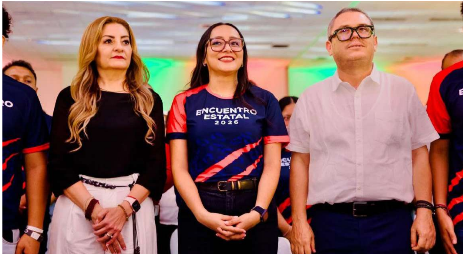
El gobernador Eduardo Ramírez Aguilar envió un mensaje a los jóvenes que participan en la contienda