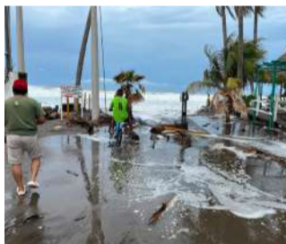
El avance del océano cubrió áreas próximas a la franja costera de Puerto Arista

Personal de la Delegación Regional Istmo-Costa y de Protección Civil Municipal realizó recorridos de supervisión y atención preventiva, además de brindar apoyo a propietarios de palapas y establecimientos