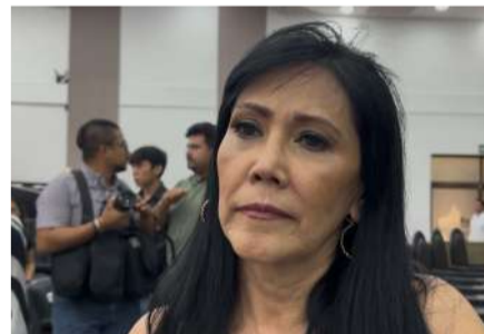
Operadores reportan escaso interés de viajeros ligados a la justa futbolística

La representante destacó que el panorama para las vacaciones de verano es distinto, ya que existe una