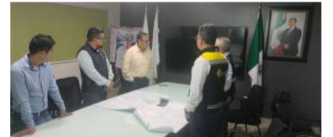
Autoridades consolidan acuerdos para iniciar proyectos de agua y saneamiento

Asimismo, reconoció el respaldo brindado por el Gobierno del Estado para impulsar acciones enfocadas en ampliar la cobertura de servicios esenciales, especialmente en zonas que durante años han requerido mayores