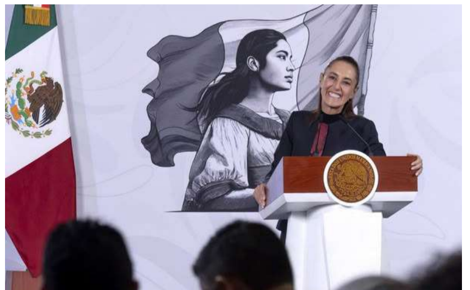
Las medidas del decreto mundialista son aplicables exclusivamente para el día del partido inaugural

Las medidas contempladas en el decreto son tres. Para el sector público federal, las dependencias con sede en la Ciudad de México deberán privilegiar el uso de tecnologías de la información y comunicación, incluyendo trabajo a distancia y teletrabajo. Para el sector privado y social, se exhorta a adoptar el teletrabajo en actividades administrativas no esenciales. En materia