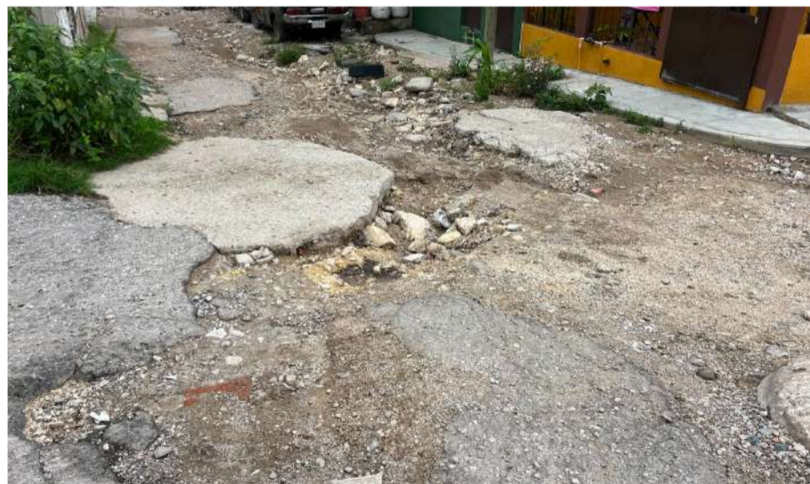
Vecinos imputan omisión oficial ante vialidades destruidas y drenajes colapsados

Los inconformes también responsabilizaron al Sistema Municipal de Agua Potable y Alcantarillado (SMAPA), al señalar que tras trabajos realizados para reparar una toma domiciliaria, la superficie de una de las vialidades que