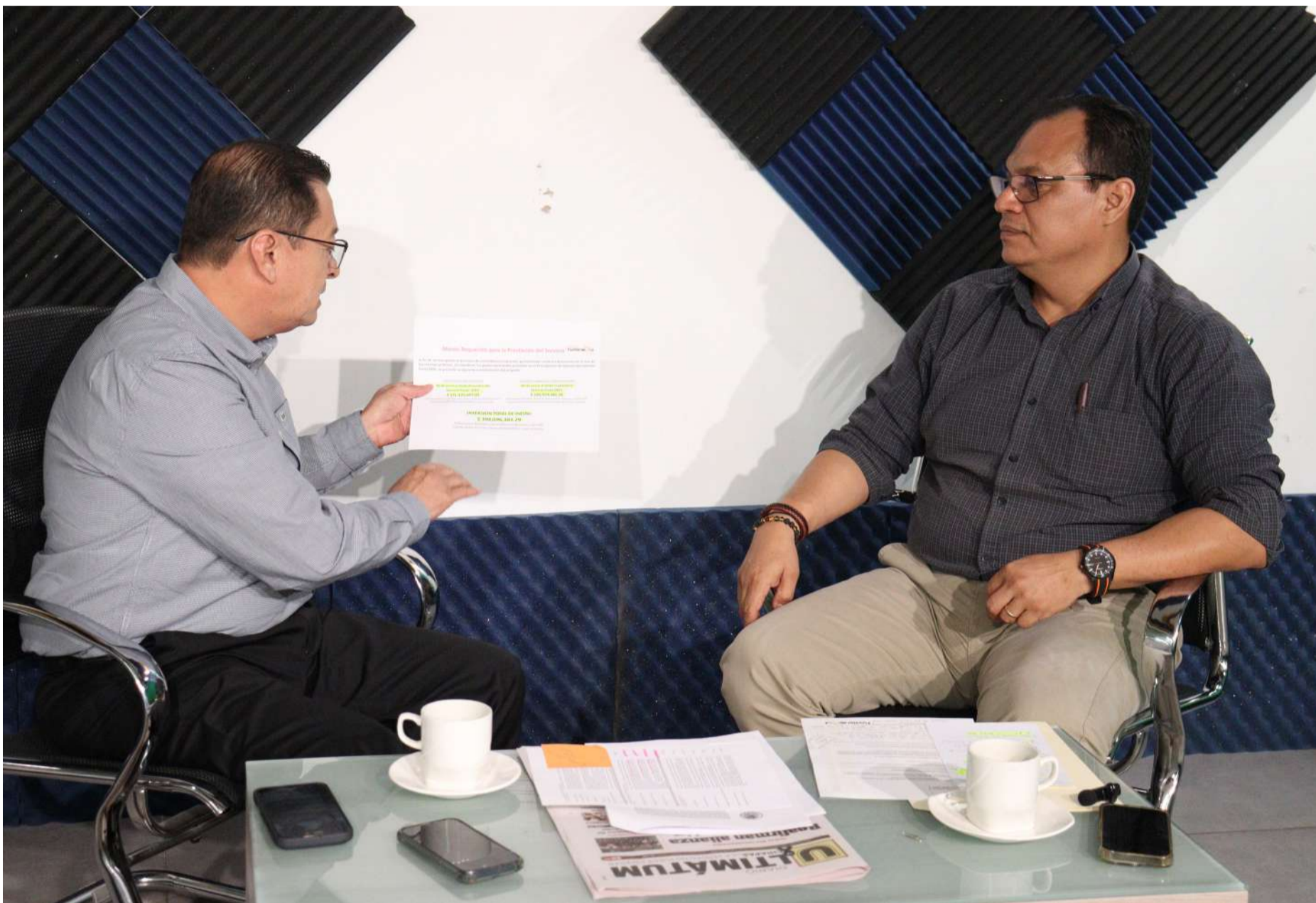
Regidores cuestionan y el alcalde guarda silencio