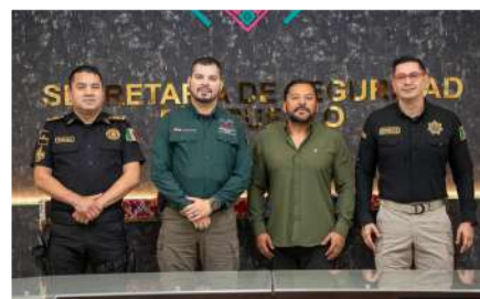
Impulsan mecanismos de coordinación, supervisión y fortalecimiento institucional

Aparicio Avendaño destacó que la suma de esfuerzos entre organismos