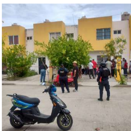
El hallazgo ocurrió dentro de un domicilio del fraccionamiento Paraíso

Una mujer identificada como Rocío, de 39 años de edad, fue localizada sin vida la mañana de este martes en el fraccionamiento Paraíso, en el municipio de Tonalá, hecho que generó la movilización de corporaciones de seguridad y personal ministerial.