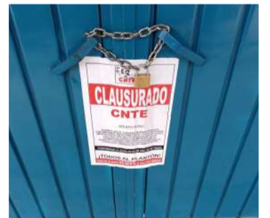
Manifestantes colocaron candados y sellos en el plantel

Al respecto, más de 30 maestros del CNTE, la tarde de este día se presentaron de manera violenta en la escuela primaria General Miguel Utrilla para clausurar las puertas de la institución educativa, ocurrido en la colonia Prudencio Moscoso, al norte de la ciudad colonial, para exigir a unirse al paro nacional.