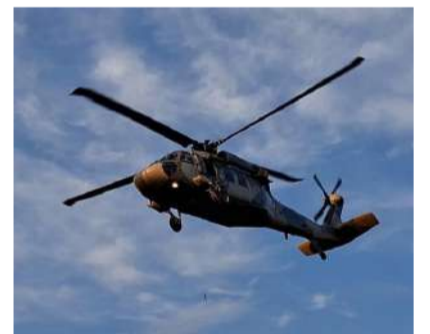
Una agresión armada derivó en una intensa movilización

Como resultado de estos hechos, se reportó una persona presuntamente vinculada al grupo