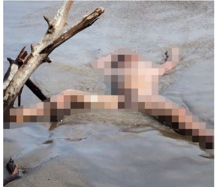
El cuerpo estaba junto a cauce en Suchiate

Hasta el cierre de esta información, las autoridades no habían revelado mayores detalles sobre la identidad de la víctima ni sobre las circunstancias en las que ocurrieron los hechos. La Fiscalía correspondiente abrió una carpeta de investigación para esclarecer el caso.