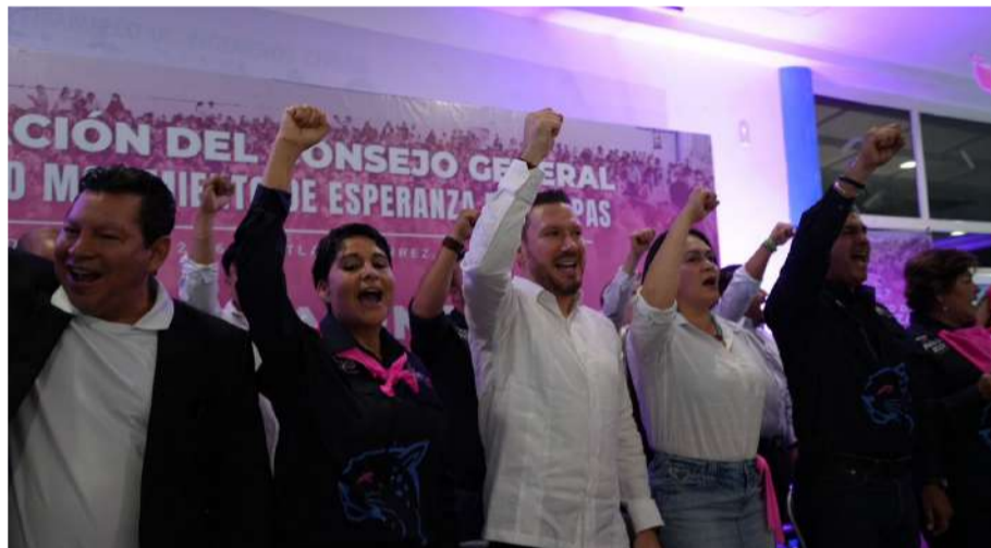
Abren paso a mayor participación ciudadana en el estado