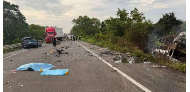
La unidad de pasajeros terminó incendiada

Versiones preliminares señalan que la camioneta habría invadido el carril contrario presuntamente al intentar rebasar otro vehículo, provocando el encontronazo