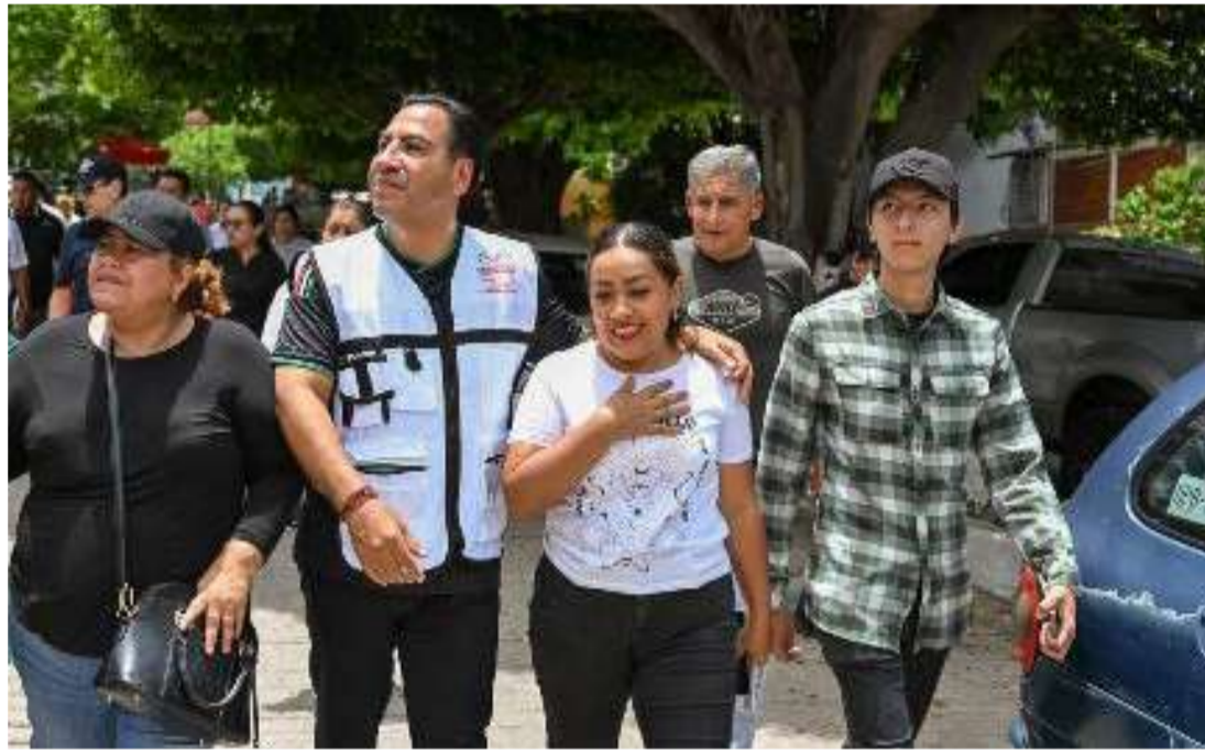
Recorridos oficiales marcan nueva etapa urbana en la capital

En otro momento, en la colonia Los Laguitos, recorrió y supervisó los avances de la pavimentación y el mejoramiento integral de