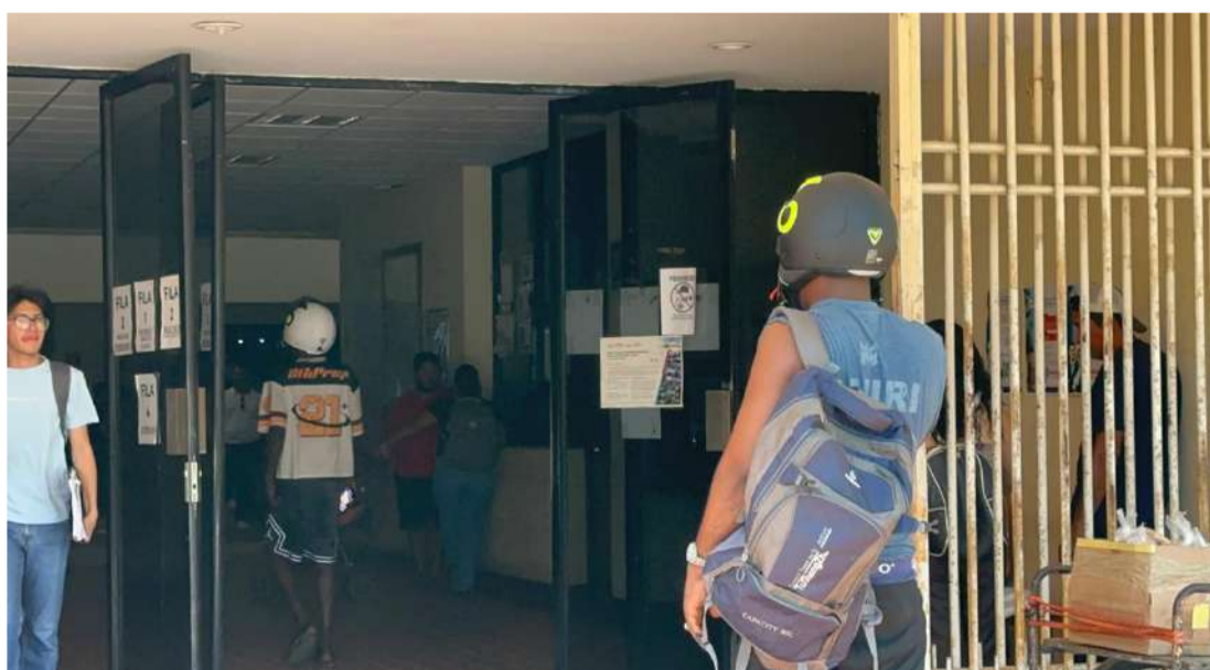
Organizaciones alertan sobre mayor flujo de personas expulsadas

Además, dijo que también vienen migrantes que están siendo deportados en autobuses de manera directa a los estados del sureste.