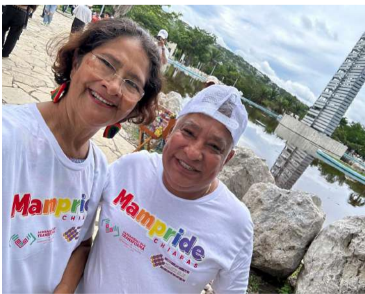
Llaman a fortalecer derechos, inclusión y memoria para la comunidad LGBTIQ+