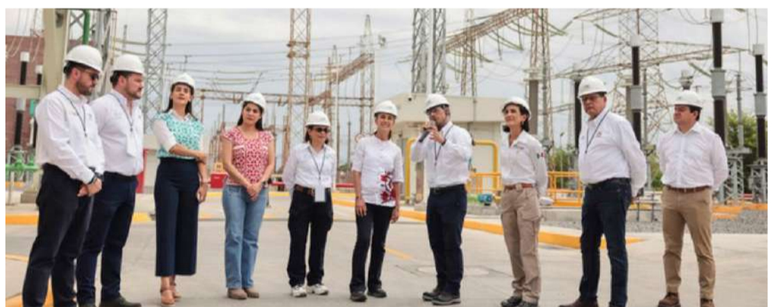
La obra convierte a Manzanillo en el complejo eléctrico más grande del país

Recordó que en el Segundo Piso de la Cuarta Transformación se logró modificar la reforma energética de 2013 en dos ejes clave: dar a la CFE prioridad en el despacho eléctrico, establecerla como Empresa Pública del Estado e integrarla verticalmente, garantizando que genere el 54 por cien-