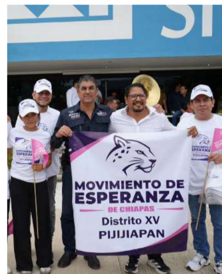
Dirigencia trabaja para equilibrar postulaciones municipales

“Los pueblos originarios siempre han sido abandonados. Entonces es