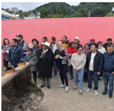
La presidenta encabezó el comienzo de los trabajos

Asimismo, reconoció el trabajo coordinado entre autoridades auxiliares, comités comunitarios y el Ayuntamiento, esfuerzo que permi-