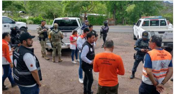
Inspecciones revelan incumplimientos en materia preventiva

■ Autoridades impusieron sanciones, emitieron advertencias y ordenaron corregir deficiencias localizadas