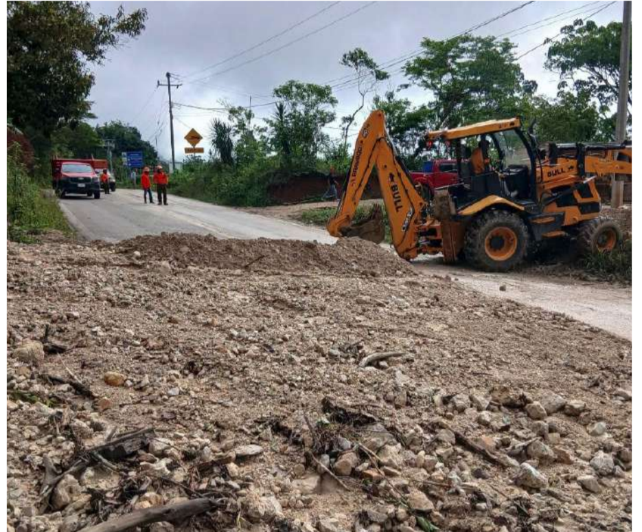
Desprendimiento de tierra complica tránsito en ruta federal

Asimismo, Protección Civil advirtió que las lluvias podrían persis-