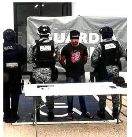
Un hombre fue puesto bajo resguardo de las autoridades

Asimismo, los elementos aseguraron un arma corta de fa-