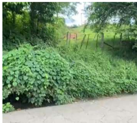
La víctima continua en calidad de desconocida

De acuerdo con reportes preliminares, la víctima corresponde a una mujer de entre 20 y 25 años de edad. Vestía una blusa gris y shorts de mezclilla negros; sin embargo, el avanzado estado de des-