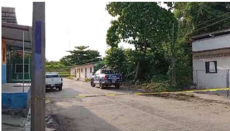
Recibió impactos en distintas partes del cuerpo