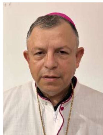
Pide acuerdos responsables para evitar más perjuicios colectivos

planteamientos para que la nueva escuela mexicana verdaderamente se repiense y no sea una escuela ideologizada, sino una escuela que busque el bien común de docentes, administrativos y particularmente de los estudiantes”, afirmó.