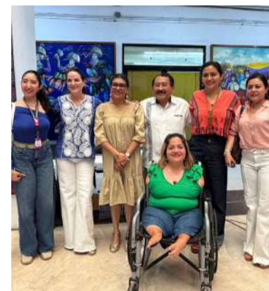
Espacio de diálogo para construir una agenda más incluyente

La jornada fue encabezada por diputadas y diputados integrantes de la LXIX Legislatura, además de contar con la asistencia de representantes del Instituto de Elecciones y Participación Ciudadana (IEPC),