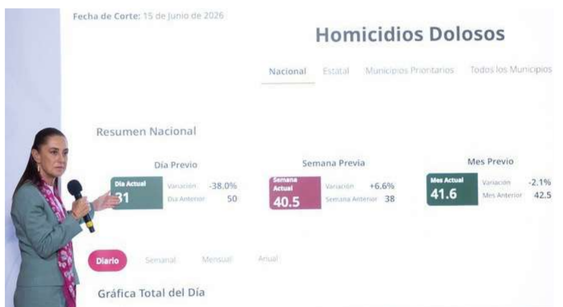
Gobierno federal destaca descenso sostenido en violencia

Los delitos de alto impacto también registraron una baja del 31 por ciento al pasar de 636.6 en septiembre de 2024 a 437.7 en mayo de 2026. Con datos hasta mayo, el impacto anual acumula una reducción del 53 por ciento respecto a 2018.