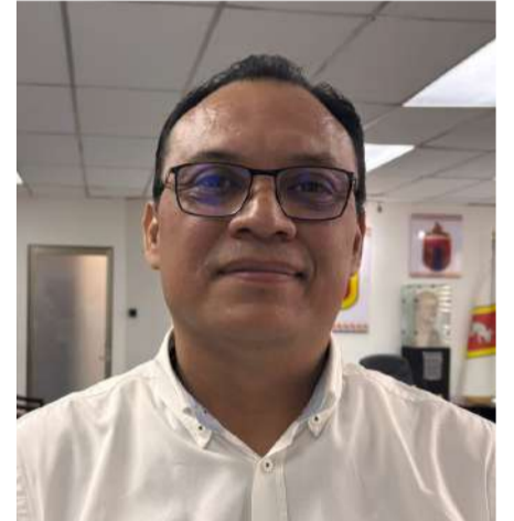
Señalan opacidad y posible daño a las finanzas municipales

rrentes por presuntas deficiencias en el servicio desde la llegada de la actual administración municipal.