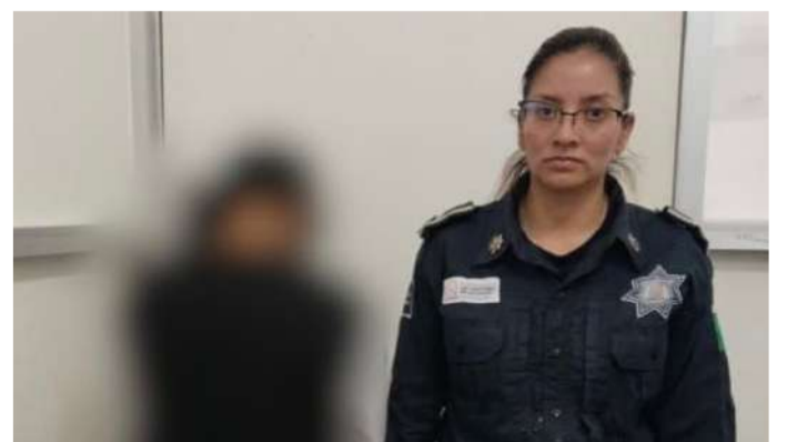
La menor quedó bajo resguardo institucional

Tras acudir al lugar, los elementos municipales realizaron las diligencias correspondientes y pusieron a la adolescente a disposición de las autoridades competentes, quienes darán seguimiento al caso y determinarán las medidas necesarias para salvaguardar sus derechos e integridad.