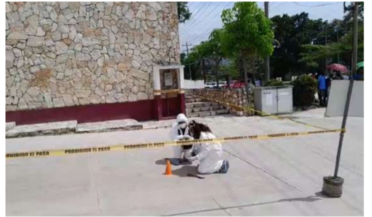
El herido fue trasladado de urgencia al hospital de Palenque

Hasta el momento, las autoridades no han dado a conocer si existe alguna persona detenida en relación con este incidente, ni han precisado las causas que ori-