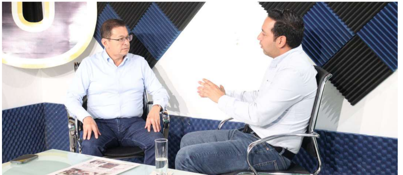
Reportan avances en la restauración ambiental con el retiro masivo de palma africana

El funcionario recordó que se detectaron plantaciones en la zona de amortiguamiento e incluso alrededor de 400 hectáreas dentro de la zona núcleo de la reserva, donde la legislación prohíbe cualquier actividad que represente riesgos para el entorno natural.