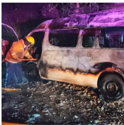
No hubo pérdidas humanas

logró rescatar algunas de sus pertenencias y ponerse a salvo antes de que las llamas se propagaran rápidamente. A la distancia, observó cómo el fuego terminaba por consumir por completo el vehículo.