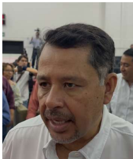
Desde el Congreso local reiteraron disposición para facilitar acercamientos