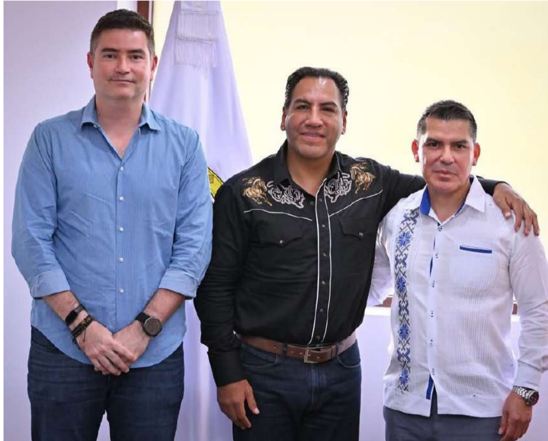
Autoridades consolidan estrategia para ampliar la conectividad aérea de la entidad

Asimismo, se detalló que las frecuencias y horarios serán los siguientes: los lunes, miércoles, jueves y viernes, el vuelo AIFA-Tuxtla Gutiérrez saldrá a las 8:50 horas, mientras que la ruta Tuxtla Gutiérrez-AI-