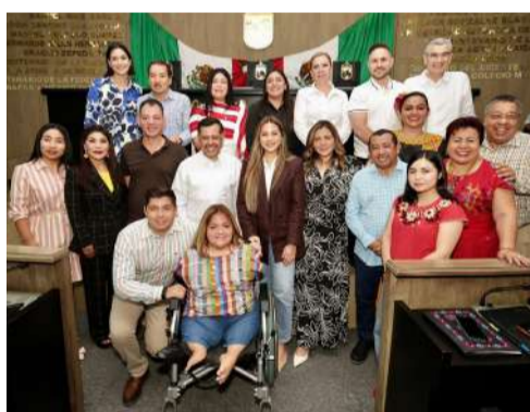
Diputados dieron luz verde a cambios normativos durante sesión ordinaria

Continuando con el orden del día, se autorizó al Ayuntamiento de Comitán de Domínguez, Chiapas, la desincorporación de un predio ubicado en avenida Concepción Bellavista, para enajenarlo vía donación a favor del Gobierno del Estado,