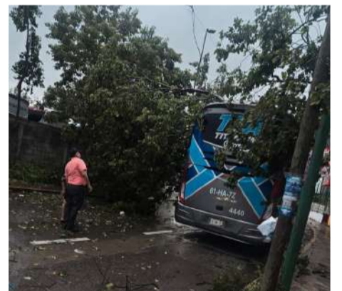
Fuertes vientos causaron daños en una unidad de transporte

Tras el reporte, elementos de la Policía Municipal a bordo de la unidad 0466 acudieron al sitio para acordonar y abanderar el área, con el fin de prevenir otro percance y brindar seguridad a los automovilistas que transitaban por la zona.