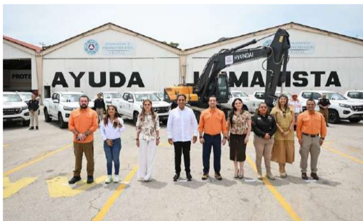
Nuevas unidades reforzarán las labores de prevención y atención

El gobernador informó además que se impulsan proyectos estratégicos para fortalecer la atención