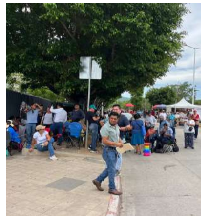
Profesores bloquearon accesos a inmuebles oficiales durante varias horas

Desde las primeras horas del día, los contingentes magisteriales se distribuyeron en distintos puntos de la capital para instalarse en edificios públicos vinculados con la administración y el sistema educativo. Entre los inmuebles intervenidos se encuentran la Torre Chiapas, Planeación Educativa, la Secretaría de Educación, la Subsecretaría de Educación Federalizada, las oficinas de COSICAMM y el área de Pagos.