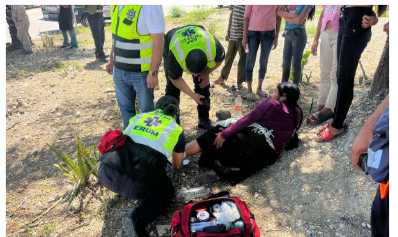
Una maniobra de incorporación terminó en un fuerte encontronazo

Elementos de Tránsito Municipal acudieron al sitio para realizar las diligencias correspondientes y agilizar el tráfico vehicular. Asimismo, una grúa de plataforma se encargó del retiro de las unidades involucradas para restablecer la normalidad en la vialidad.