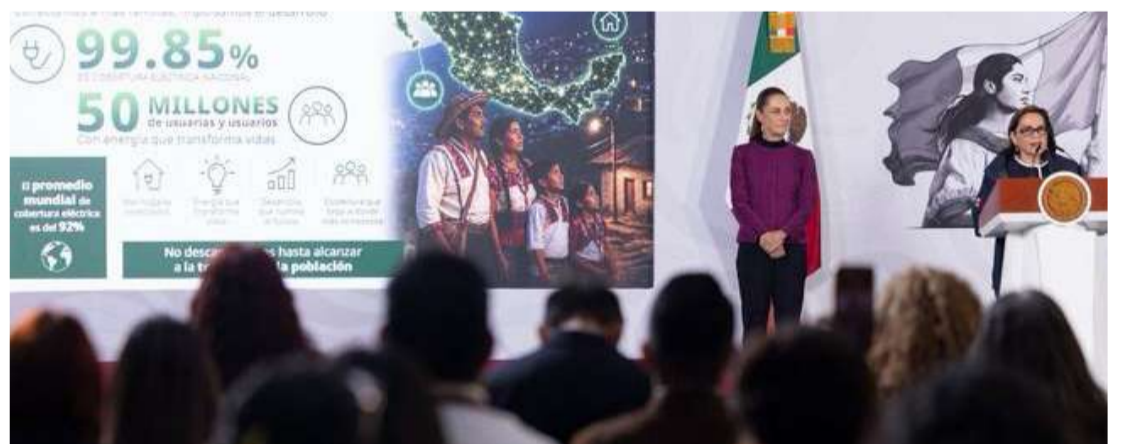
Sheinbaum anunció inversión de 21 mil millones para llevar electricidad a comunidades aisladas antes de 2028

Por su parte, la directora general de la Comisión Federal de Electricidad, Emilia Esther Calleja Alor, informó que actualmente