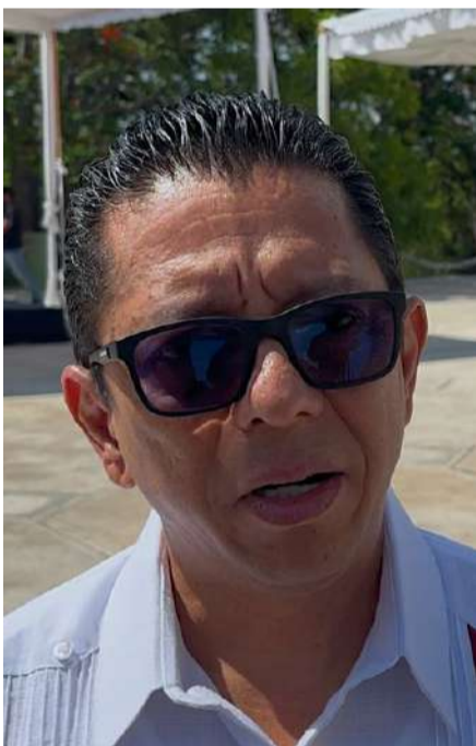
El joven fue encontrado sano y salvo horas después de activarse la alerta

cisión y asegurar que el manejo de los recursos públicos se realice con apego a la legalidad y en beneficio de los habitantes de la capital chiapaneca.