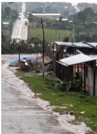
Autoridades mantienen recorridos preventivos

Mientras en el municipio de Chanal, en la región de los Altos de Chiapas,