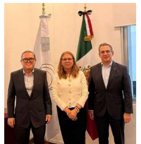
Impulsan universidades cultura democrática entre jóvenes

Entre las acciones contempladas destacan la realización de debates, parlamentos universitarios, actividades de vinculación comunitaria y la Universiada Nacional por la Democracia, iniciativas que buscan consolidar una cultura de participación responsable y una ciudadanía más activa dentro y fuera de las aulas.