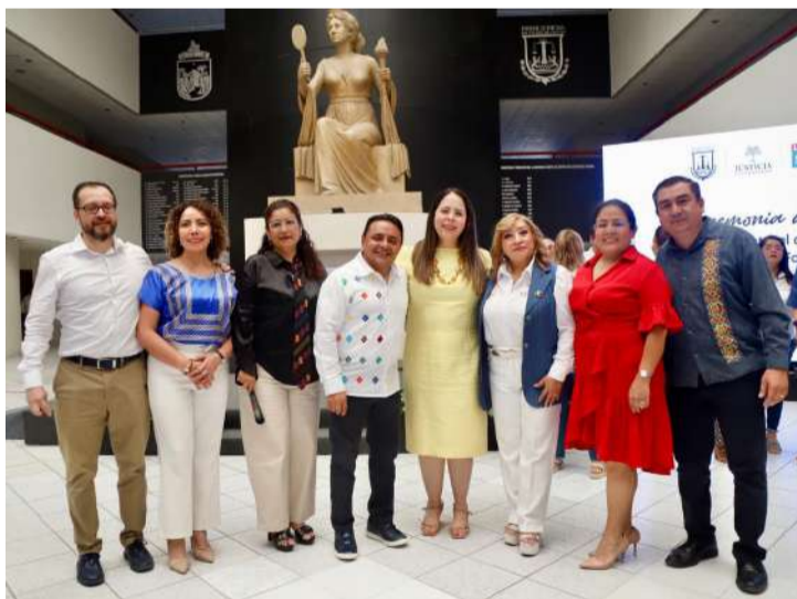
Concluye con éxito la segunda edición de “Restaurando Vínculos”