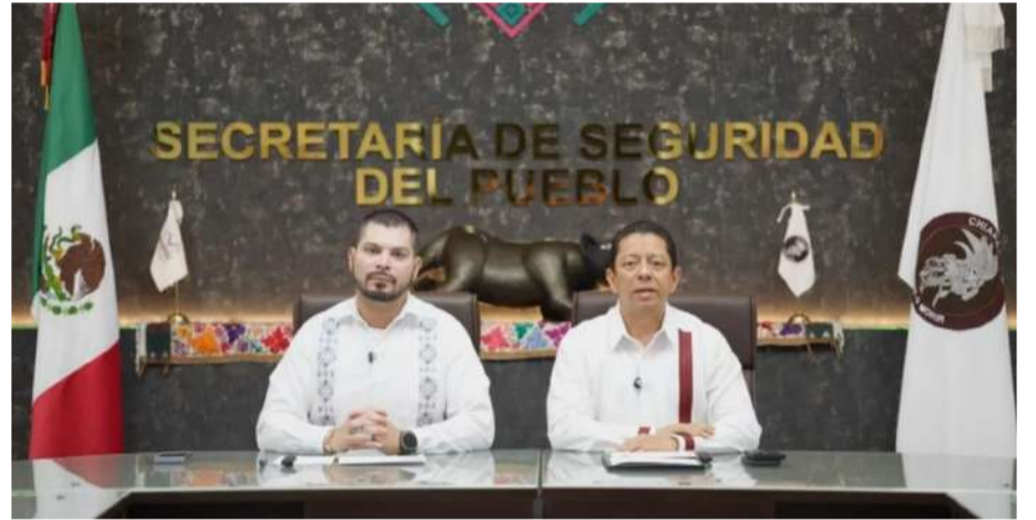
Las denuncias ciudadanas permitieron localizar a los sospechosos