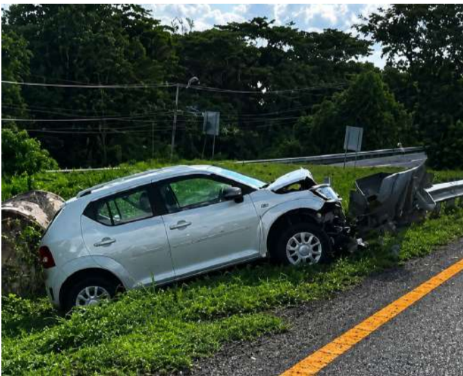
La conductora perdió el control y terminó incrustada en la estructura metálica