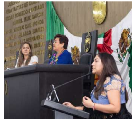
Histórica reforma abre paso a la igualdad

En la misma sesión, el Pleno también aprobó reformas al artículo 104 BIS de la Constitución Política del Estado, autorizó al Ayuntamiento de Mapastepec la baja de seis vehículos inoperantes y turnó a comisiones diversas iniciativas