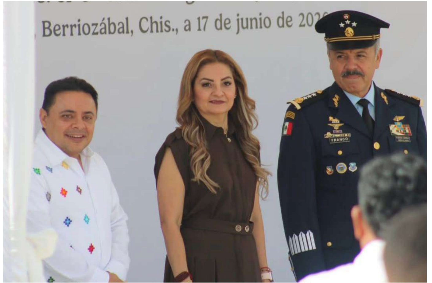
La secretaria general de Gobierno y Mediación representó al gobernador

del Estado reafirmó su compromiso de mantener una colaboración permanente con el Ejército Mexicano en las tareas orientadas a preservar la paz y la estabilidad social en la entidad.