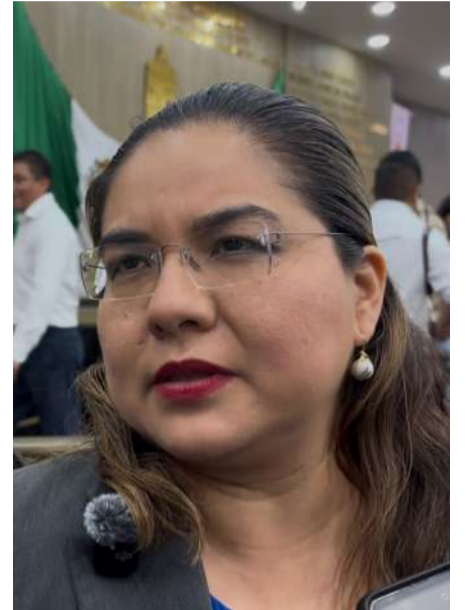
La legisladora pidió transparentar las razones detrás de la contratación

La diputada panista indicó que, ante los señalamientos realizados por algunos integrantes del Cabildo y la posibilidad de que se presenten recursos ante instancias fiscalizadoras y organismos anticorrupción, corresponde al gobierno municipal transparentar todo el proceso. Finalmente, expresó que desde el PAN existe disposición para acompañar cualquier acción institucional que permita esclarecer la de-