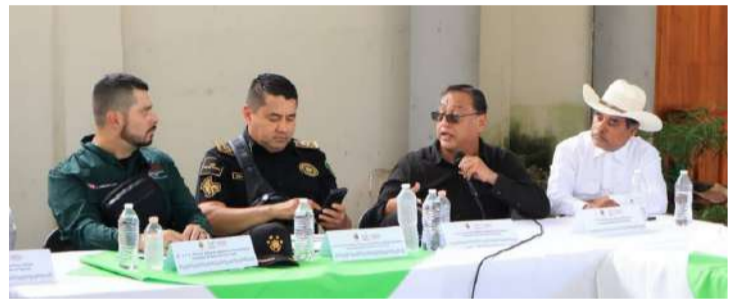
El alcalde de Pantepec se sumó a los acuerdos regionales

Las autoridades coincidieron en que la colaboración entre los distintos niveles de gobierno representa una herramienta fundamental para preservar la paz social, proteger a la ciudadanía y generar mejores condiciones para el desarrollo de las comunidades.