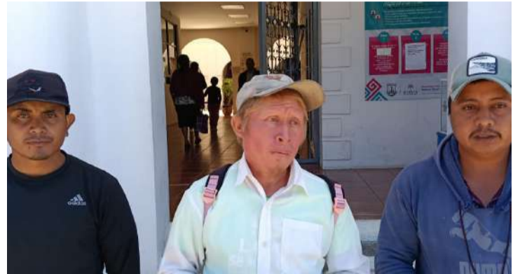
Familiares y campesinos demandan justicia