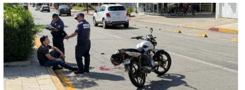
Paramédicos auxiliaron al lesionado en el sitio del accidente

Las autoridades realizaron las diligencias correspondientes para esclarecer las circunstancias del percance y determinar responsabilidades.