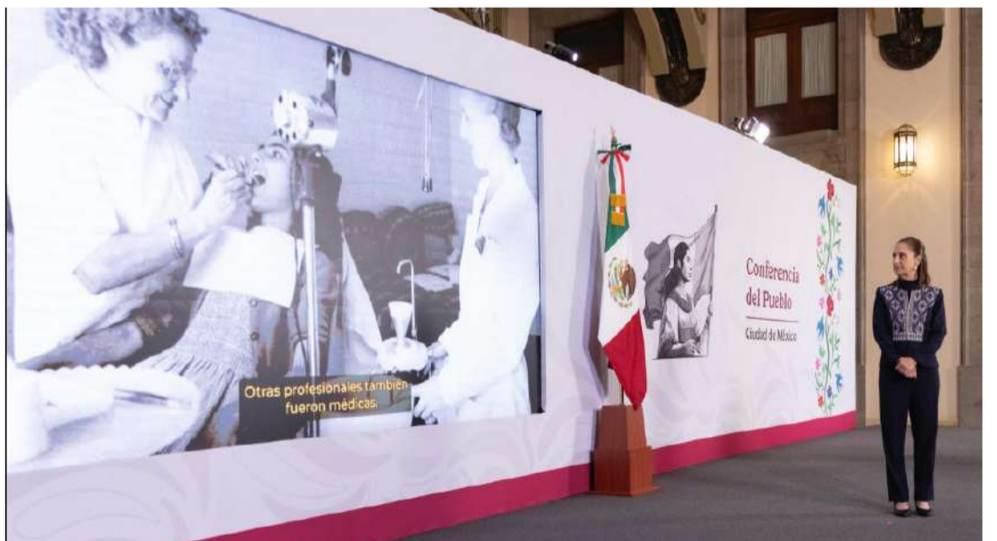
La modernización administrativa alcanza 60% de avance a nivel nacional

Entre los avances destacan las mejoras en servicios como el Registro Civil, donde diversos documentos pueden obtenerse o corregirse en línea, así como la expedición de pasaportes y la atención consular, que