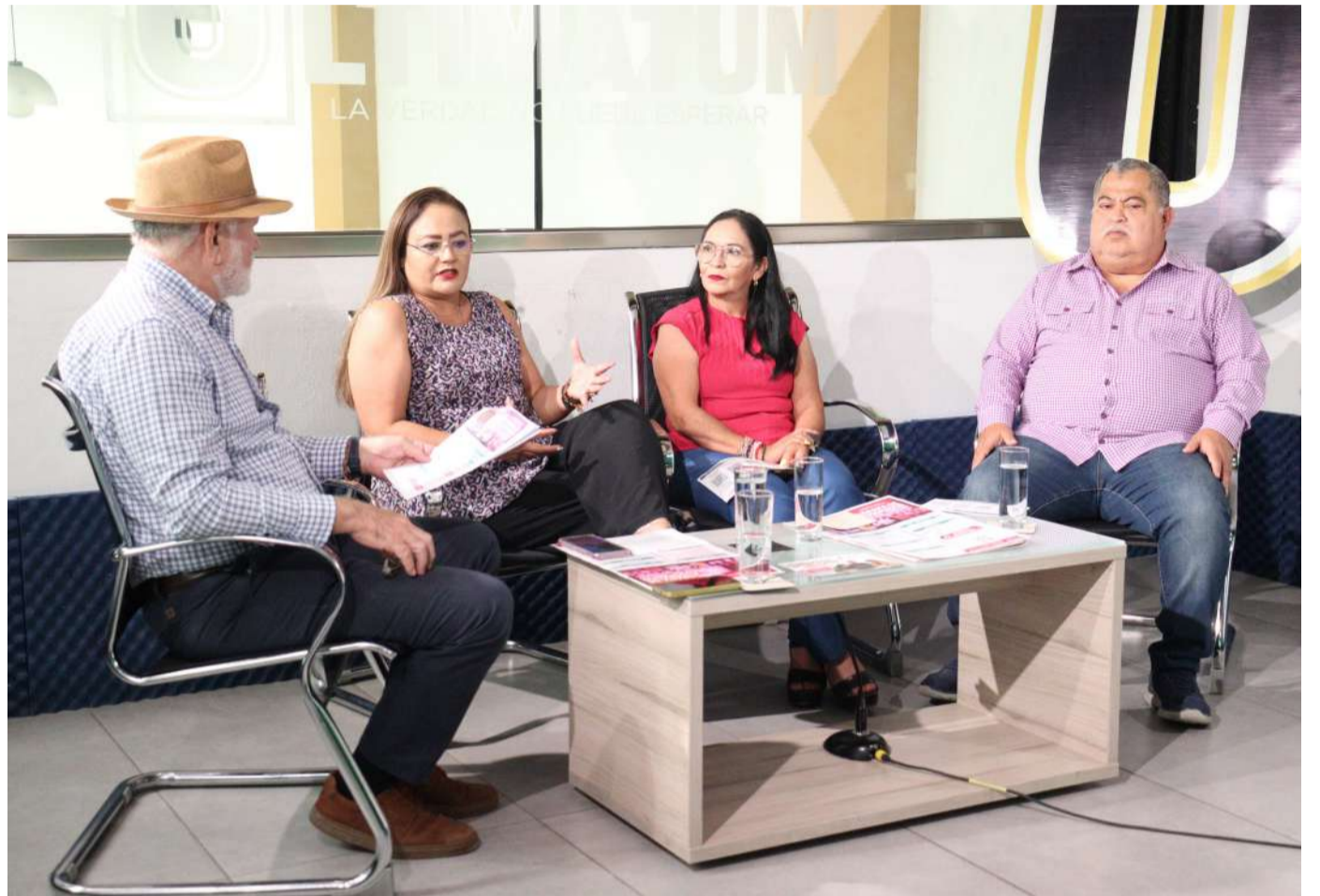
Participan activamente en el programa Chiapas Puede

Cada año, estas evaluaciones alcanzan a aproximadamente un millón 680 mil estudiantes en to-