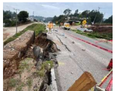
Combatieron el siniestro durante más de tres horas

personal especializado trabajó de manera estratégica para sofocar las llamas y contener el avance del incendio, logrando controlar la parte baja del área afectada y evitando que el fuego continuara propagándose.