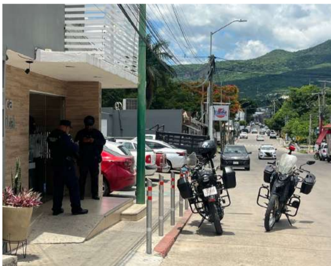
Adulto mayor sufrió una lesión en el pecho

De acuerdo con los primeros datos recabados, la víctima labora como guardia de seguridad y presuntamente manipulaba su pistola cuando ocurrió una detonación que impactó directamente en la región torácica, provocándole una lesión