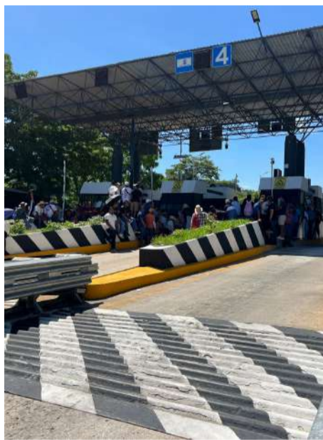
La movilización formó parte de la jornada nacional de protesta del magisterio

Aunque los manifestantes señalaron que las aportaciones eran voluntarias, conductores indicaron que para continuar su trayecto debían entregar al menos 50 pesos. Durante varias horas se registró una constante