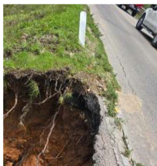
Autoridades llaman a extremar precauciones

De acuerdo con información de los pobladores, la lluvia ha provocado el segundo derrumbe afectando la carretera que comunica de la ciudad de Teopisca a San Cristóbal de las Casas, a la altura de la comunidad San Geron, el pasado 7 de junio se registró el primer derrumbe, hasta esta mañana del jueves no hay presencia de maquinarias para tratar de solucionar este problema vial que está afectando a los automovilistas,