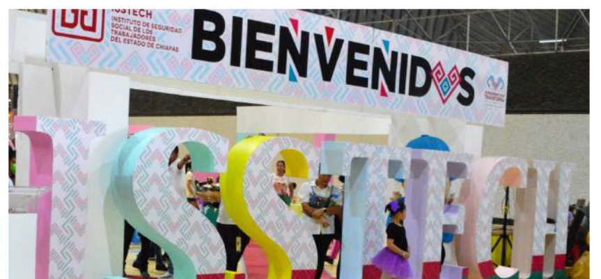
Ofrecerá espacios de aprendizaje, convivencia y recreación para la niñez

La institución informó que durante el desarrollo del curso se implementarán medidas especiales de protección, incluyendo vigilancia permanente y controles estrictos de ingreso y salida, con el objetivo de brindar un entorno seguro y adecuado para el aprendizaje, la convivencia y el desarrollo integral de las y los asistentes.