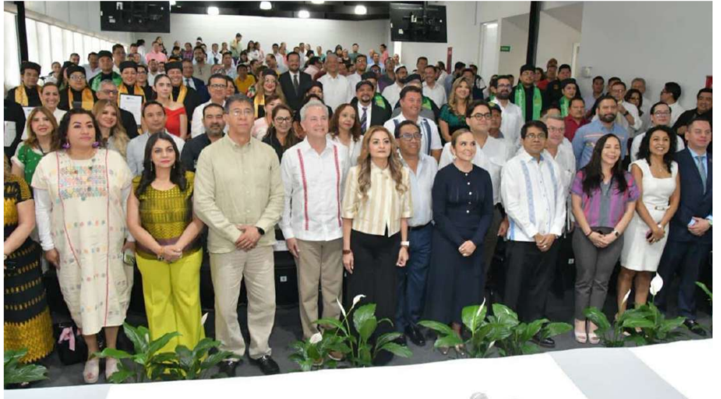
Durante el acto se entregaron títulos de maestría y doctorado a profesionistas

En el marco de esta celebración también se realizó la entrega de títulos de maestría y doctorado a egresadas y egresados que concluyeron satisfactoriamente sus estudios de posgrado, consolidando así una nueva generación de profesionistas