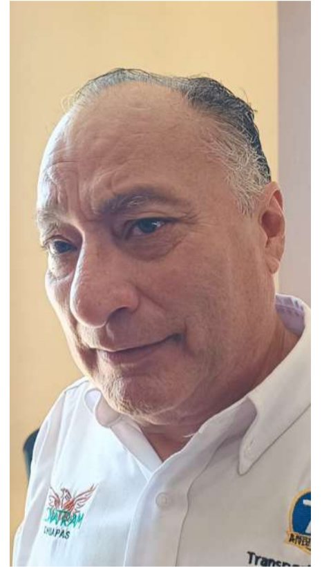
Acción coordinada permitió ubicar un tractocamión sustraído