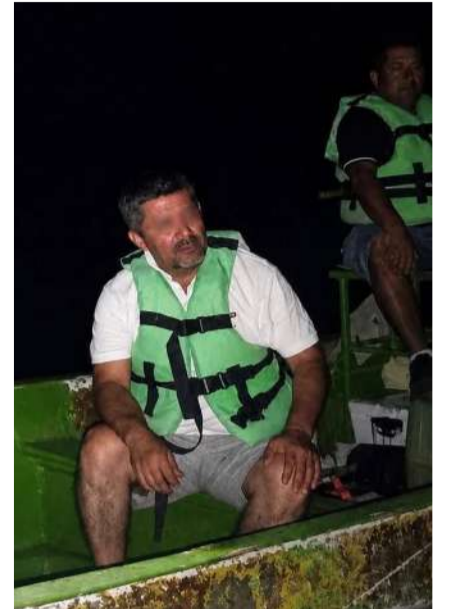
Se pone a salvo a navegante tras incidente en Cahuaré

Una vez concluido el operativo, tanto el ocupante como la embarcación fueron puestos a sal-