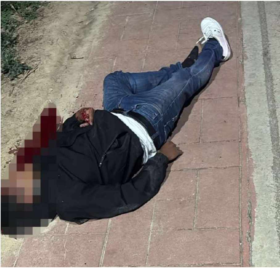
Perdió la vida minutos después de ingresar al Hospital