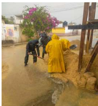
Corporaciones atienden incidencias tras intenso temporal

“Las fuertes lluvias registradas pusieron a prueba la capacidad de respuesta de nuestro municipio, desde los primeros reportes, el personal de la Secretaría de Protección Civil se movilizó