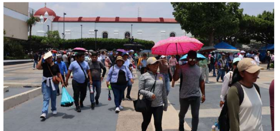
Docentes instalaron carpas frente a Palacio de Gobierno

El dirigente sostuvo que las demandas del magisterio son legítimas y recordó que la eliminación de las reformas cuestionadas formó parte de compromisos asumidos