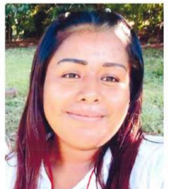
Brigadas especializadas mantienen recorridos en la región Costa

Dentro de las acciones de campo, se mantienen activas brigadas de búsqueda en distintas zonas de la región. Durante las últimas horas, un grupo de búsqueda se tras-