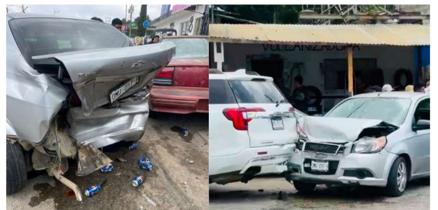
Tres unidades colisionaron en la entrada del municipio

Hasta el momento no se ha determinado quién fue el responsable del accidente. Sin embargo, conforme a los usos y costumbres de San Juan Chamula, los involucrados acordaron el pago de una multa, mientras se resolvía la situación derivada del percance.