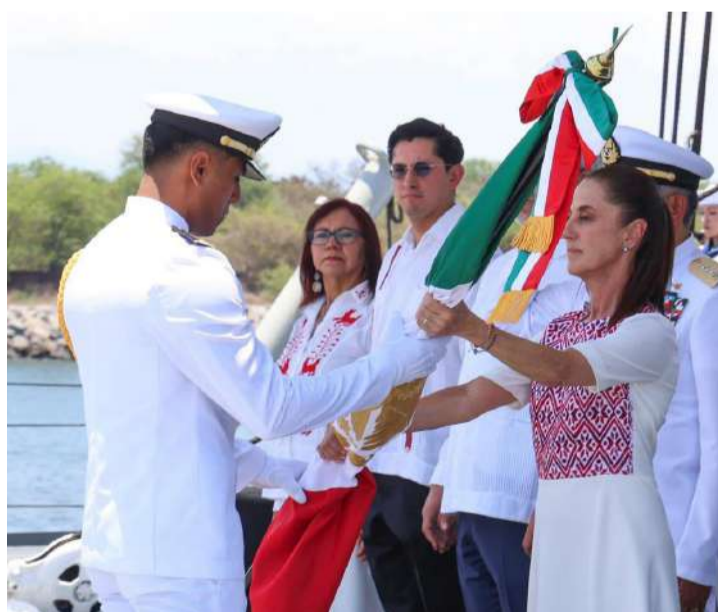
Fueron abanderadas 18 embarcaciones

Sheinbaum resaltó que la Marina no solo cumple tareas de vigilancia y defensa en costas y mares, sino