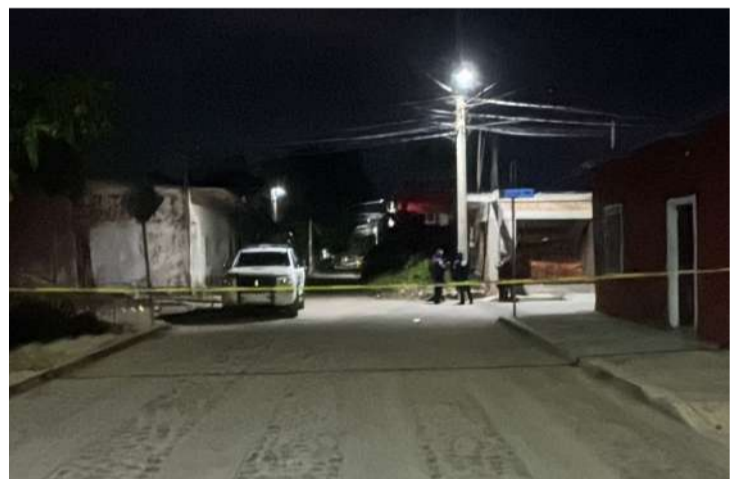
Sujetos armados siguieron una unidad particular y abrieron fuego en plena vía

Peritos y agentes de investigación fueron notificados para iniciar las diligencias correspondientes y recabar evidencias que permitan esclarecer lo ocurrido. Entre las líneas de investigación se encuentra un posible intento de ho-