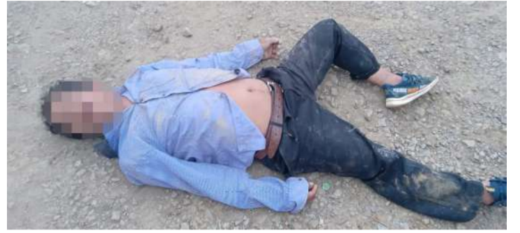
Presuntos implicados escaparon tras el incidente

“Aquí en la comunidad se firmó un acta de acuerdo entre autoridades comunitarias donde se prohibió la venta de bebidas embriagantes, nunca se respetó, porque mucha gente consumen el posh, principalmente hombres de la localidad,