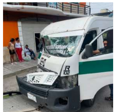
Unidad de pasajeros chocó contra un vehículo estacionado

La mañana de este lunes se registró un aparatoso accidente de tránsito en la colonia Patria Nueva, donde un colectivo de la ruta 102-10 se impactó contra una camioneta estacionada, dejando como saldo varias personas lesionadas, cuantiosos daños materiales y al conductor detenido.