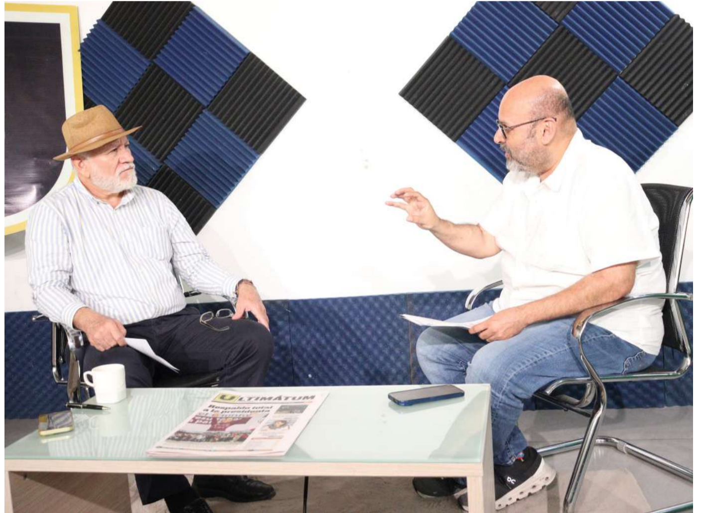
La mesa de trabajo reúne a representantes de municipios, empresarios y especialistas para impulsar acciones de atención, acompañamiento y protección a menores de edad

En ese sentido, consideró indispensable cuestionar las acciones que actualmente se realizan para garantizar la seguridad y el bienestar de niñas, niños y adolescentes.