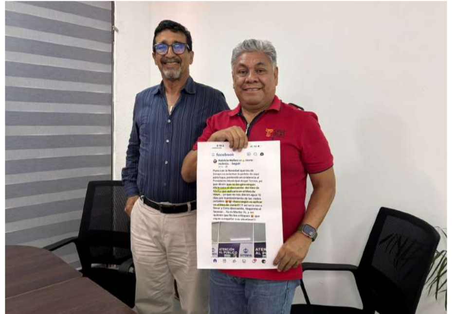
El regidor señaló que la administración debió actuar de manera preventiva ante la escasez de agua