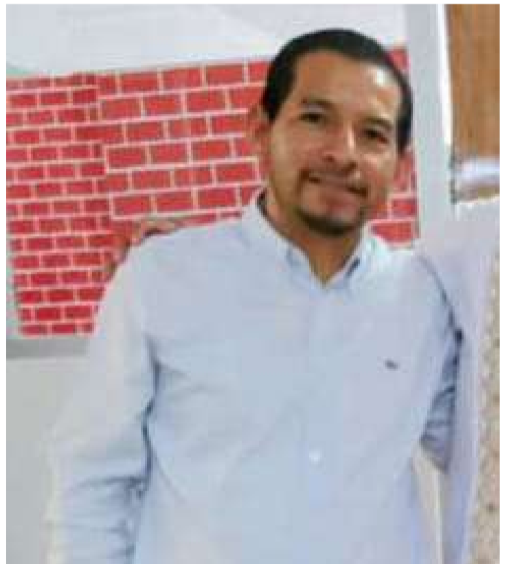
Ciudadanos efectuaron trabajos emergentes para reducir afectaciones

Finalmente, aseguran que existen otras problemáticas similares en diferentes comunidades y barrios del municipio, por lo que hicieron un llamado a las autoridades estatales y a la Presidencia del Congreso del Estado para que intervengan y brinden atención a las necesidades de la población, porque el pueblo de