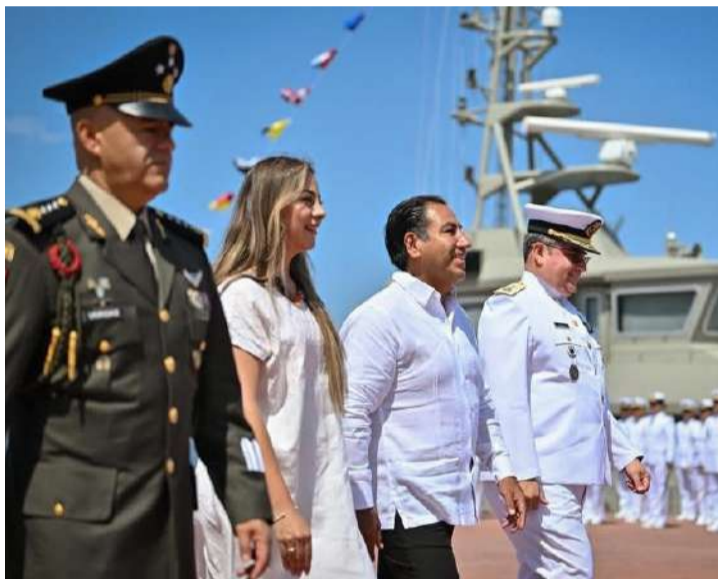
La conmemoración reunió a autoridades federales, estatales y municipales

El mandatario estuvo acompañado por el comandante de la 22 Zona Naval Puerto Chiapas,