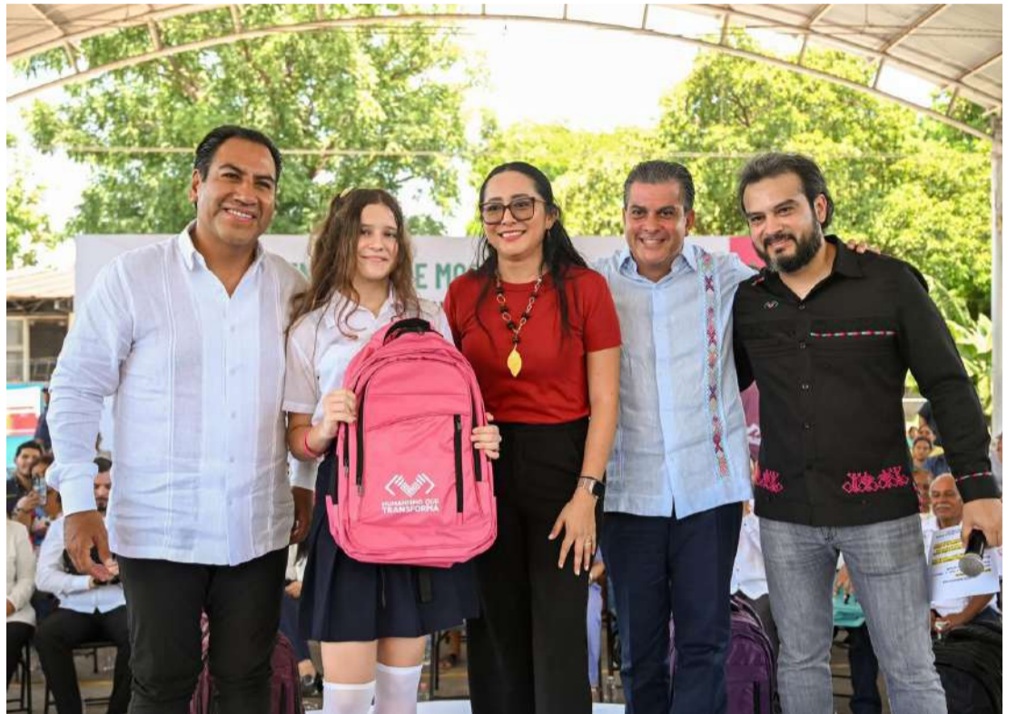
El mandatario visitó por primera vez en su historia la Escuela Secundaria del Soconusco, fundada en 1971