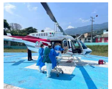
Personal médico y de Protección Civil coordinó el operativo de emergencia

Autoridades de salud destacaron que este tipo de acciones reflejan la coordinación interinstitucional para acercar servicios médicos especializados a la población, especialmente en casos donde cada minuto resulta determinante para preservar la vida de los pacientes más vulnerables.