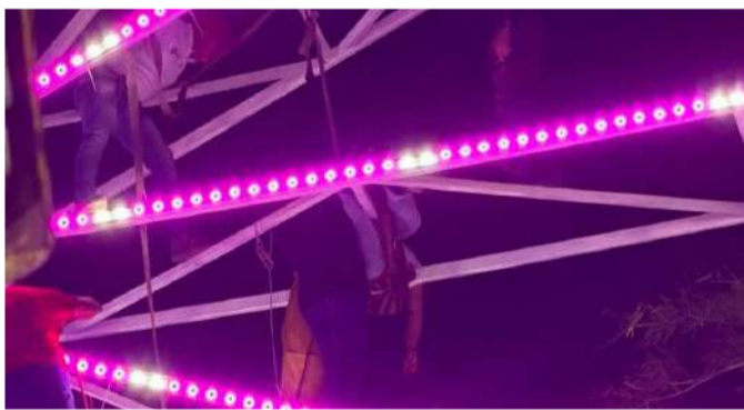
Quedaron suspendidas en la estructura

Tras varios minutos de intensos trabajos, las dos mujeres fueron rescatadas y posteriormente trasladadas a una instancia médica para su valoración. Autoridades informaron que presentaban diversos golpes y contusiones, aunque ninguna lesión ponía en riesgo su vida.