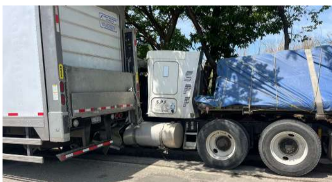
No hubo pérdidas humanas