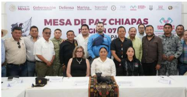
El alcalde de Pantepec reiteró su respaldo a la familia

En la reunión participaron autoridades encargadas de la procuración de justicia y seguridad pública, quienes revisaron los avances de las labores implementadas desde el reporte de la desaparición. El edil destacó la importancia de mantener la coordinación institucional para garantizar la continuidad de los operativos.