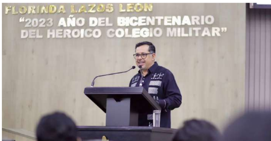
Juventudes impulsan ideas en favor de la naturaleza chiapaneca

Durante el encuentro los participantes debatieron sobre el cuidado del agua y la protección de recur-