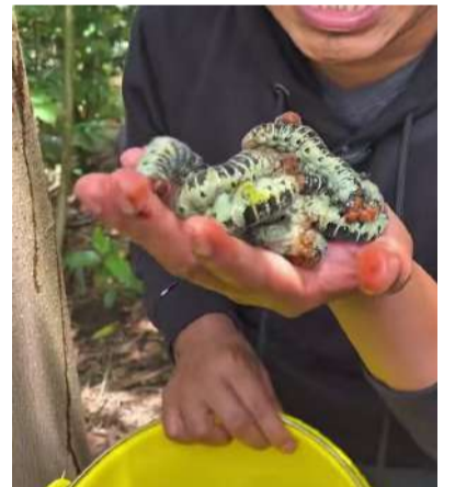
La tradicional oruga sorprendió al brotar semanas antes de su ciclo habitual

Pobladores señalaron que los ejemplares ya pueden verse