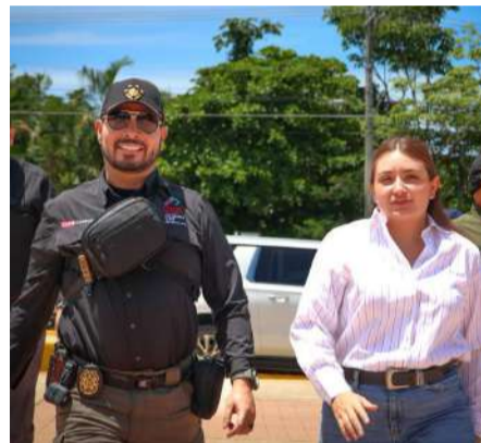
Consolidan acuerdos para fortalecer la movilidad regional

tados obtenidos en materia de seguridad y conectividad carretera, señalando que las estrategias impulsadas por el gobierno estatal han contribuido a generar mayor confianza entre la población y mejores