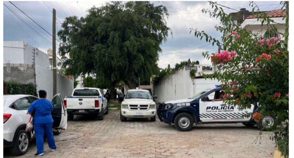
La víctima habría huido de un inmueble donde permanecía retenida

ciaron las diligencias correspondientes para ubicar el sitio del que supuestamente escapó el afectado y establecer si existen otras personas involucradas en este caso.