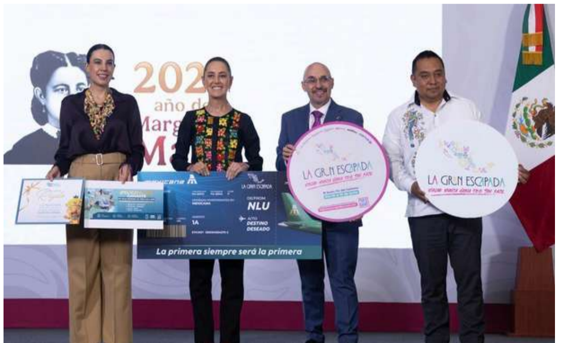
Seis ganadores recibirán vuelo en Mexicana, Tren Maya y hospedaje en hoteles del Mundo Maya como parte de La Gran Escapada 2026

La secretaria de Turismo, Josefina Rodríguez Zamora, señaló que La Gran Escapada 2026 ofrece 114 mil experiencias turísticas, un 5 por ciento más que en 2025, con 6 mil 577 establecimientos registrados, un crecimiento del 12.7 por ciento respecto al año ante-