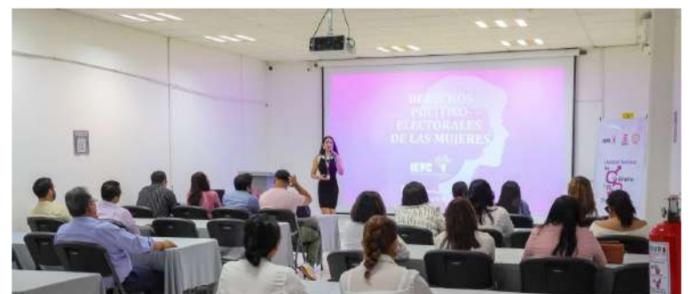
El IEPC y organizaciones civiles promovieron una jornada formativa

En la jornada participaron integrantes de partidos políticos, personal del organismo electoral y representantes de agrupaciones ciudadanas, quienes coincidieron en la necesidad de continuar impulsando condiciones de igualdad que permitan una mayor presencia femenina en los procesos democráticos rumbo a los próximos comicios.