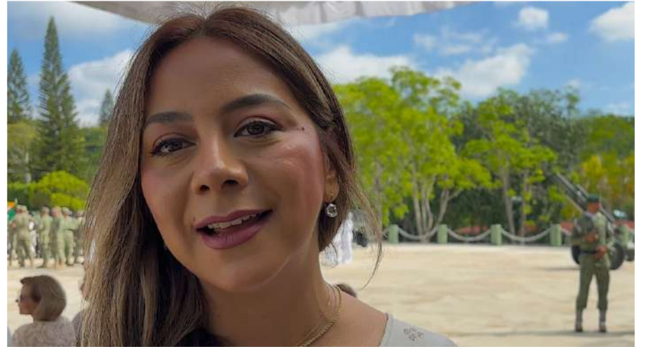
Gómez Mendoza evitó confirmar sus propias aspiraciones para 2027

Indicó que el proyecto de la Cuarta Transformación apuesta por el contacto directo con la población