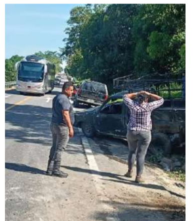
La víctima sufrió traumatismo craneoencefálico severo

Un hombre de 34 años de edad resultó con lesiones de extrema gravedad luego de un aparatoso percance ocurrido la mañana de este jueves sobre el tramo carretero Mapastepec-Tapachula, a la altura de los kilómetros 192 al 194, en dirección hacia Tapachula.