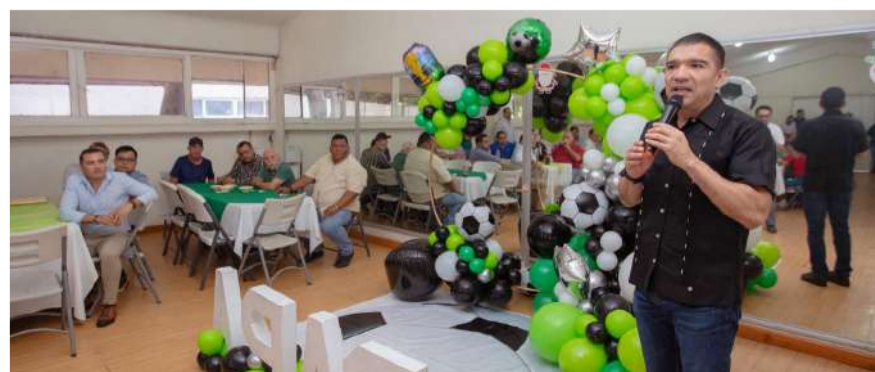
Destacan su labor en el hogar y su vocación de servicio hacia la derechohabiente

Asimismo, señaló que el trabajo, la responsabilidad y la vocación que distinguen a los padres trabajadores representan un pilar fundamental para el desarrollo de la institución, por lo que refrendó su reconocimiento a quienes diariamente entregan su esfuerzo dentro y fuera de sus centros de trabajo.