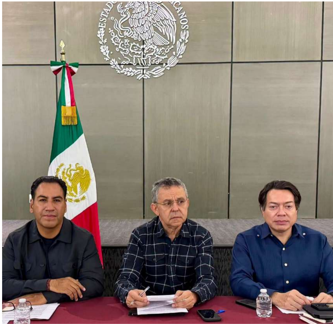
Marcó un punto de diálogo institucional entre el gobierno estatal, la SEP federal y el magisterio disidente de Chiapas

La reunión se llevó a cabo en las instalaciones de la Secretaría de Gobernación, en la Ciudad de México, con la participación del subsecretario de Gobernación, César Yáñez Centeno; el secretario de Educación Pública, Mario Delgado Ca-