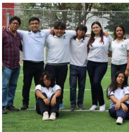
Amber Particles, único equipo mexicano entre los 50 mejores del concurso de la CERN

tigación, Amber Particles alcanzó la Shortlist 2026, reconocimiento reservado para las 50 iniciativas escolares más sobresalientes a nivel global.