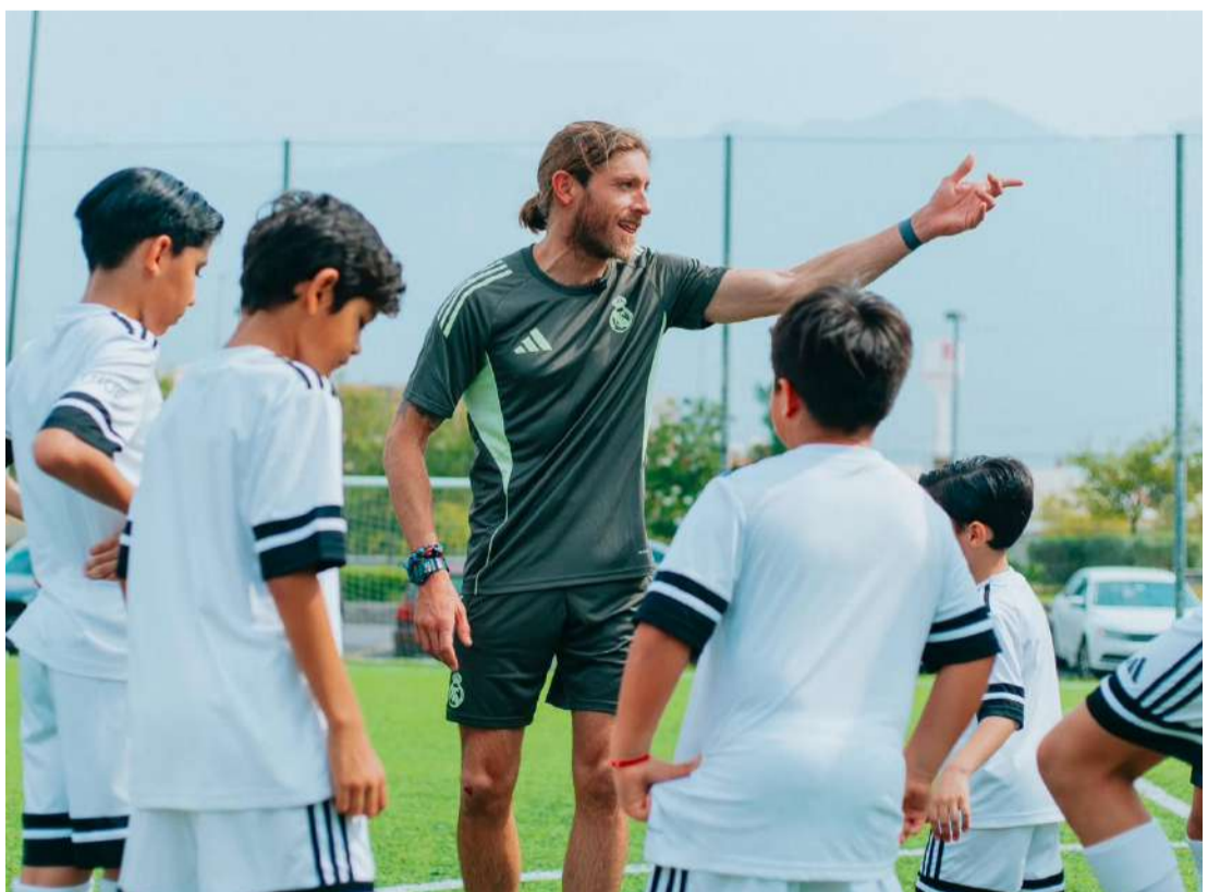
Verano futbolero internacional con experiencia educativa

TRUE Sports reiteró que esta actividad no corresponde a visorias, pruebas deportivas ni mecanismos de selección para inte-