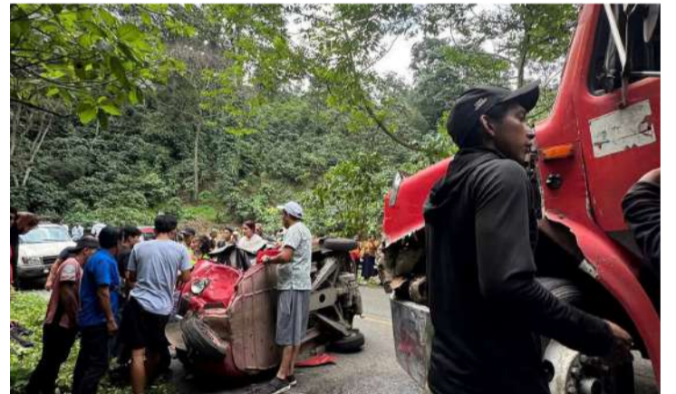
La unidad ligera terminó prácticamente destruida tras el impacto

daños severos tras el impacto, mientras que el camión de volteo permaneció en el lugar hasta la intervención de las autoridades.