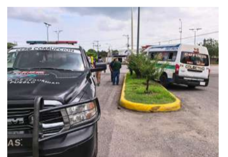
El operador logró controlar la situación al maniobrar la unidad

la Policía Municipal y de la Guardia Vial Preventiva, quienes brindaron apoyo para controlar la circulación vehicular y verificar las condiciones en que ocurrió el incidente.