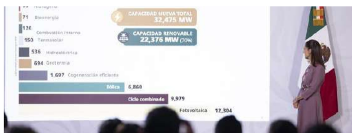
El proyecto busca reducir emisiones, fortalecer la soberanía energética y atraer inversión pública y privada

La presidenta subrayó que el desarrollo tecnológico y la reducción de costos en la generación renovable han convertido a estas fuen-