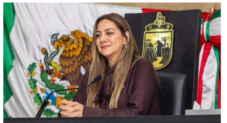
Declararon el día 24 de noviembre de cada año como el Día del Café Chiapaneco

el que se declara el día 24 de noviembre de cada año como el Día del Café Chiapaneco.