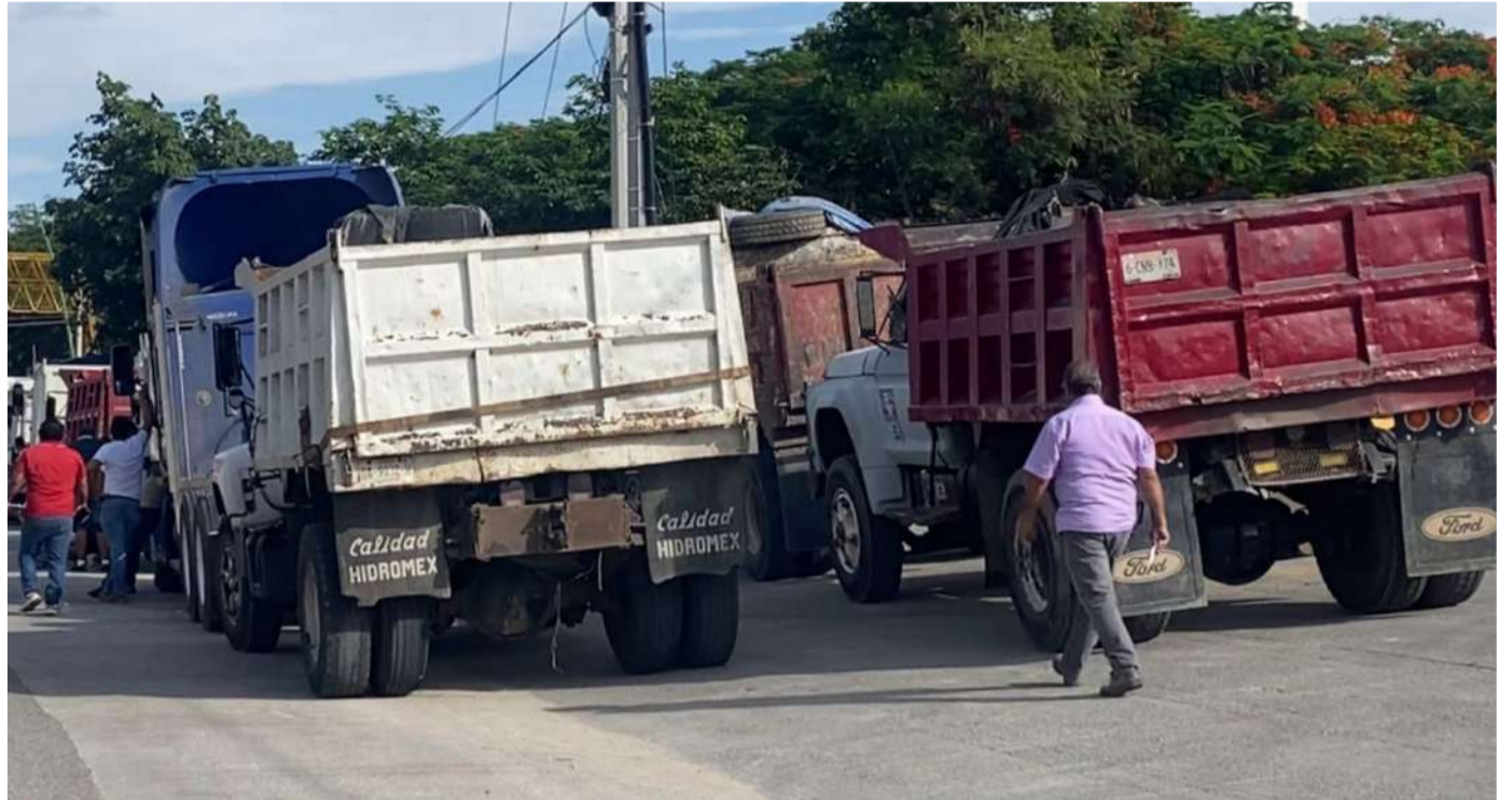
Fue una jornada nacional para denunciar la falta de atención a sus demandas

“Siempre hemos sido respetuosos de la ciudadanía y del libre tránsito, no buscamos afectar a terceros, pero sí manifestar nuestra inconformidad ante el golpeteo que enfrenta el pequeño transportista”,