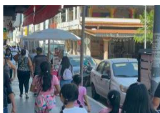
Miles de solicitudes de asilo saturan la frontera sur

go a Tapachula y lleva 33 firmas y espera del correo que le permita realizar una entrevista grabada y posteriormente verificar si es positiva o negativa.