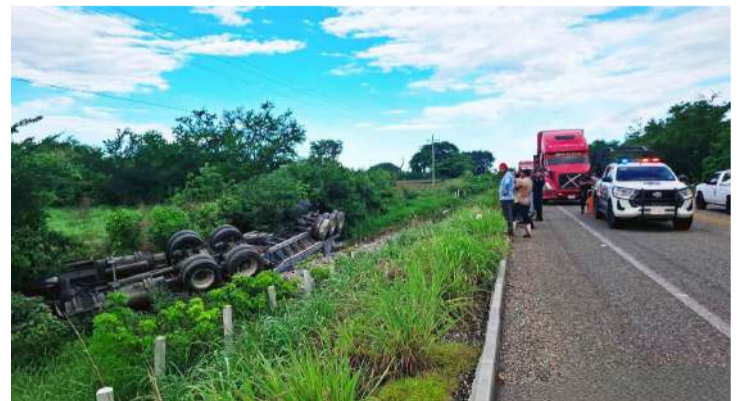
No hubo heridos de gravedad

Se prevé que en las próximas horas se realicen