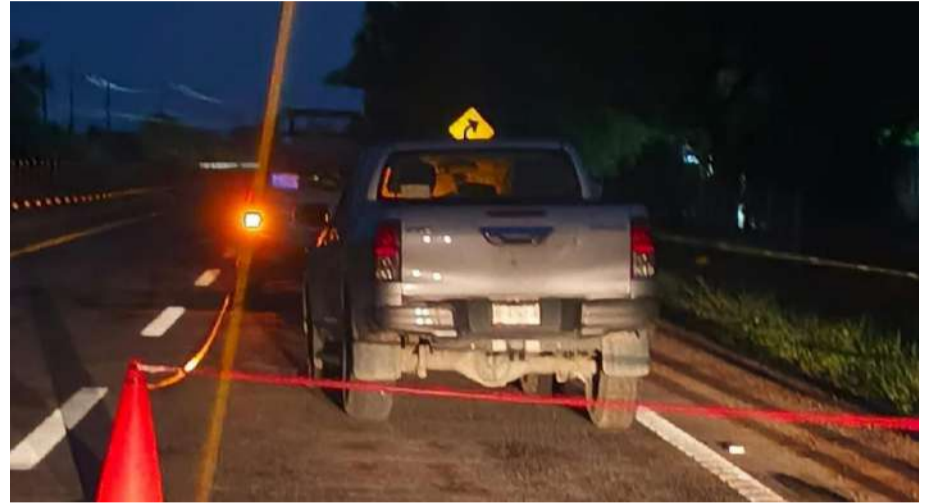
Hasta ahora no existen detenciones

Durante el operativo de seguridad, se reportó además la supuesta