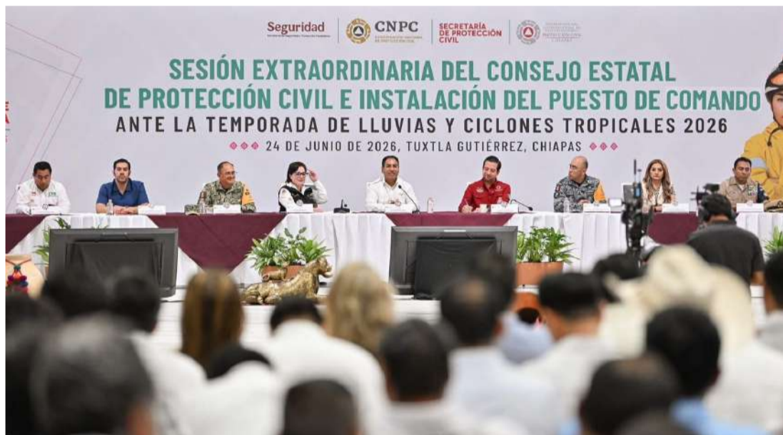
Gobierno y federación activan estrategia conjunta de respuesta

plementadas sobresale el programa de restauración de microcuencas, que durante 2025 se desarrolló en 33 municipios y que este año busca extenderse a 70 localidades. Además, se realizaron trabajos en sistemas lagunarios del Soconusco e Istmo-Costa para fortalecer la actividad pesquera y disminuir afectaciones derivadas de fenómenos meteorológicos.