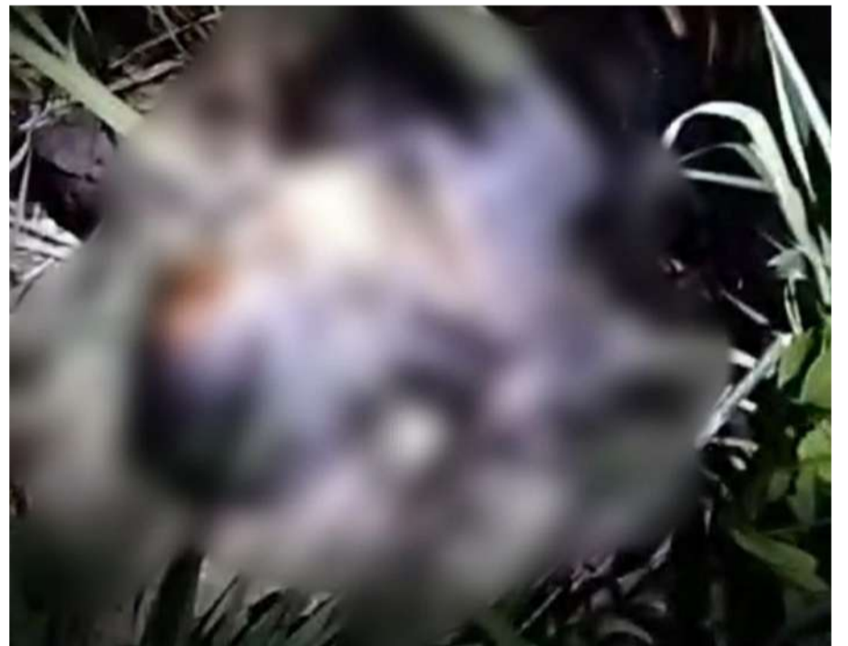
La Fiscalía inició las indagatorias correspondientes