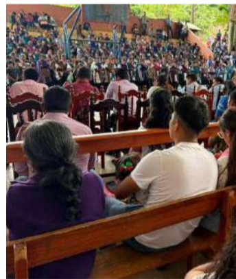
Diversas iglesias se reunieron para promover convivencia

“Nos complace y que se lleve a cabo reunión con la Sociedad Bíblica de México A.C. con el único propósito principal para conformar una lista a quienes deseen obtener Biblias Gratuitas en beneficio a todos los fieles creyentes en otorgarle esta regalía de fe, fueron invitados las 46 comunidades de iglesias, con un solo propósito de creer en Dios, aceptar su exis-