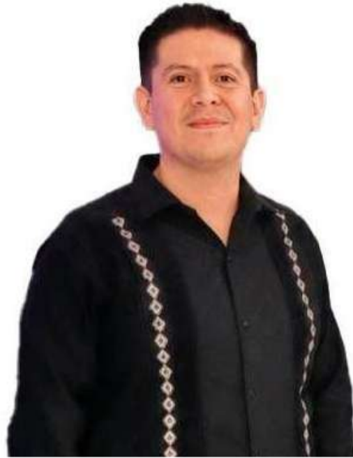
Acepta investigaciones con pruebas y rechaza acusaciones en redes

■ El secretario técnico de la Secretaría de Educación de Chiapas, afirmó que las acusaciones difundidas en redes carecen de sustento