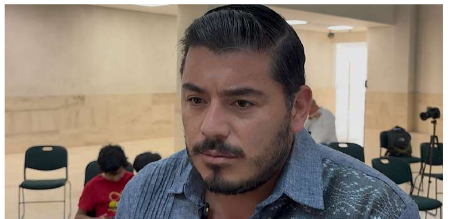
Señalan que hay seguimiento en las escuelas para garantizar que se concluyan los contenidos programados, luego del regreso a clases tras el paro de la CNTE

Asimismo, detalló que durante el periodo del paro también se implementaron mecanismos alternos de trabajo, entre ellos actividades digitales y otras estrategias para evitar rezagos.