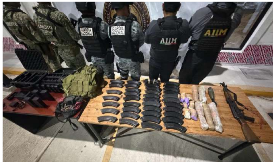
Elementos del Ejército Mexicano y la Guardia Nacional aseguraron seis granadas, 39 cargadores y una camioneta Ford Lobo

Todo el material fue trasladado a las instalaciones de la Fiscalía General del Estado en Tuxtla Gutiérrez, donde quedó a disposición del Ministerio Público para la integración de la carpeta de investigación