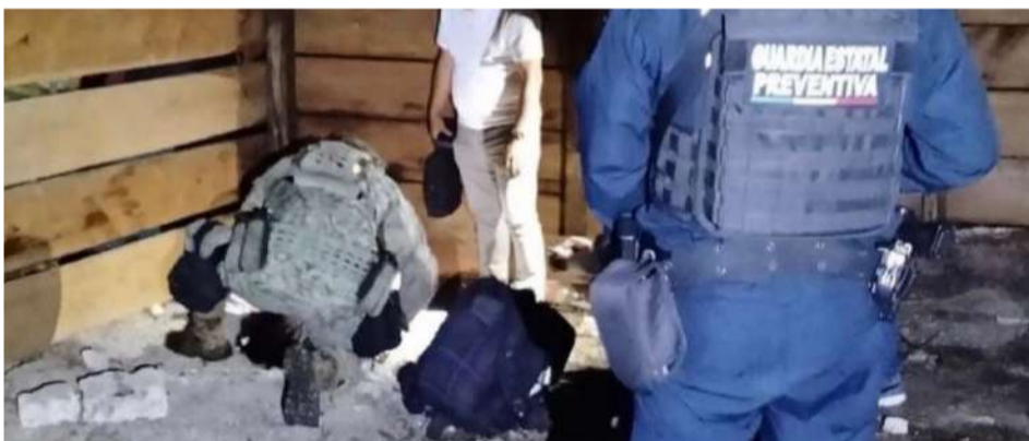
No hubo pérdidas humanas

señalaron que los resultados definitivos se darán a conocer una vez concluido el proceso de inspección pericial.