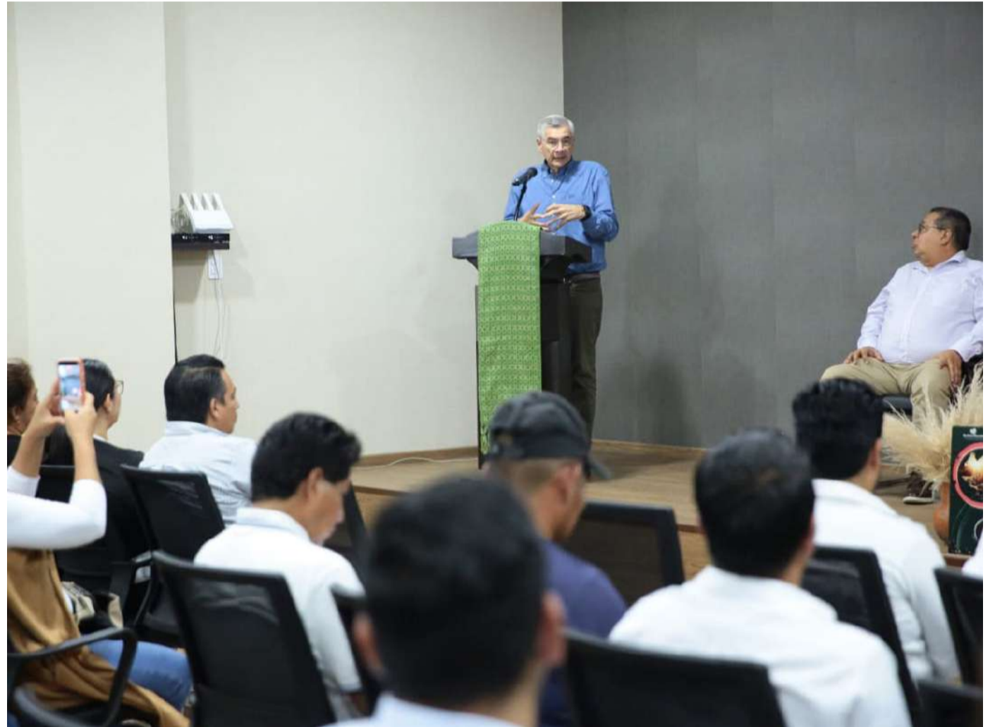
El foro reunió a empresarios y organizaciones vinculadas a la cafeticultura

Este encuentro -dijo- nos permitió compartir ideas, experiencias y reflexiones sobre el presente y el futuro del café chiapaneco, reconociendo el esfuerzo de quienes, día con día, trabajan para mantener viva esta tradición que genera empleo, desarrollo y orgullo para