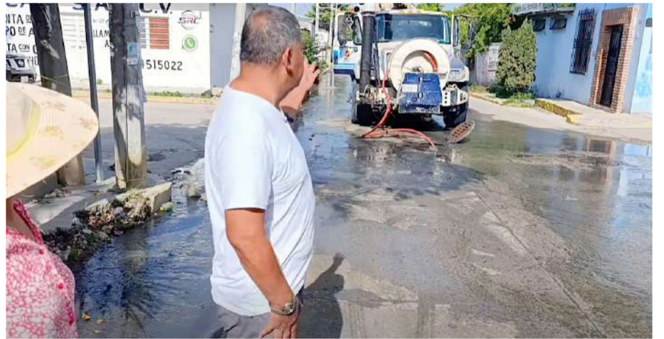
El descuido ha generado condiciones de insalubridad que afectan viviendas y establecimientos comerciales de la zona

Los habitantes manifestaron preocupación por las condiciones de insalubridad que, aseguran, ya afectan la vida cotidiana de quienes habitan y trabajan en la zona, además del riesgo de exposición a enfermedades derivadas del contacto