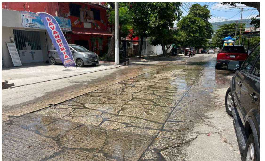
Acusaron que los registros obstruidos representan un riesgo sanitario y afectan la actividad comercial de la zona

Los habitantes afirmaron que el derrame constante de aguas residuales ha generado focos de infección que representan un riesgo para la salud pública. Asimismo, comerciantes del sector aseguraron que la afluencia de clientes ha dis-