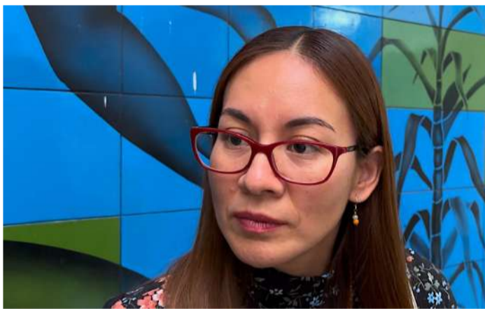
La presidenta municipal reveló irregularidades en la corporación policiaca

Mientras se fortalece la plantilla, la Fuerza de Reacción Inmediata Pakal (FRIP) mantiene presencia en el municipio desde el pasado 23 de febrero, realizando labores de vigilancia en coordinación con la