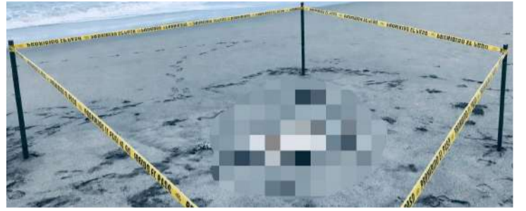
Fue encontrada en estado avanzado de descomposición

■ Autoridades confirmaron que el fallecimiento ocurrió por ahogamiento y rechazaron versiones sobre un supuesto cuerpo embolsado. La identidad permanece sin establecerse