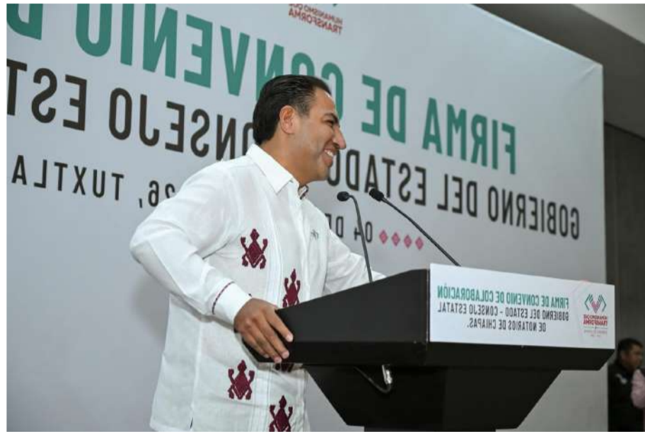
Reducirá costos y tiempos en trámites notariales