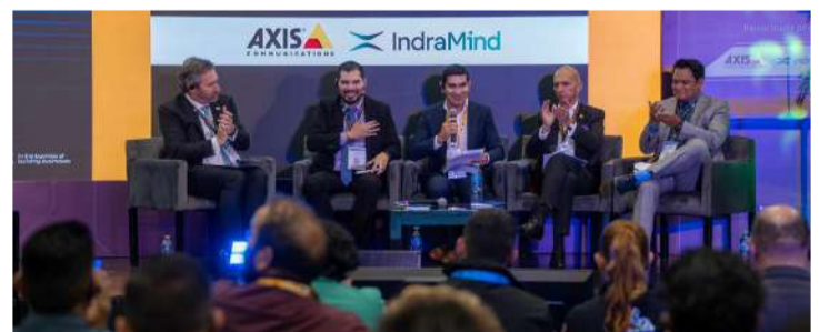
Chiapas expone estrategia tecnológica de seguridad en foro internacional

Asimismo, explicó que el uso de cámaras, monitoreo inteligente, drones y equipamiento especializado ha fortalecido las labores de seguridad, complementadas por la actuación del grupo Fuerza de Reacción Inmediata Pakal (FRIP). En el encuentro también participaron representantes de organismos de seguridad y empresas especializadas de México y América Latina.