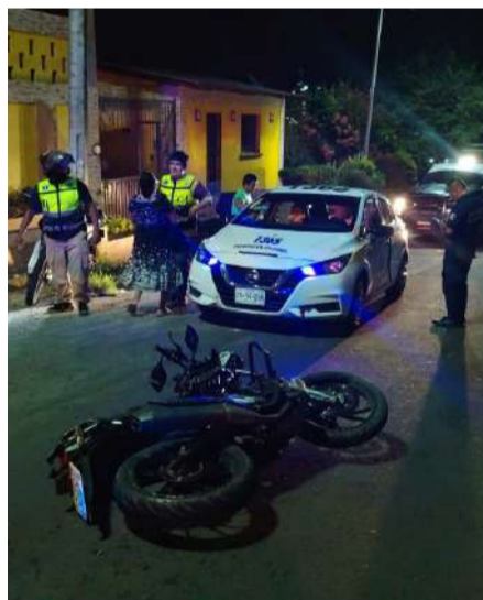
La víctima fue llevada a una unidad médica

Un motociclista resultó lesionado la noche del martes tras verse involucrado en un presunto choque frontal contra una unidad del transporte colectivo sobre la carretera que conecta a Tapachula con el ejido 20 de Noviembre, a la altura de la colonia El Porvenir. De acuerdo con testigos, el conductor del vehículo de pasajeros habría invadido el carril contrario, provocando el impacto.