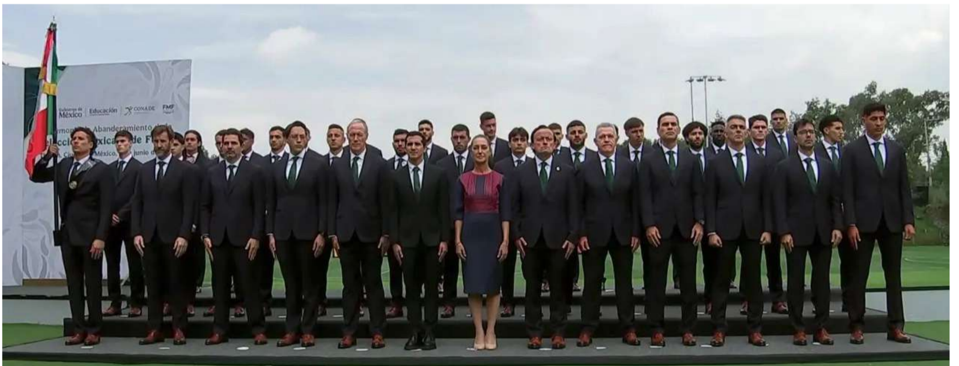
La presidenta entregó la Bandera Nacional a Guillermo Ochoa

“Encomiendo a su patriotismo esta bandera, que simboliza su independencia, el honor, las instituciones, nuestro pueblo y la integridad de su territorio. ¿Protestan honrarla y defenderla con lealtad y constancia? —Integrantes de la Selección Nacional de México: ¡Sí, protesto!— Al concederles el honor de ponerla en sus manos, la patria confía en que, como buenos y leales mexicanos, sabrán cumplir con su protesta por el bien del pueblo y por el bien de la nación. Que su ejemplo inspire a millones