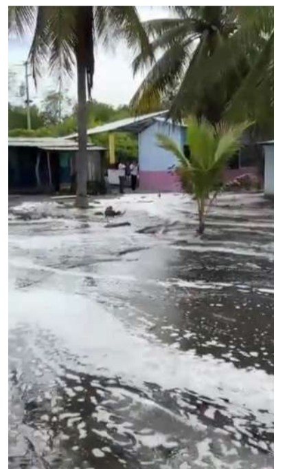
Oleaje intenso y corrientes peligrosas generan vigilancia preventiva

Ante este panorama, Protección Civil exhortó a la ciu-