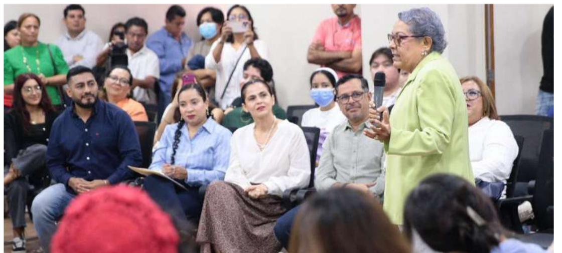
Compartieron testimonios sobre el EZLN y la matanza de Acteal