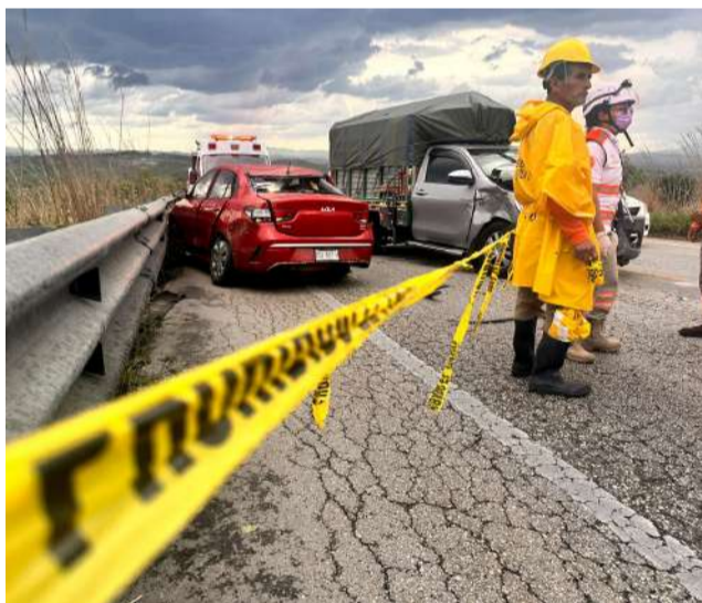
Una automovilista perdió la vida luego de invadir el carril contrario

Elementos de Protección Civil Municipal acudieron al lugar para