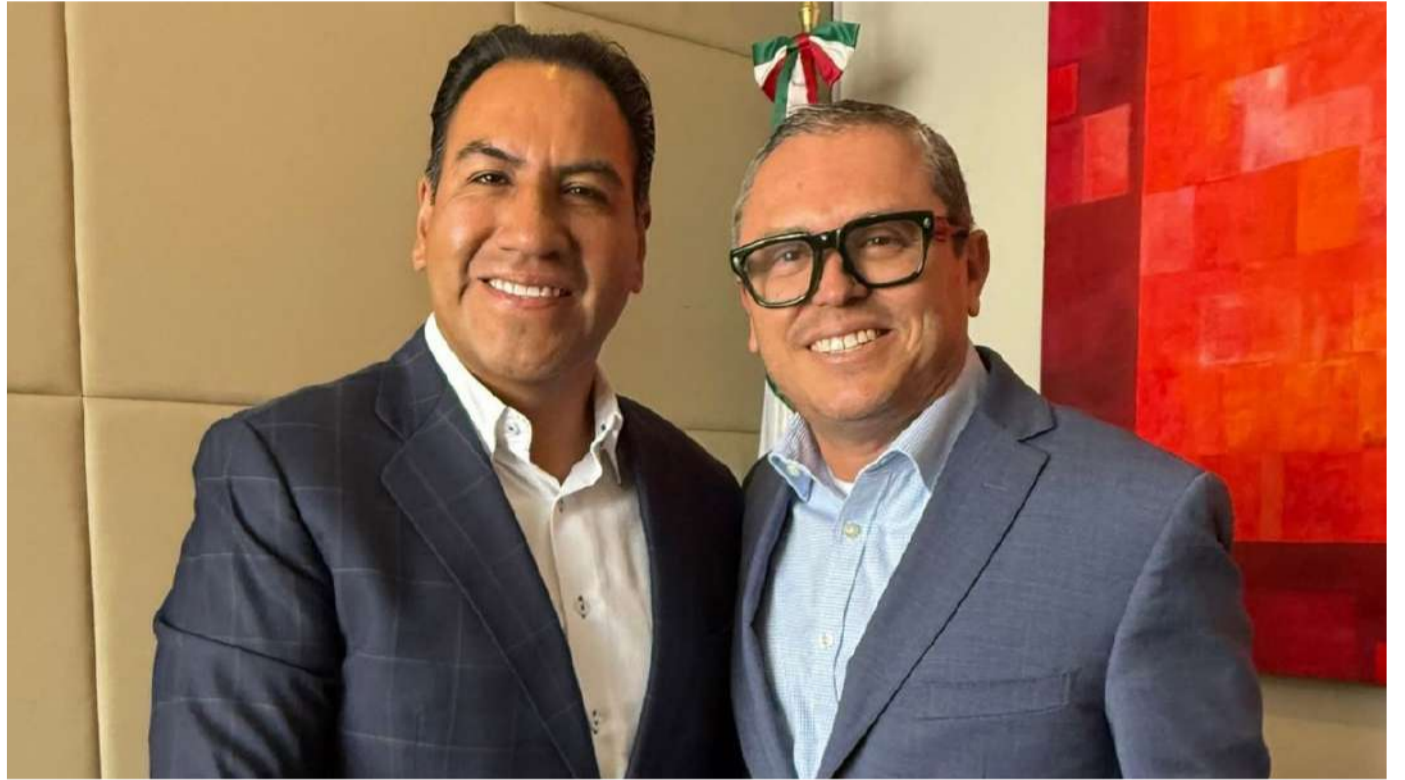
El mandatario reconoció el liderazgo del rector