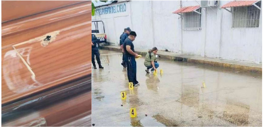
No se reportaron víctimas

Tras lo sucedido, los propietarios informaron que presentaron la denuncia correspondiente ante la Fiscalía General del Estado