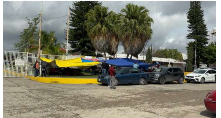
Docentes mantienen cierre indefinido en la paraestatal

Asimismo, los integrantes del magisterio chiapaneco advirtieron que no se retirarán hasta que las autoridades federales cumplan con sus demandas, entre las que se encuentran la abrogación de la Ley del ISSSTE de 2007, la eliminación del sistema de Afores para vol-