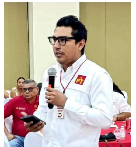
El dirigente estatal del PT, destacó avances organizativos, la integración de comités municipales y la coordinación entre entidades

Espinosa Trujillo informó que una de las prioridades inmediatas es la integración y fortalecimiento de los comités municipales, con el