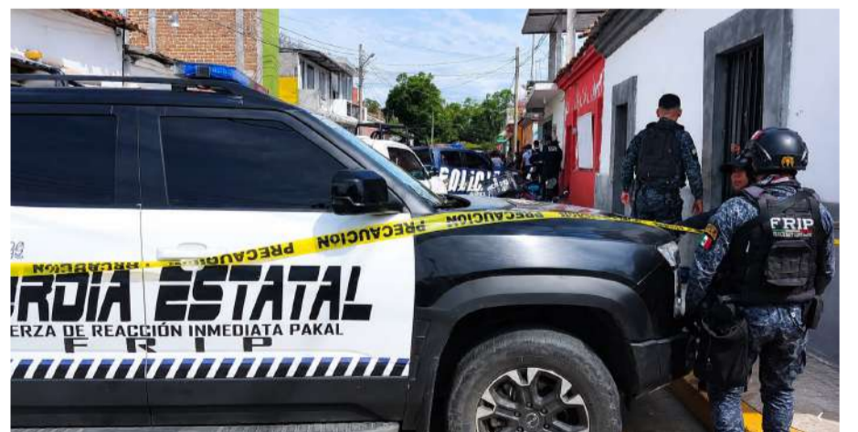
La víctima, de 17 años, fue localizada sin vida dentro de una vivienda

Más tarde, personal de Servicios Periciales de la Fiscalía General del Estado (FGE) llevó a cabo el levantamiento del cuerpo para su traslado al Servicio Médico Forense,