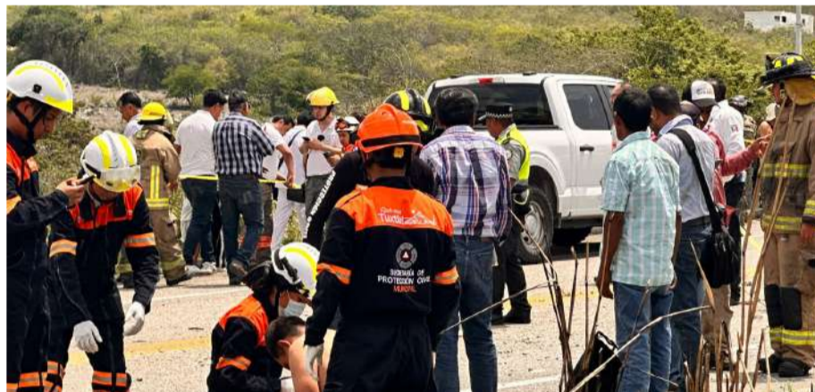
No hubo pérdidas humanas

Aunque logró impedir la colisión directa, la unidad perdió es-