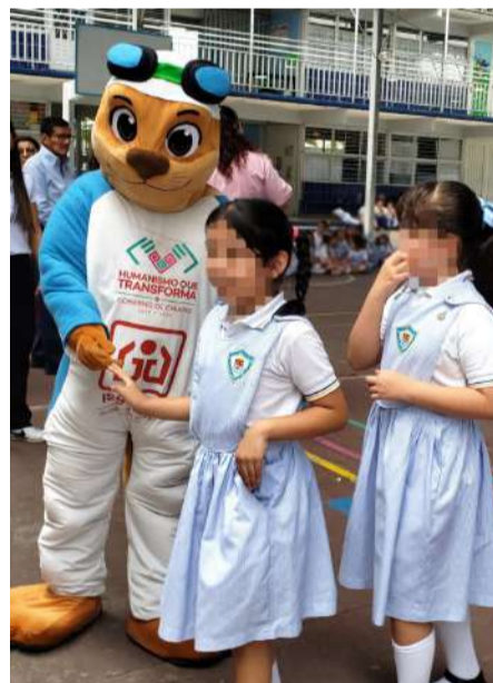
Impulsan acciones preventivas en planteles de nivel básico

Estas acciones permitieron detectar oportunamente factores de riesgo y reforzar medidas de prevención entre la comunidad escolar, contribuyendo al bienestar físico y al adecuado desarrollo de las nuevas generaciones.