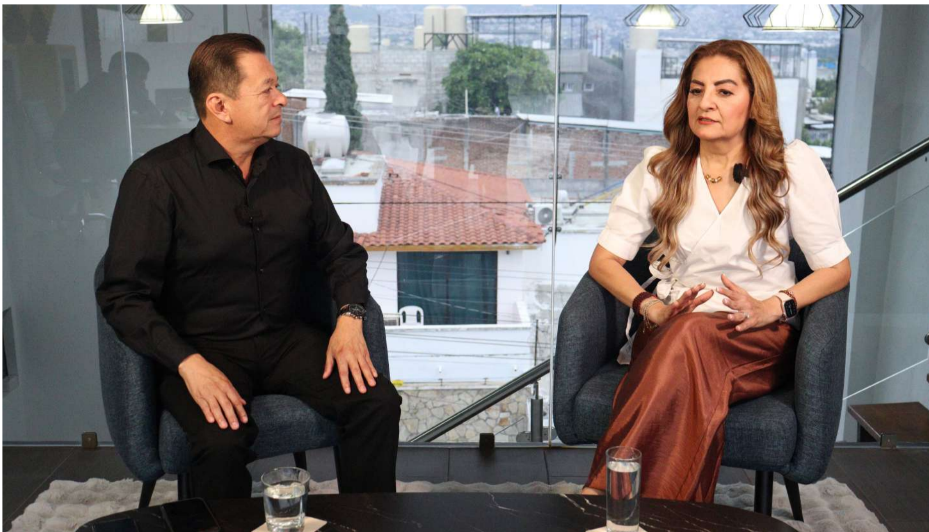
“Chiapas avanza con estabilidad, diálogo y aplicación de la ley para fortalecer la paz y la gobernabilidad”

■ “En Chiapas se aplica la ley sin distinciones. No se privilegia al amigo, al presidente municipal o al compadre. En Chiapas se ejerce la ley porque el gobernador quiere un gobierno honesto y transparente”