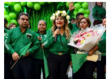
Miles de agremiados participarán el 28 de julio en una jornada de voto libre y secreto

Al acto asistieron trabajadores sindicalizados de distintas dependencias estatales, quienes respaldaron el arranque de las actividades rumbo a la jornada electoral. Durante el encuentro, integrantes de la planilla convocaron a fortalecer la unidad del gremio, impulsar la participación de la base trabajadora y recuperar una representación sólida dentro de la organización.