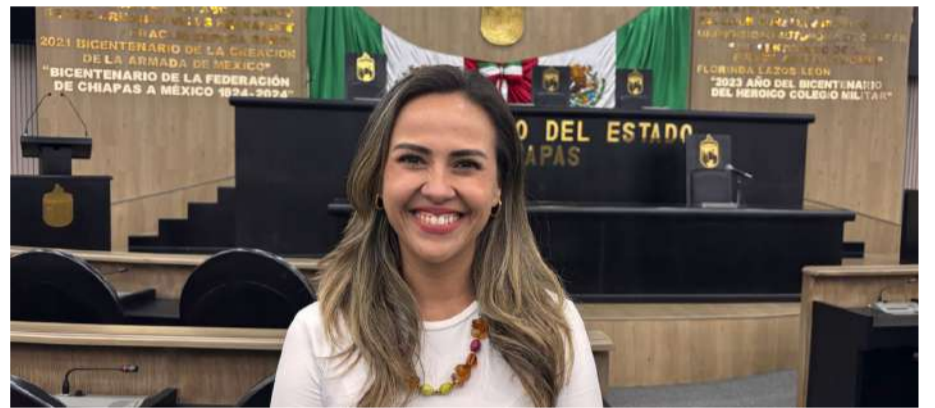
Publicación periodística detonó reacciones legislativas sobre el manejo de recursos municipales