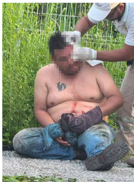
El motorista sufrió diversas lesiones tras caer sobre la carretera

Hasta el cierre de esta edición, las autoridades no habían dado a cono-