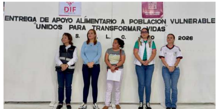
DIF Municipal impulsan acciones para fortalecer la economía familiar