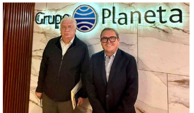
Editorial fortalecerá la oferta literaria de la feria universitaria en Chiapas

Este acuerdo contribuirá al posicionamiento de la universidad como una institución de vanguardia cultural en el sureste mexicano, consolidando a la Feria Internacional del Libro UNACH como un referente para la difusión del libro, las ideas y la creación literaria.