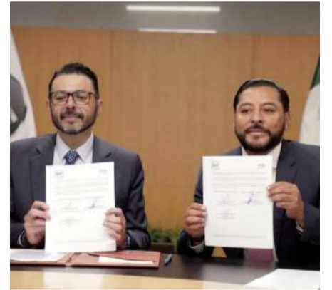
Consolidaron una alianza institucional para fortalecer la rendición de cuentas

Estas acciones forman parte de la estrategia para consolidar una fiscalización más eficaz y coordinada, garantizando que los recursos federales sean administrados con apego a la ley