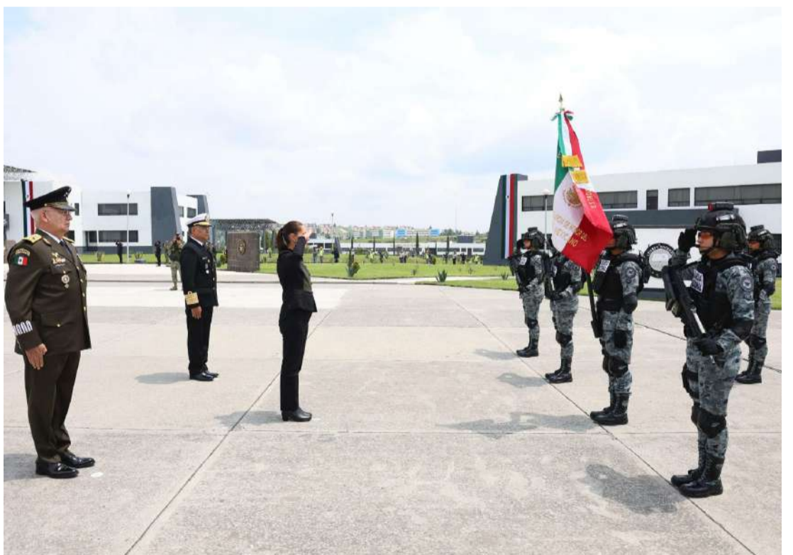
El Gobierno de México reconoció el desempeño de la corporación

La titular del Ejecutivo federal reconoció la labor cotidiana de mujeres y hombres que integran la corporación, quienes participan tanto en acciones de seguridad como en la atención de emergencias derivadas de fenómenos naturales, siempre con el compromiso de proteger la vida, el patrimonio y los derechos de la población.