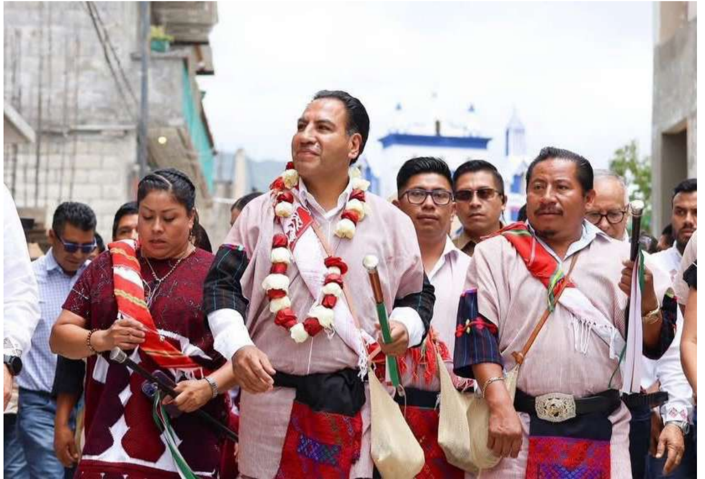
Recursos públicos financiarán proyectos estratégicos destinados a reducir rezagos históricos en la región

El olvido histórico se repara con presencia, con responsabilidad y con inversión pública puesta al servicio del pueblo. Por eso, en Chalchihuitán se avanza con una inversión de 231 millones de pesos, articulada por las dependencias del Gobierno de Chiapas, para que la prosperidad compartida se traduzca en caminos, salud, educación, alfabetización, agua, energía, campo y bienestar comunitario.