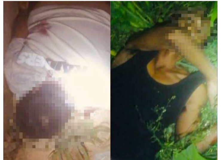
Los responsables permanecen prófugos

los responsables y llevarlos ante la justicia. En tanto, este nuevo episodio de violencia incrementó la preocupación entre los habitantes