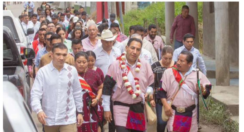
Amplían servicios con unidad médica y ambulancia

Durante la gira, el gobernador y el secretario de Salud también recorrieron los módulos instalados por los programas preventivos de salud reproductiva, salud materna y perinatal, salud bucal, vacunación, tracoma, VIH, cáncer de la mujer,