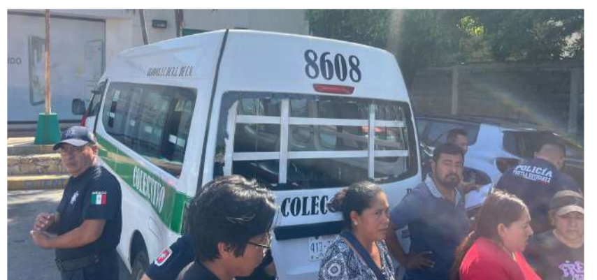
La imprudencia al volante cobra factura

Elementos de Tránsito Municipal acudieron al sitio para realizar el peritaje correspondiente y determinar las responsabilidades. Mientras se llevaban a cabo las diligencias, la circulación sobre el Libramiento Norte registró afectaciones temporales hasta el retiro de las unidades involucradas.