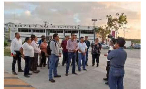
Trabajadores solicitan su reinstalación

El sindicato informó que el pasado 25 de mayo obtuvo una sentencia favorable que ordena la reinstalación del personal y el pago de las prestaciones correspondientes. Asimismo, destacó