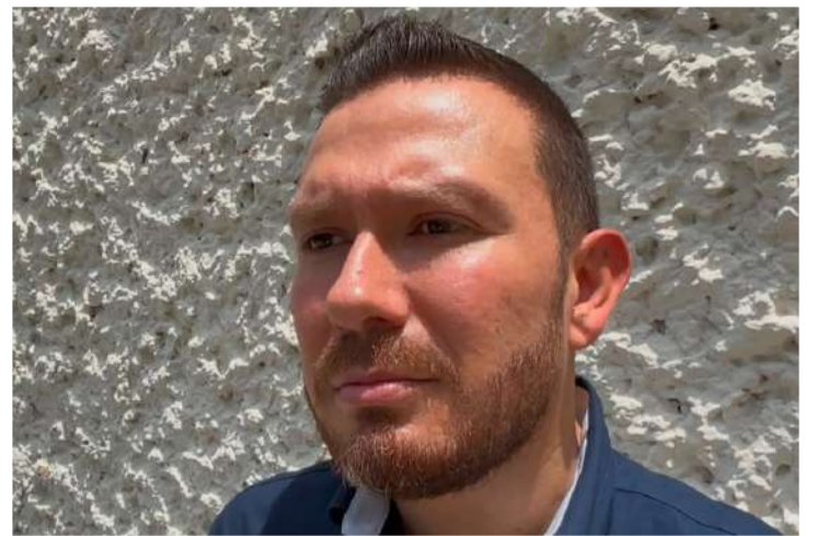
Descarta candidatura y respalda proyecto de Eduardo Ramírez