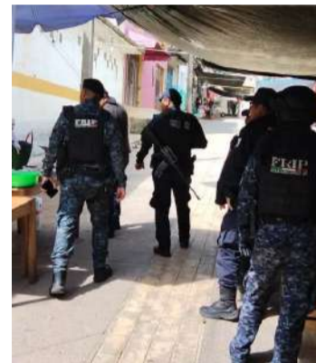
Las corporaciones estatales buscan garantizar la seguridad de las familias

Las labores de vigilancia permanecerán de manera permanente mientras continúen las estrategias de seguridad implementadas por las