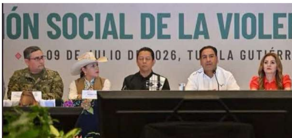
Se fortalecen 50 programas de prevención y atención humanista en favor de las familias chiapanecas

“La idea es que todos los partidos se sumen a este gran comité para garantizar que esas candidaturas sean más ciudadanas”, concluyó.