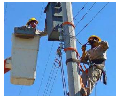
La CFE realizará trabajos de modernización este sábado

jos tendrán una duración aproximada de seis horas; sin embargo, el aviso presenta una diferencia en los horarios establecidos. En una parte del comunicado se indica que la suspensión será de 13:00 a 19:00 horas, mientras que en el apartado técnico se señala un horario de 01:00 a 07:00 horas, por lo que se exhortó a la población a mantenerse atenta a cualquier actualización oficial.