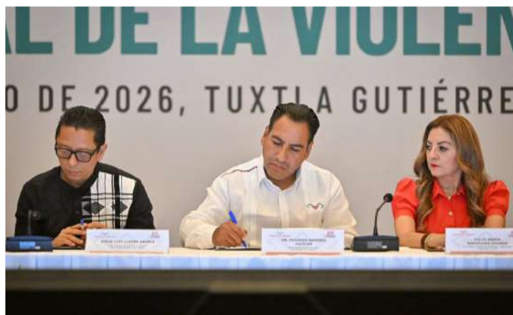
Autoridades de los tres órdenes de gobierno integraron el comité para fortalecer acciones preventivas en la entidad

■ Gobernador encabeza instalación del comité para fortalecer la prevención del delito en Chiapas