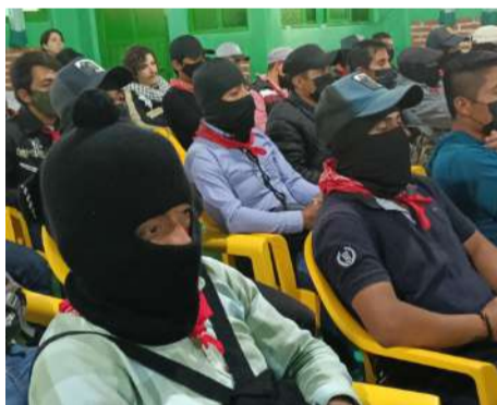
Convocan abiertamente a honrar a Jesús de la Buena Esperanza

en la historia del EZLN, al ser una de las comunidades donde se consolidó el movimiento insurgente iniciado en 1983. A unos cinco kilómetros del poblado se localiza la comunidad autónoma 17 de Noviembre , considerada un sitio emblemático por su vínculo con los orígenes del grupo zapatista.