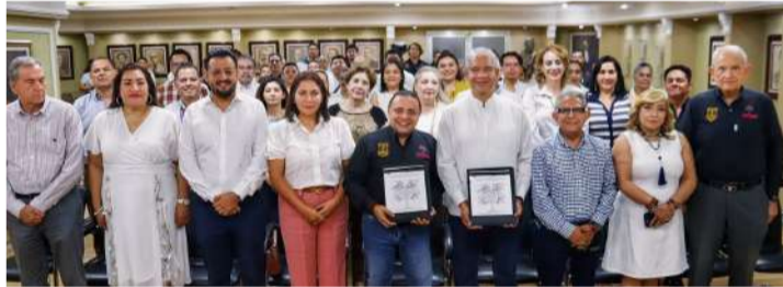
El acuerdo contempla programas de capacitación jurídica y acciones para fortalecer la cultura de la legalidad

Guillén señaló que la sociedad civil organizada tiene mucho que aportar en todos los sentidos, e impulsa a que las cosas funcionen mejor, por ello se requiere del trabajo coordinado entre las instituciones y los sectores productivos, privilegiando la capacitación y la corresponsabilidad. Destacó que este convenio con un gremio tan importante, permitirá generar sinergias que contribuyan a una mayor cohesión