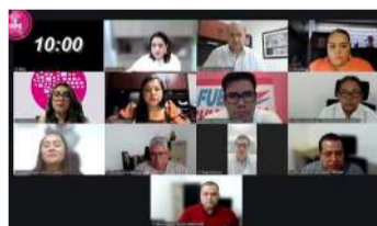
Aprueban lineamientos para integrar consejos distritales y municipales