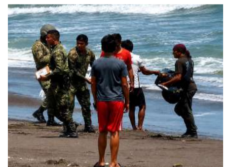
La presunta droga y los detenidos quedaron a disposición de la FGR

La presunta droga, las embarcaciones y los detenidos fueron puestos a disposición del Ministerio Público Federal, mientras que la Fiscalía General de la República integrará la carpeta de investigación para determinar el origen del cargamento, el destino que tendría y la posible estructura criminal involucrada. El