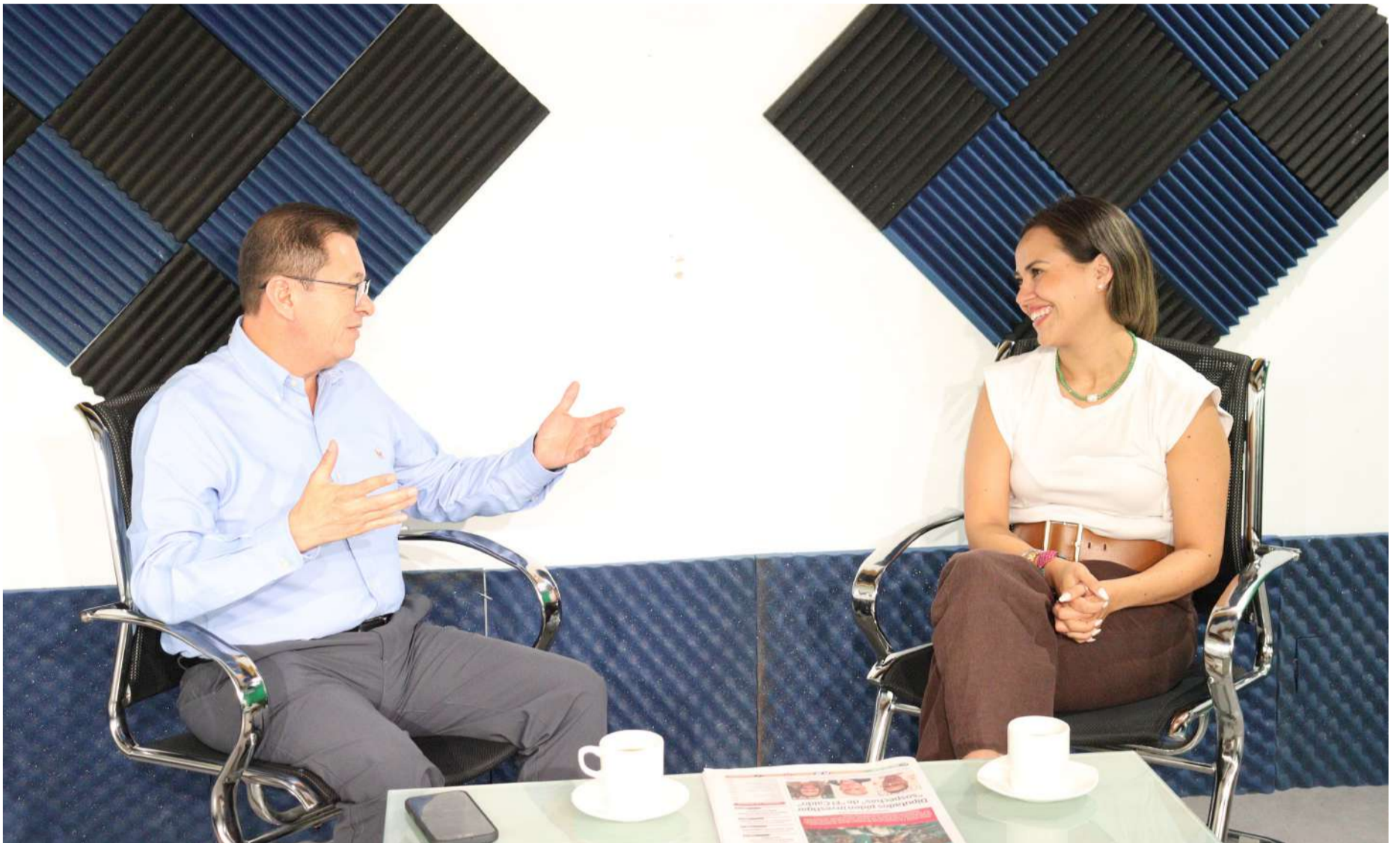
La diputada llamó a fortalecer los filtros de Morena rumbo a 2027