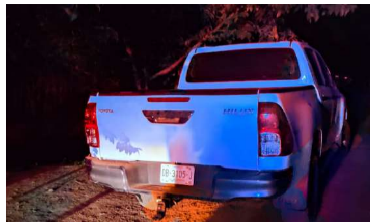
El cuerpo fue localizado sobre un camino de terracería

Durante las diligencias iniciales, las autoridades aseguraron una camioneta Toyota Hilux blanca con placas de Chiapas, localizada en las inmediaciones del crimen. Posteriormente, personal de Servicios Periciales y de la Policía de Investigación de la Fiscalía General del Estado realizó