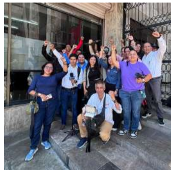
Organizaciones solicitaron medidas de protección para la víctima y su familia

Durante la concentración también se informó que se impulsará una carta abierta para