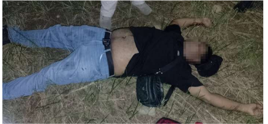
Aun no hay detenidos

no se reportaban personas detenidas ni se había establecido el móvil del homicidio.