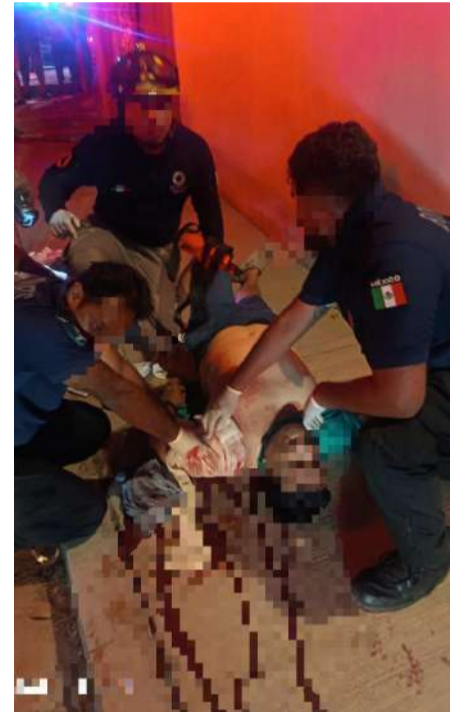
Su estado de salud se reporta estable

Hasta el cierre de esta edición, las autoridades no habían emitido un posicionamiento oficial sobre lo ocurrido ni informado sobre personas detenidas o avances en las investigaciones. Se espera que en las próximas horas se den a conocer mayores detalles sobre este hecho que mantiene en alerta al gremio periodístico en Chiapas.