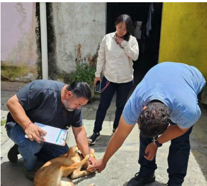
El canino permanece bajo cuidado especializado