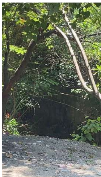
Vecinos exigen a las autoridades municipales mayor vigilancia

De acuerdo con testimonios de vecinos, personas desconocidas presuntamente han ingresado a diversas viviendas para cometer robos, incluso aprovechando que los propietarios permanecen al interior de sus domicilios, situación que ha incrementado el