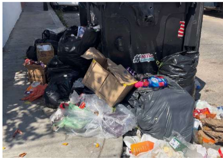
Las familias pagan pipas mientras los recibos del agua siguen llegando

Los habitantes consideraron que ambas problemáticas reflejan deficiencias