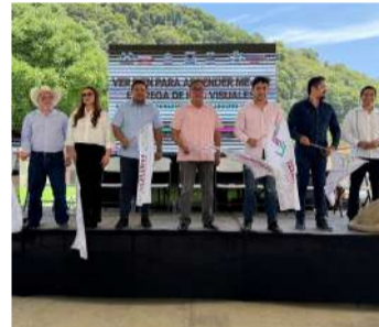
Serán valorados estudiantes de 44 planteles del municipio

Asimismo, reconoció el respaldo del gobernador Eduardo Ramírez Aguilar y