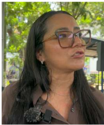
Leyendas del fútbol convivieron con estudiantes en Tapachula