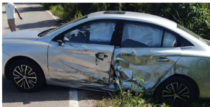
Las víctimas presentaron heridas leves

Las imágenes del percance muestran que uno de los vehículos presentó severos daños en el costado derecho tras el impacto, mientras elementos de Protección Civil y corporaciones de seguridad realizaron las labores de auxilio y control de la circulación para evitar otro incidente.