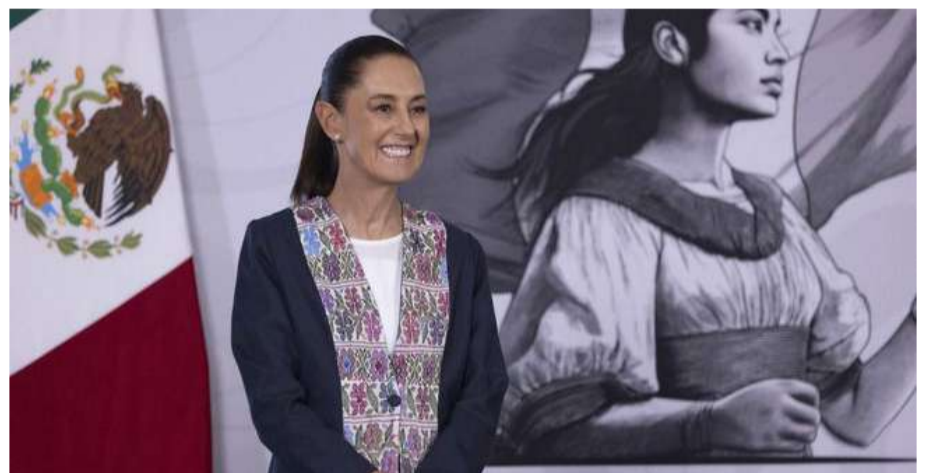
Sheinbaum afirmó que el acuerdo comercial brindará certidumbre hasta 2036

“La estrategia que está siguiendo la Presidenta Sheinbaum respec-