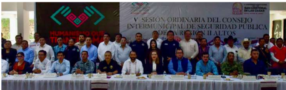
Se aprobaron acciones conjuntas para reforzar la vigilancia

Uno de los momentos más destacados fue la presencia del exfutbolista Salvador Cabañas, quien convivió con los jóvenes, firmó autógrafos y accedió a tomarse fotografías, generando entusiasmo entre los asistentes al encuentro.