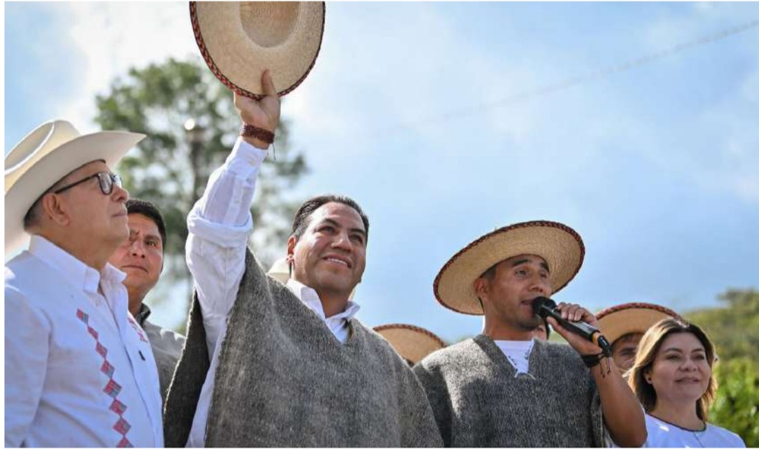
Inversiones estatales fortalecieron infraestructura pública, respaldo femenino y desarrollo educativo en localidades mezcalapas

“Nuestro compromiso es darle un nuevo rostro a Aldama. Quiero regresar en 2030 y pararnos frente