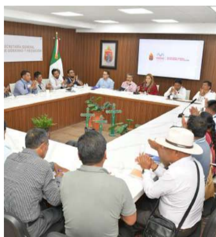
Mesa de trabajo en Oxchuc para reforzar acuerdos y paz social

Durante la mesa de trabajo se reiteró la importancia de mantener