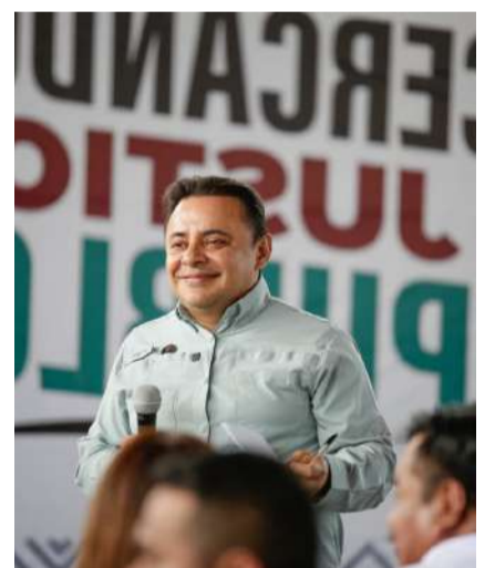
Soyaló abre puertas a la justicia itinerante

Autoridades municipales, encabezadas por el ayuntamiento de Soyaló, dieron la bienvenida a la jornada y resaltaron la importancia de llevar este tipo de acciones