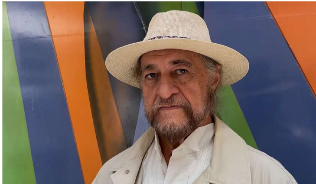
Nuevas generaciones mantienen viva la esperanza ambiental en el estado

Al ser cuestionado sobre el significado de esta distinción en un contexto marcado por desafíos ambientales y riesgos sanitarios para la fauna, como la presencia de enfermedades que afectan las especies silvestres en el ZOOMAT, señaló que actualmente el cuidado del entorno se ha convertido en una prioridad ineludible.