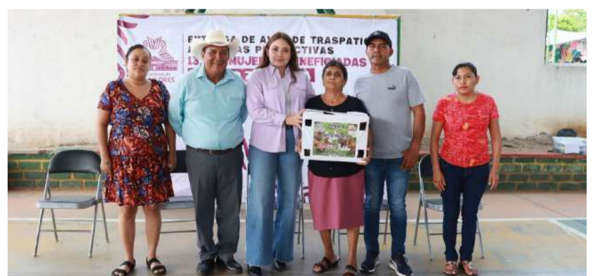
Familias reciben apoyo para producción avícola doméstica