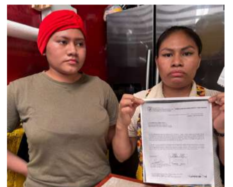
Comerciante pidió respaldo para conservar su fuente de ingresos

dre soltera y con una hija en tratamiento contra la leucemia, pidió la intervención del gobernador Eduardo Ramírez Aguilar para que su caso sea revisado. Afirmó que su única intención es conservar la fuente de ingresos que durante ocho años ha sostenido a su familia y regularizar su actividad dentro del mercado.