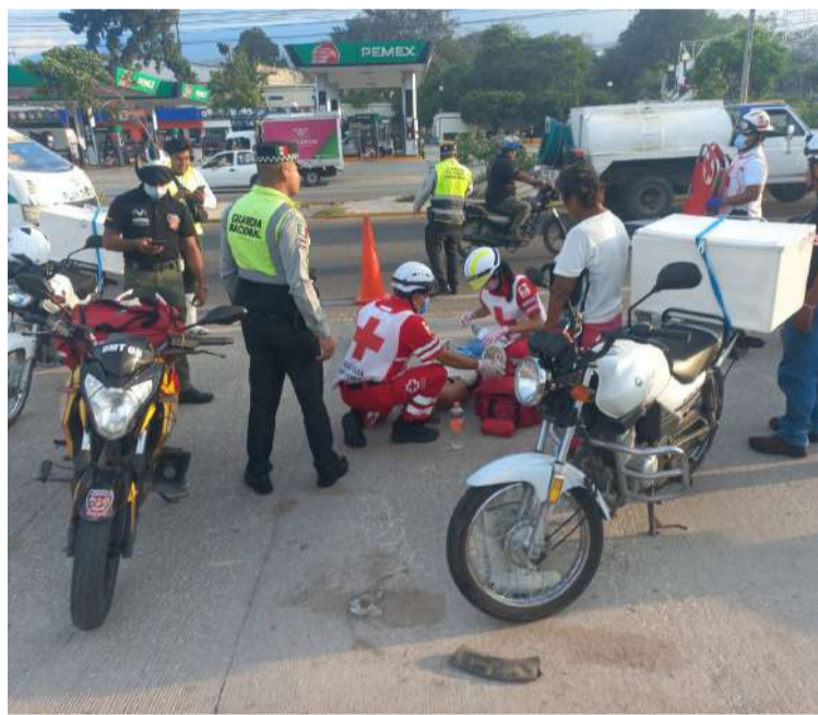
El lesionado recibió atención de emergencia y fue llevado a un hospital

fue proyectado varios metros sobre la cinta asfáltica, quedando tendido con visibles heridas.