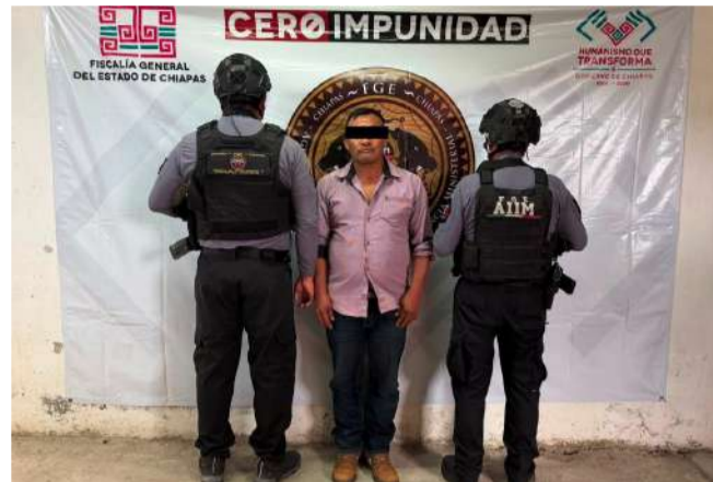
Cumplen orden de aprehensión por un crimen cometido en 2025

El conductor del camión presuntamente involucrado se dio a la fuga con rumbo al poniente, por lo que las autoridades iniciaron las investigaciones para dar con su paradero y deslindar responsabilidades.