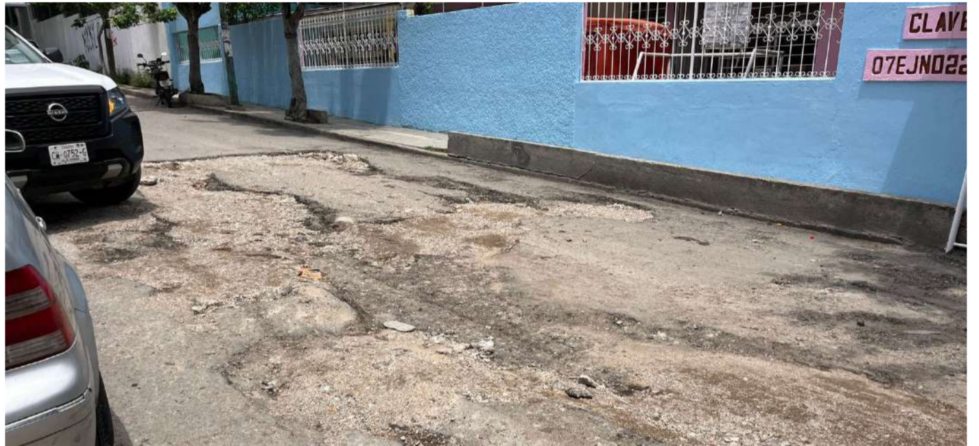
Conductores y peatones enfrentan diariamente riesgos por el deterioro del pavimento

Indicaron que la problemática es mayor debido a que frente a esta vialidad se encuentra un centro educativo, por lo que diariamente decenas de niñas, niños, madres,