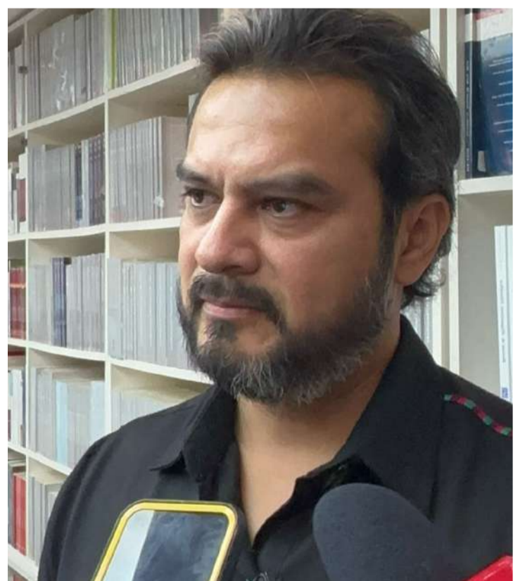
Secretario afirmó que el ciclo escolar concluyó con el plan de estudios cubierto