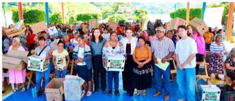
Programa benefició a 550 mujeres de comunidades rurales de Villaflores

Hasta el momento, el Ayuntamiento de Palenque no ha emitido una postura pública sobre los señalamientos formulados por la regidora.