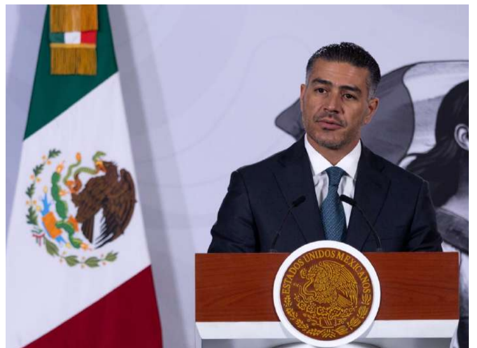
Sheinbaum destacó resultados en seguridad y exigió claridad sobre caso Zambada

“Nosotros no hacemos pactos con criminales, nunca. Actuamos todos los días, ni con criminales de la delincuencia organizada ni de cuello blanco, nunca. Somos un gobierno que se caracteriza por la honestidad y por nuestros princi-