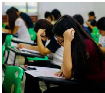
Cobach realizó jornada de ingreso en los 12 planteles con mayor demanda

Para el ciclo escolar 2026-2027A, el Colegio de Bachilleres de Chiapas proyecta una captación de 33 mil estudiantes de nuevo ingreso en sus 338 centros escolares distribuidos en todo el estado. Del total de