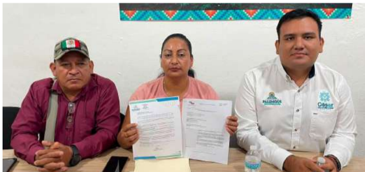
Caso fue turnado a instancias competentes para determinar la existencia o no de responsabilidades

sobre el manejo de los recursos públicos y consideró que, además de vulnerar las facultades del Cabildo al no convocarlo para analizar el tema, la ciudadanía tiene derecho a conocer el destino y la aplicación del