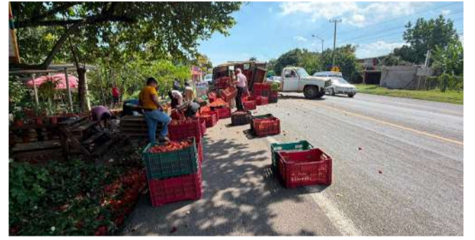
Accidente dejó pérdidas materiales y movilizó a cuerpos de emergencia

De manera preliminar, las autoridades señalaron que el accidente se habría originado por un ligero roce entre ambas unidades. No obstante, indicaron que será el peritaje el que determine las causas y responsabilidades del hecho. Los daños materiales fueron considerados menores.