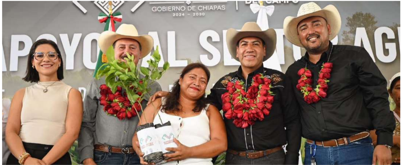
Productores recibieron herramientas, insumos y respaldo sanitario para fortalecer la actividad agropecuaria

en Metapa, junto con los seguros ganadero y agrícola, fortalece la protección de las y los productores ante afectaciones sanitarias y climáticas. En ese sentido, exhortó a reportar cualquier siniestro y convocó a continuar trabajando de manera coordinada en favor del campo de Emiliano Zapata y de Chiapas.