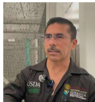
Planta en Chiapas reforzará combate al gusano barrenador del ganado

Juan Manuel Blanco/ Ultimátum METAPA DE DOMÍNGUEZ