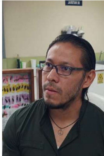
Especialistas realizarán trabajo comunitario para diseñar estrategias preventivas con enfoque intercultural

Advirtió que algunas de estas enfermedades representan un desafío adicional por su evolución silenciosa. En el caso de la enfermedad de Chagas, explicó que ocho de cada diez personas infectadas no presentan síntomas durante años,