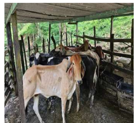
Operativo permitió localizar semovientes sustraídos en la región norte de Chiapas

Habitantes del municipio de Tuxtla Chico y automovilistas que transitaban por la zona se solidarizaron con los ocupantes del camión y colaboraron en la recolección del rambután, ayudando a colocarlo nuevamente en las rejillas, luego de que la fruta quedara dispersa sobre el pavimento.